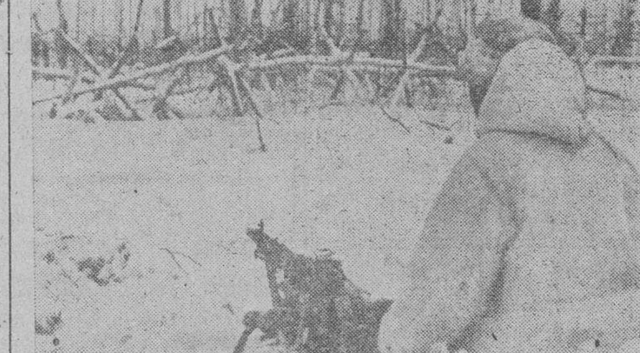
Un nido de ametralladora del Ejército alemán en el frente del lago Ámoo

puño cerrado, para no malgastar el fruto y sudores que cuesta la dura brega de la tierra.