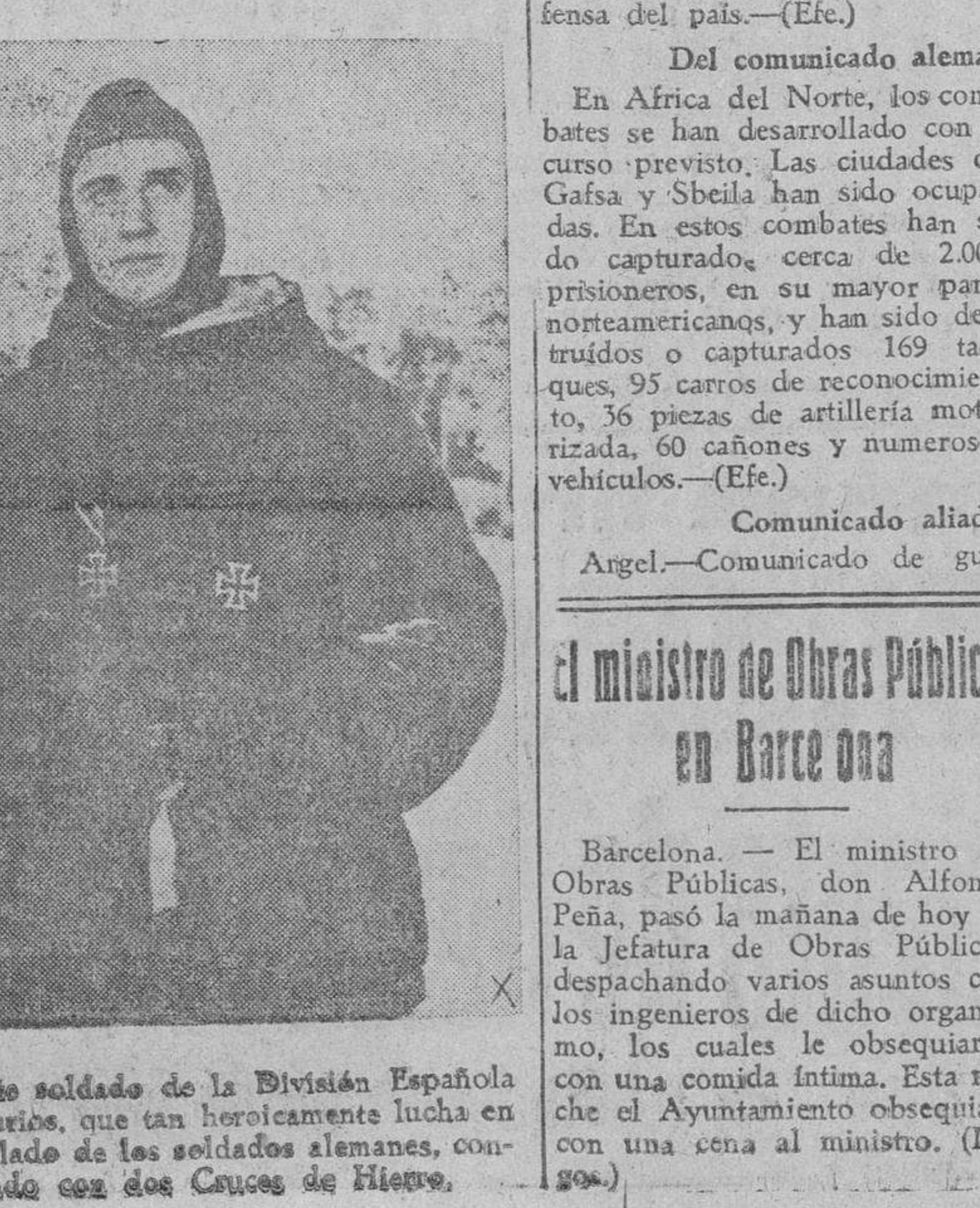
Un valiente soldado de la División Española de Voluntarios, que tan heroicamente lucha en el Este al lado de los soldados alemanes, condecorado con dos Cruces de Hierro.