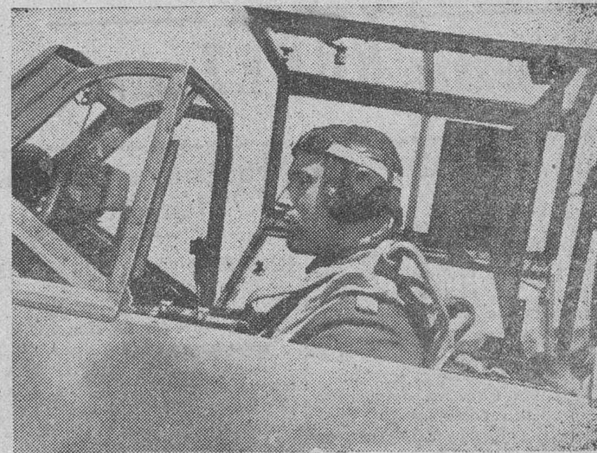
El mayor Oesau, condecorado con las hojas de encina de la Cruz de Caballero, en el momento de emprender el vuelo para cumplir el objetivo asignado.