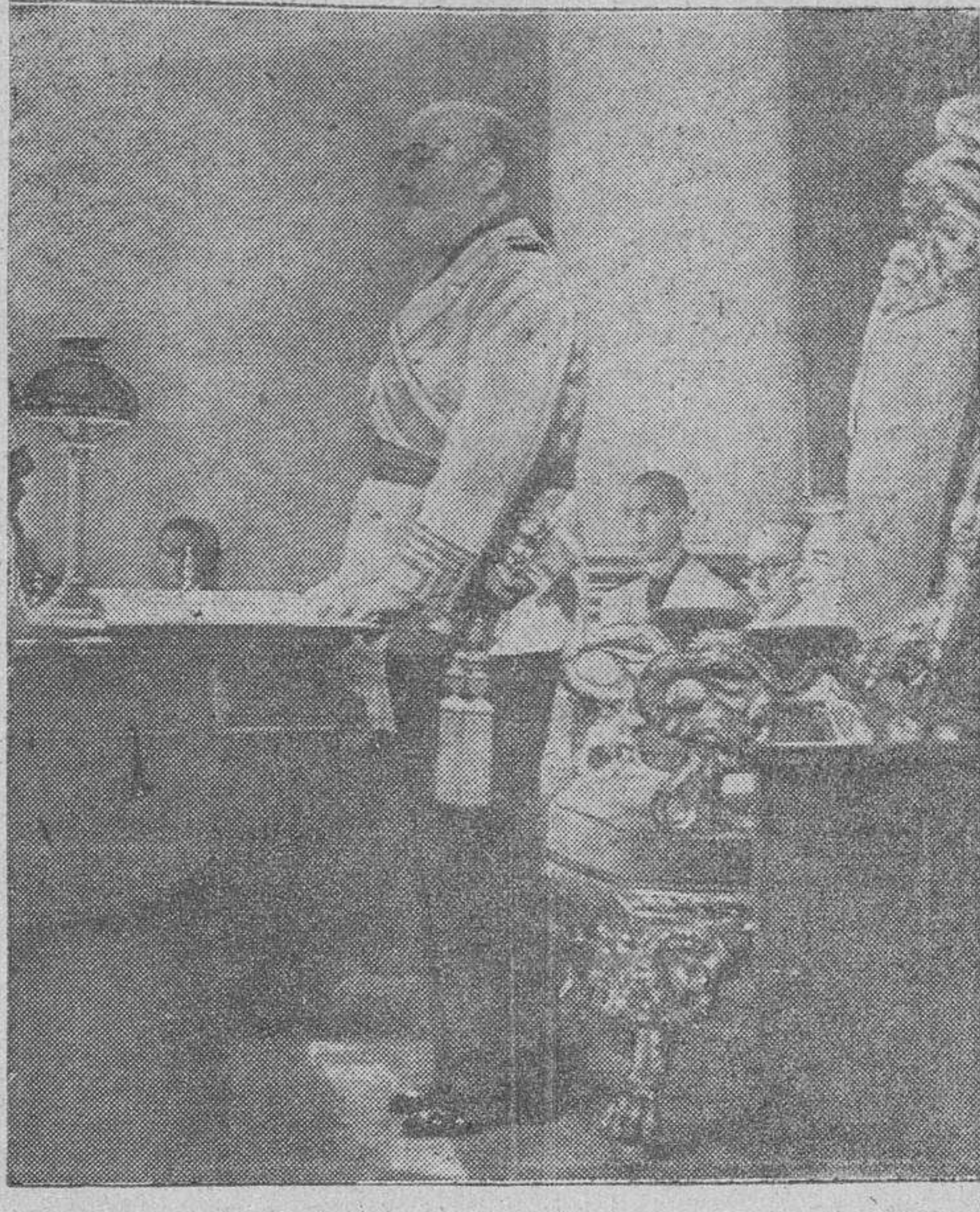
S. E. el Jefe del Estado en el momento de pronunciar su trascendental discurso, después de la jura de los Consejeros nacionales de F. E. T. y de las JONS