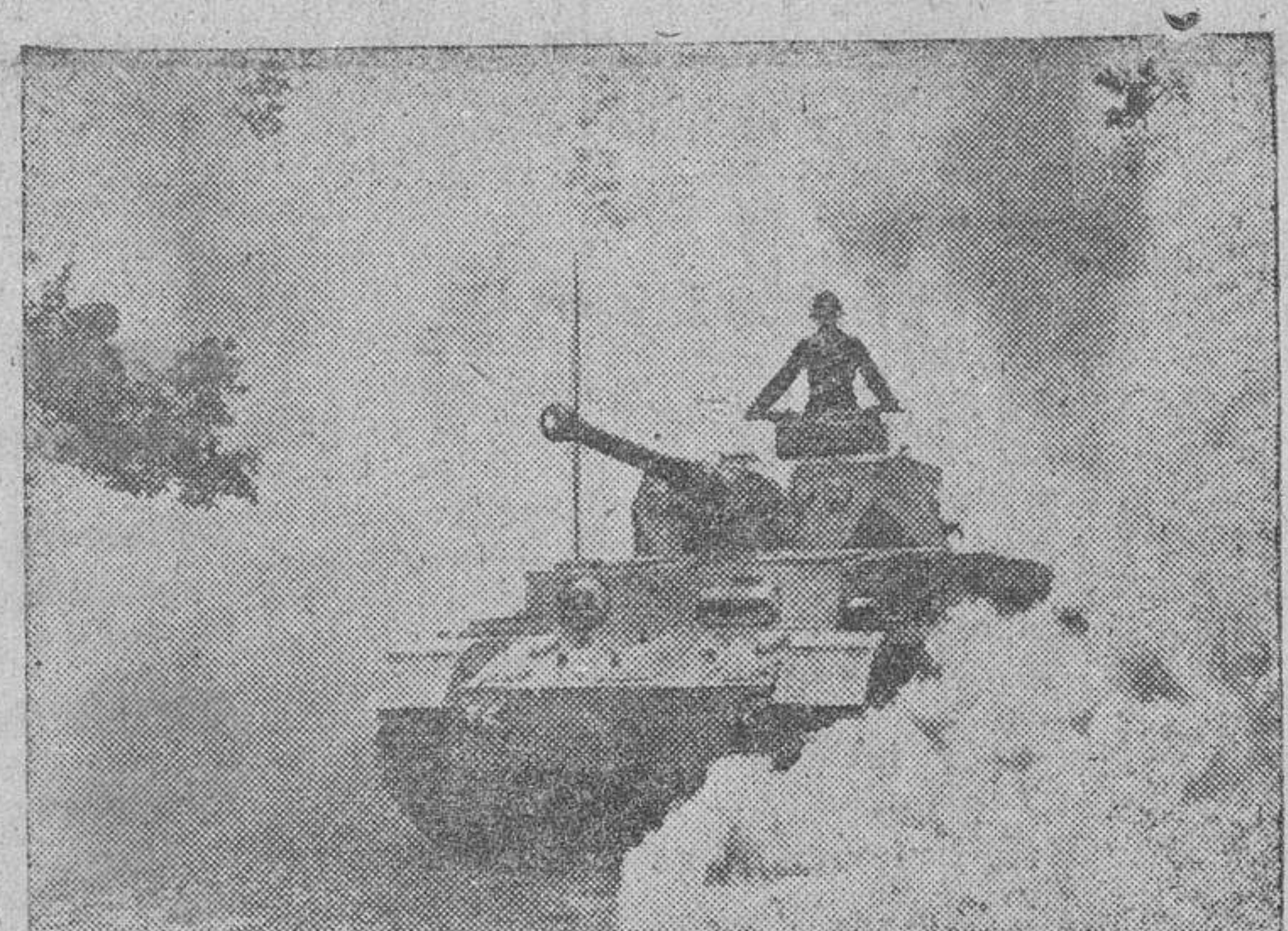
Uno de los últimos modelos de tanques ligeros alemanes, armado con un cañón de tiro rápido, en marcha hacia las primeras líneas

Comunicado alemán Gran Cuartel General del Fuhrer.—El alto mando de las fuerzas armadas alemanas comunica: "Los nuevos ataques soviéticos contra las posiciones alemanas en el Cáucaso y en el sector del Volga y del Don, fracasaron también ayer, con elevadas pérdidas para el enemigo. Entre el Volga y el Don, los ataques en masa, efectuados por tropas de infantería y formaciones blindadas del adversario, continuaron con duros combates, en el curso de los cuales nuestras tropas quedaron victoriosas. Prisioneros y botín fueron capturados por nuestras fuerzas, que, además, destruyeron 54 carros de combate.