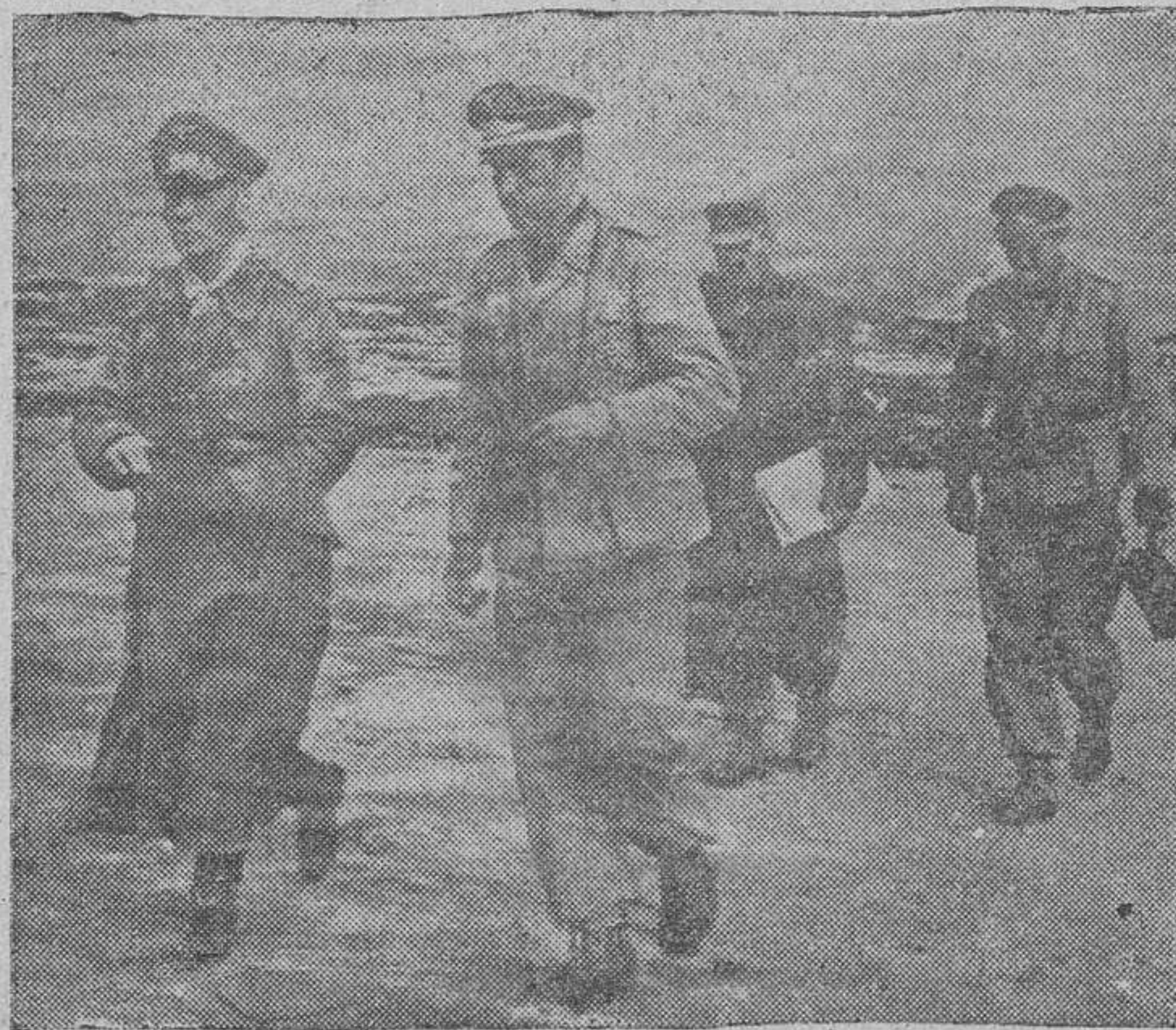
El mariscal general Rommel, acompañado por los oficiales del arma aérea, se dirige a las posiciones avanzadas del frente.

sa escolta de destructores y que fué alcanzado de lleno por tres torpedos. (Efe.) Incorporación a filas de reservistas franceses Rabat.—Radio Marruecos ha radiado una comunicación oficial ordenando la presentación en filas de los reservistas franceses de los ejércitos de Tierra y Aire de las quintas de 1939 a 1936. Se deberán presentar en los cuarteles entre los días 24 de noviembre y 1.º de diciembre. Se excluyen de la presentación en