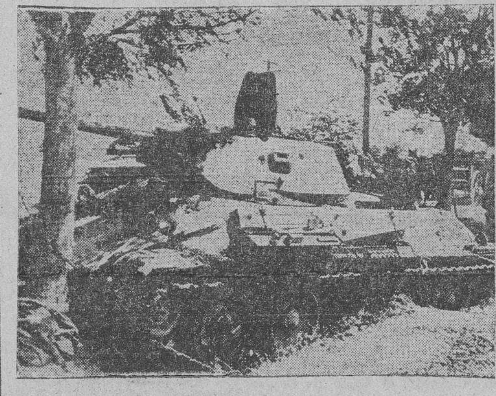
Un tanque ruso inutilizado en el Cáucaso.