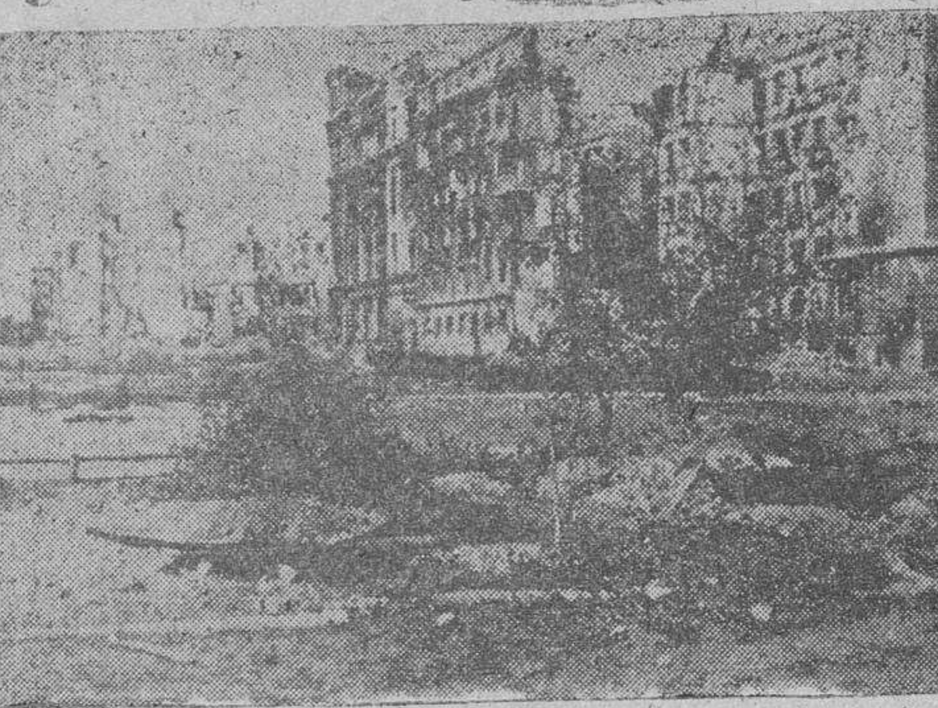
En el centro de Stalingrado, completamente en ruinas, tropiezan muchas veces los soldados alemanes con disimulados fortines subterráneos construidos en las calles...