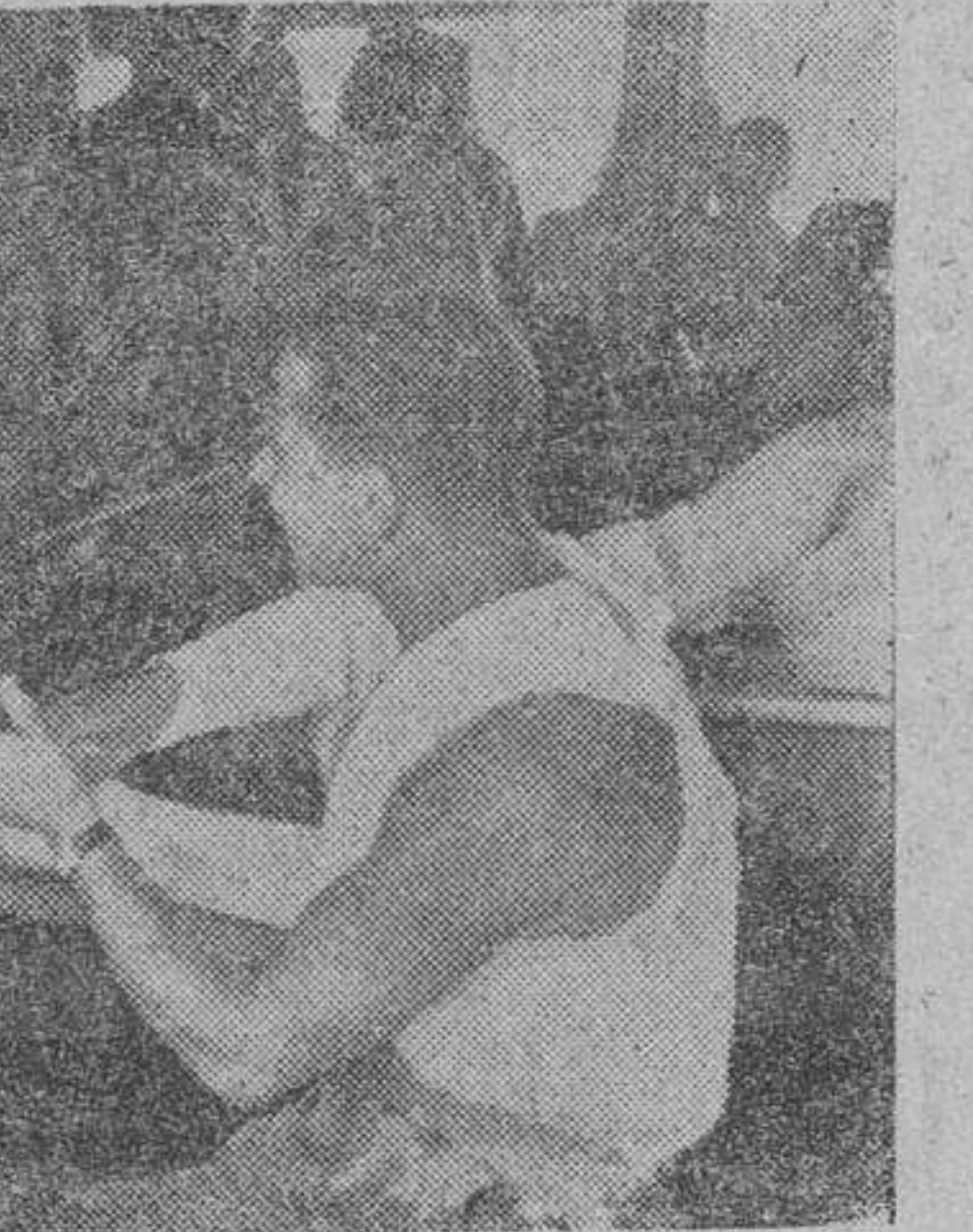
Combatientes del Cáucaso alemanes son atendidos a bordo de un barco-azarero por la población civil búlgara, que los trata con el máximo cariño y cuidado, deseándoles la máxima salud al volver a la patria.