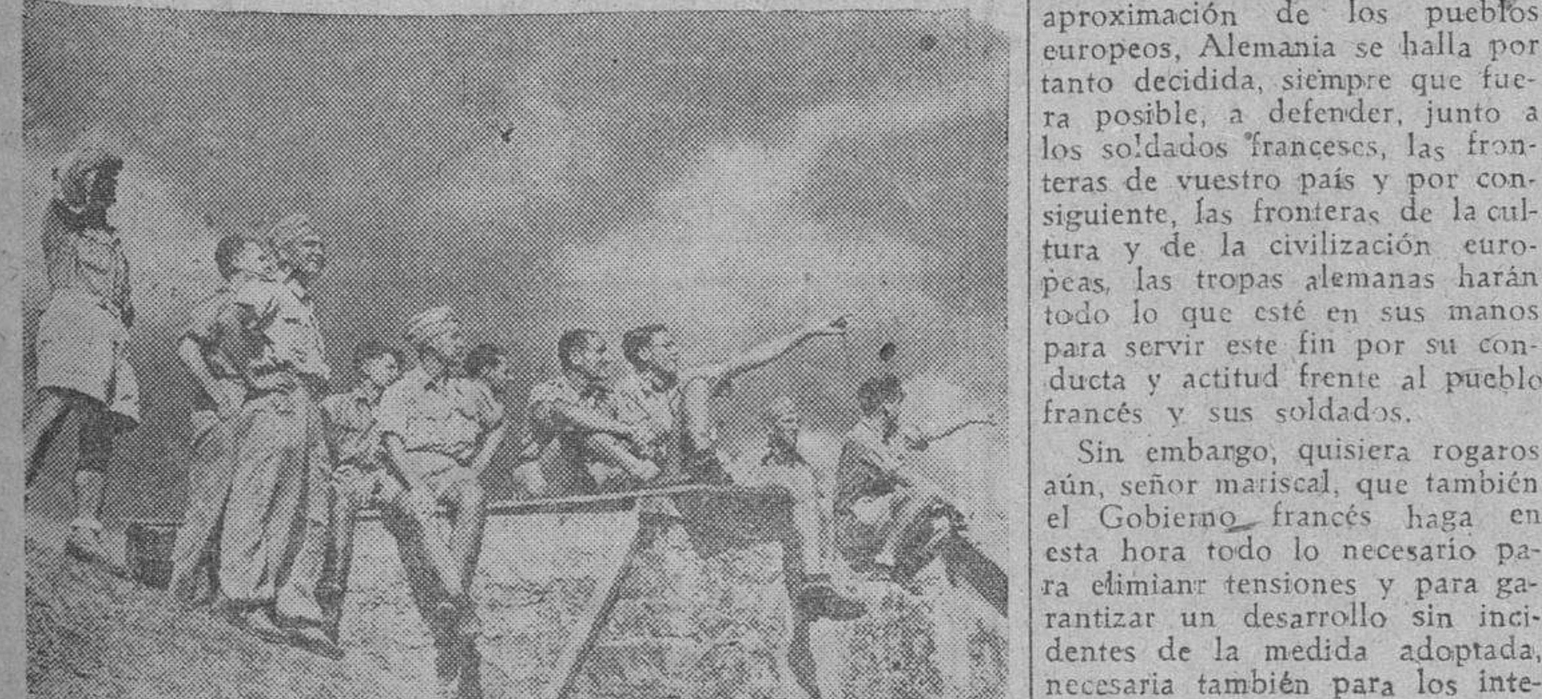
El personal de servicio en un aeródromo alemán sigue con el mayor interés el vuelo de los aviones que regresan de una incursión sobre Malta.