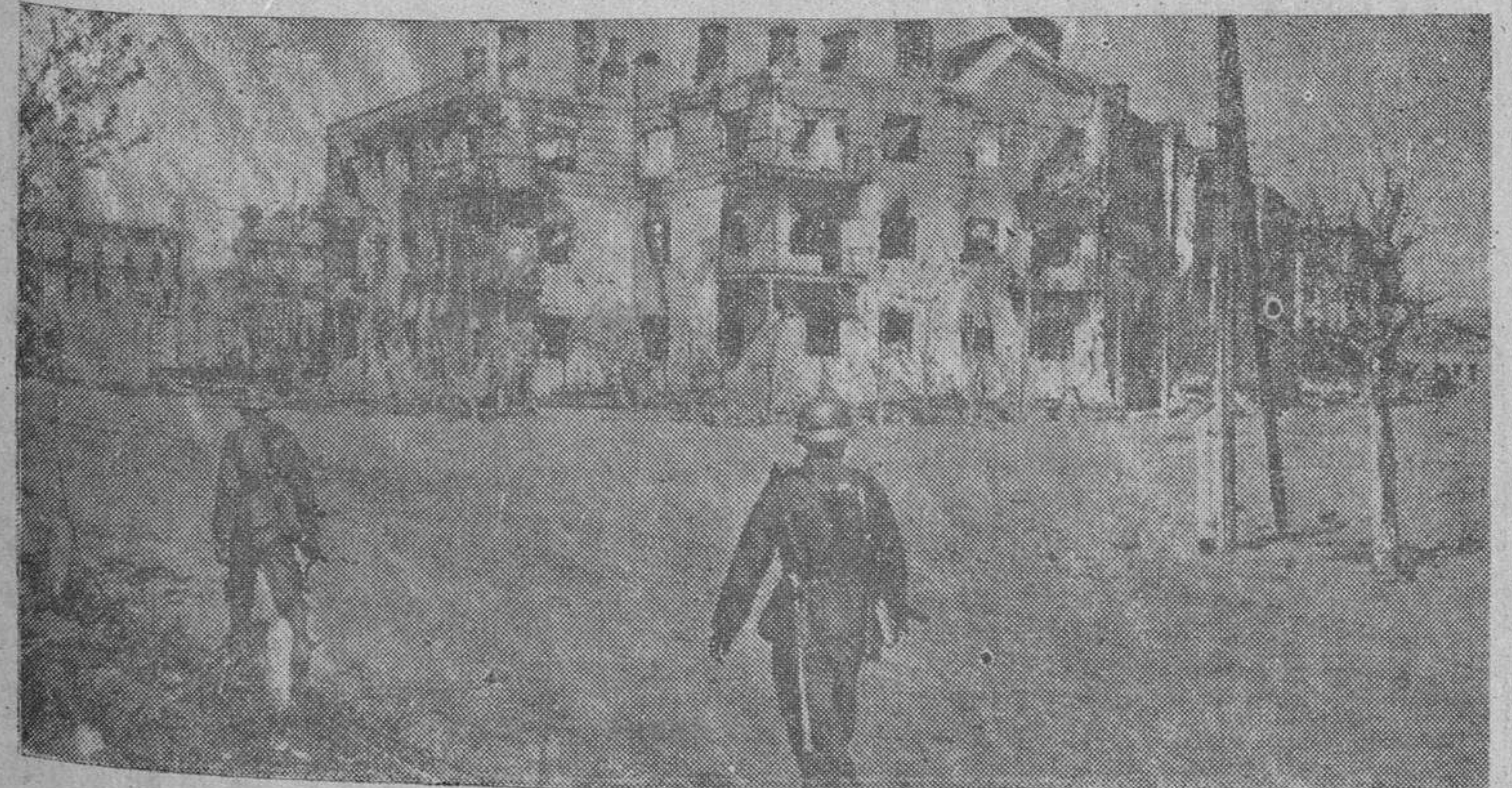
Una elocuente visión de la lucha en las calles de la ciudad soviética, conquistadas palmo a palmo por los soldados del Reich