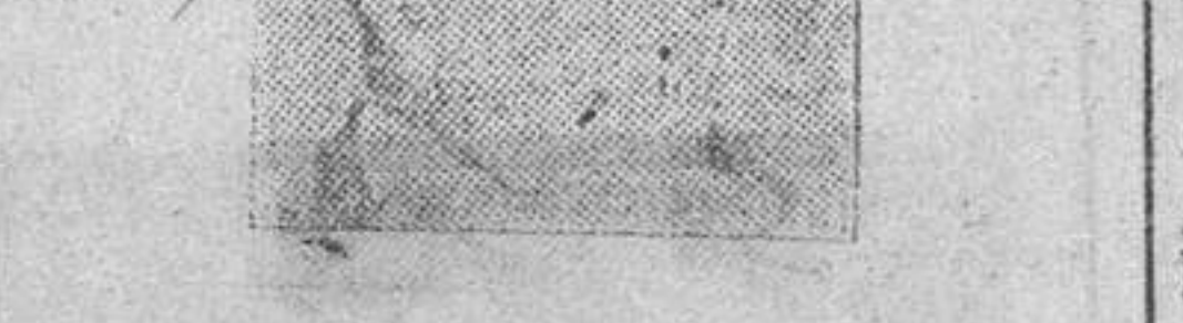
Enamorado del progreso industrial, trabajó en las fábricas Ford.

Esteban Horthy representaba por su formación educativa la nueva juventud húngara, heredada de proverbiales virtudes militares y enamorado de los progresos técnicos de nuestra época. En 1929 Esteban Horthy estuvo trabajando en las fábricas Ford, donde pasó sucesivamente por los talleres de montaje de tractores, los de construcción de automóviles y la sección de estudios. Vuelto a su patria, se inscribió como piloto en la escuela de aviación. Desde los puntos de vista moral, político y constitucional, su elección representaba el máximo de garantías de continuidad. La cuestión es saber hoy día qué personalidad podría reunir un conjunto de condiciones tan favorables. La indiscutible autoridad que goza el almirante Horthy, su patriotismo y su sentido de las realidades históricas húngaras le permitirán, sin duda, hacer una lección que responda a los intereses permanentes y a las exigencias actuales de su patria.