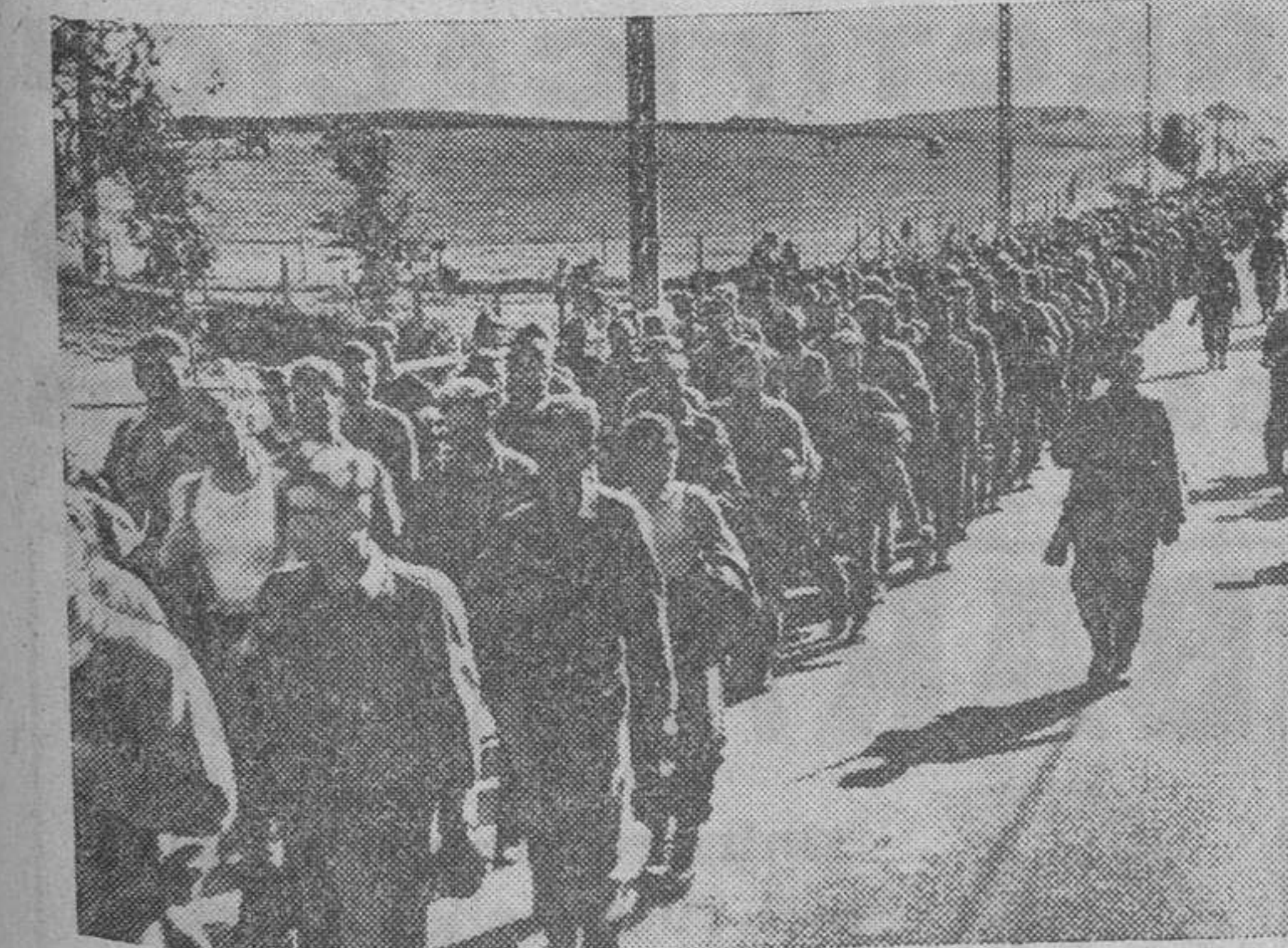
La columna de soldados ingleses capturados en Dieppe marchan al campo de concentración donde serán internados hasta el fin de la guerra.