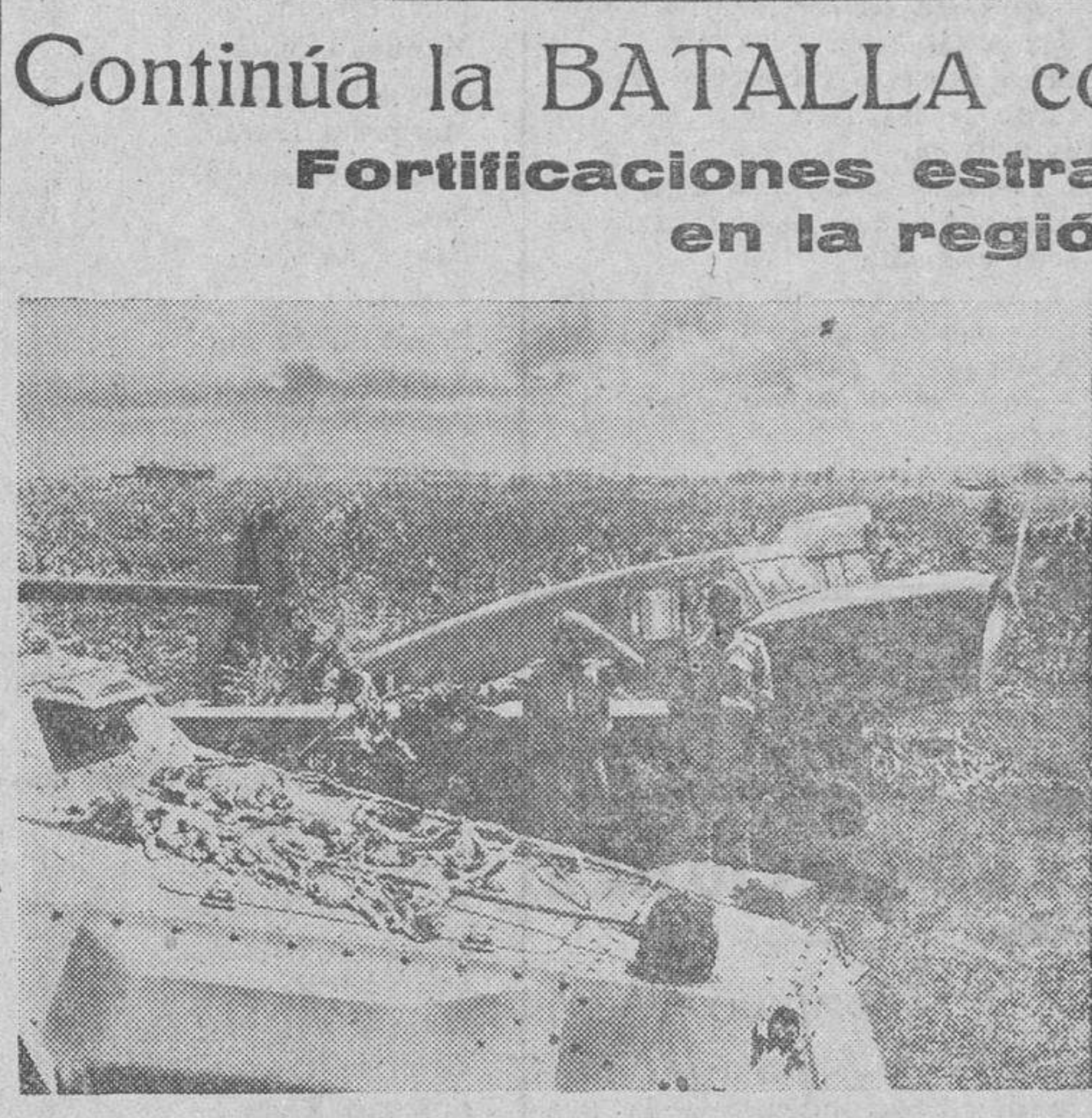
Un avión alemán del servicio de mensajes aterriza en un aeropuerto recién ocupado por los tanques. Las noticias de la columna blindada de avance serán transmitidas rápidamente al Alto Mando.

Continúa la BATALLA con creciente encarnizamiento. Fortificaciones estratégicas conquistadas en la región del TEREK