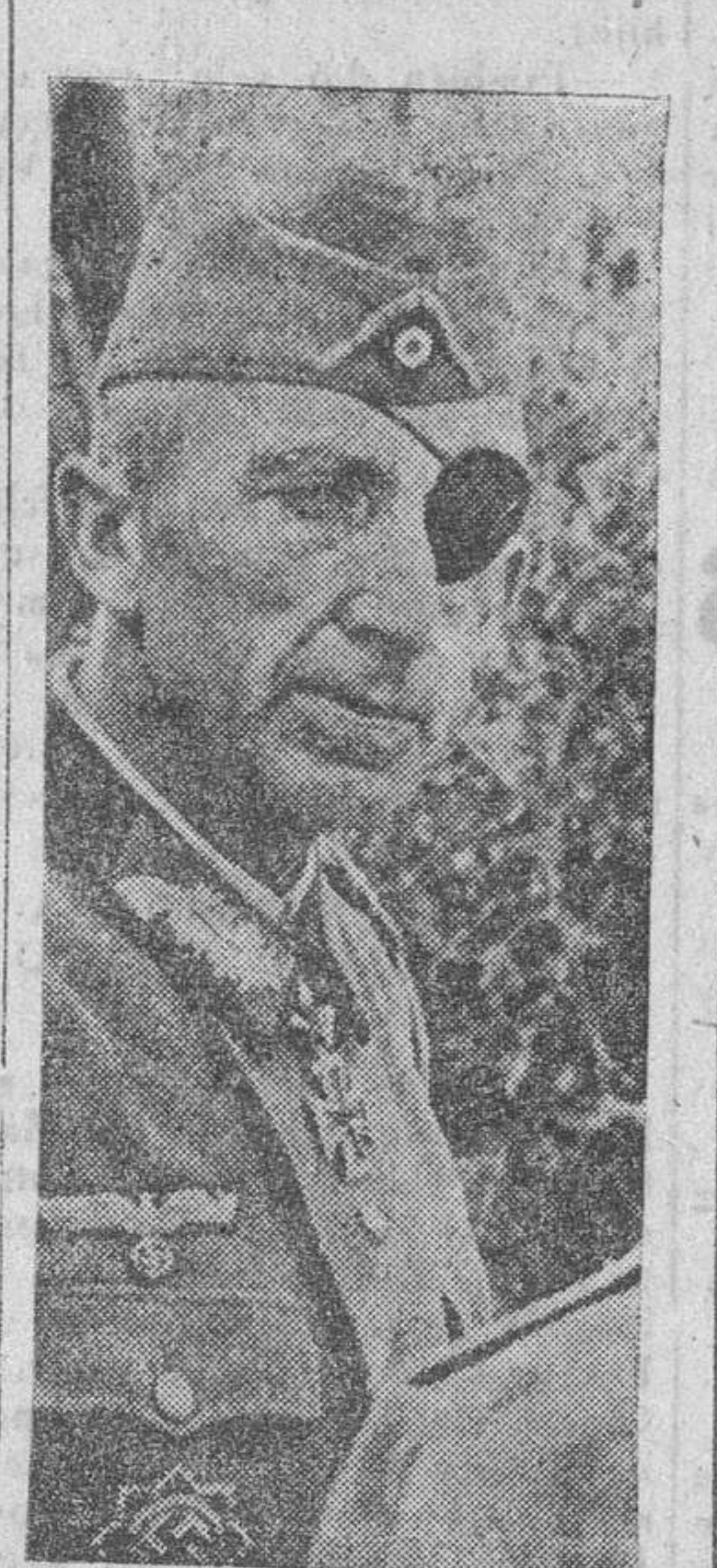
El general alemán Ludwig Wolf condecorado como el centésimo soldado alemán que merece el premio de los laureles de roble de la Cruz de Hierro.