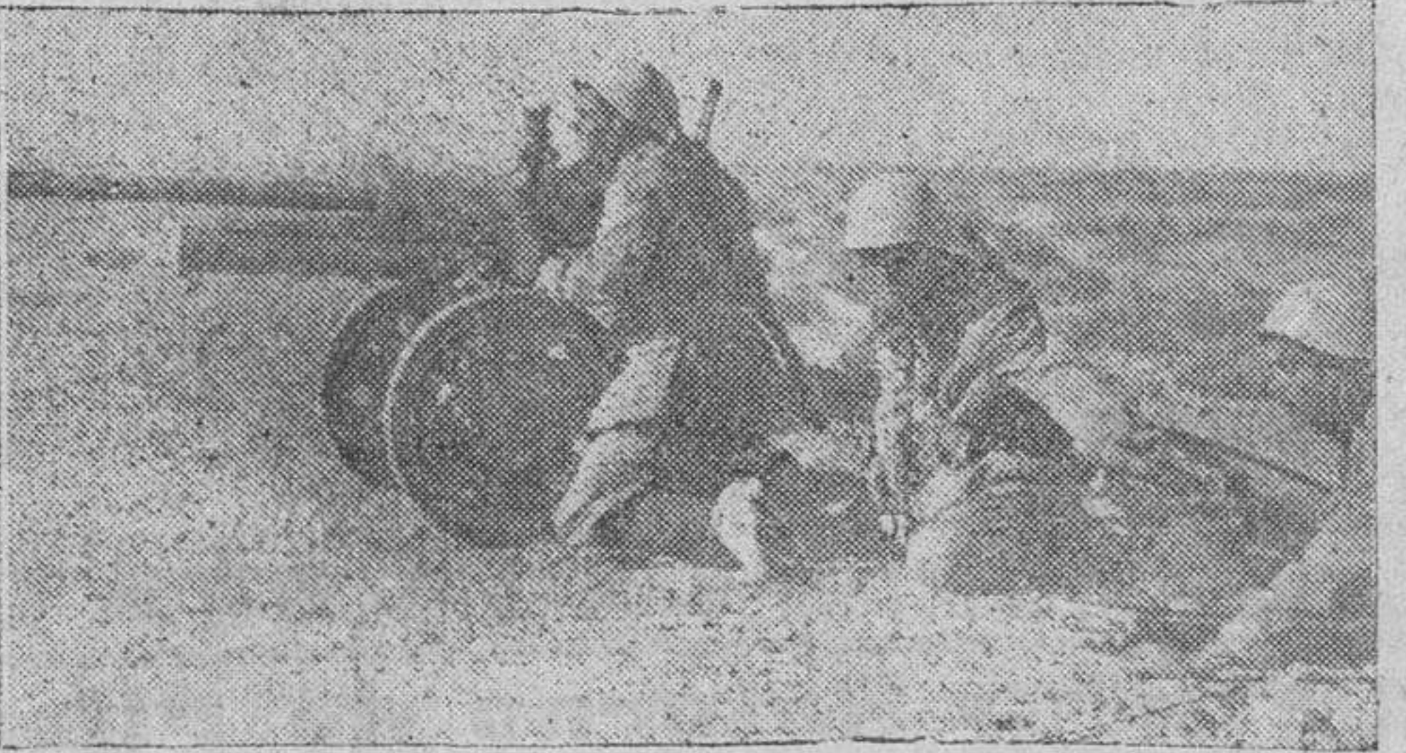
Una batería antitanque italiana emplazada en la zona de operaciones del Norte de Africa