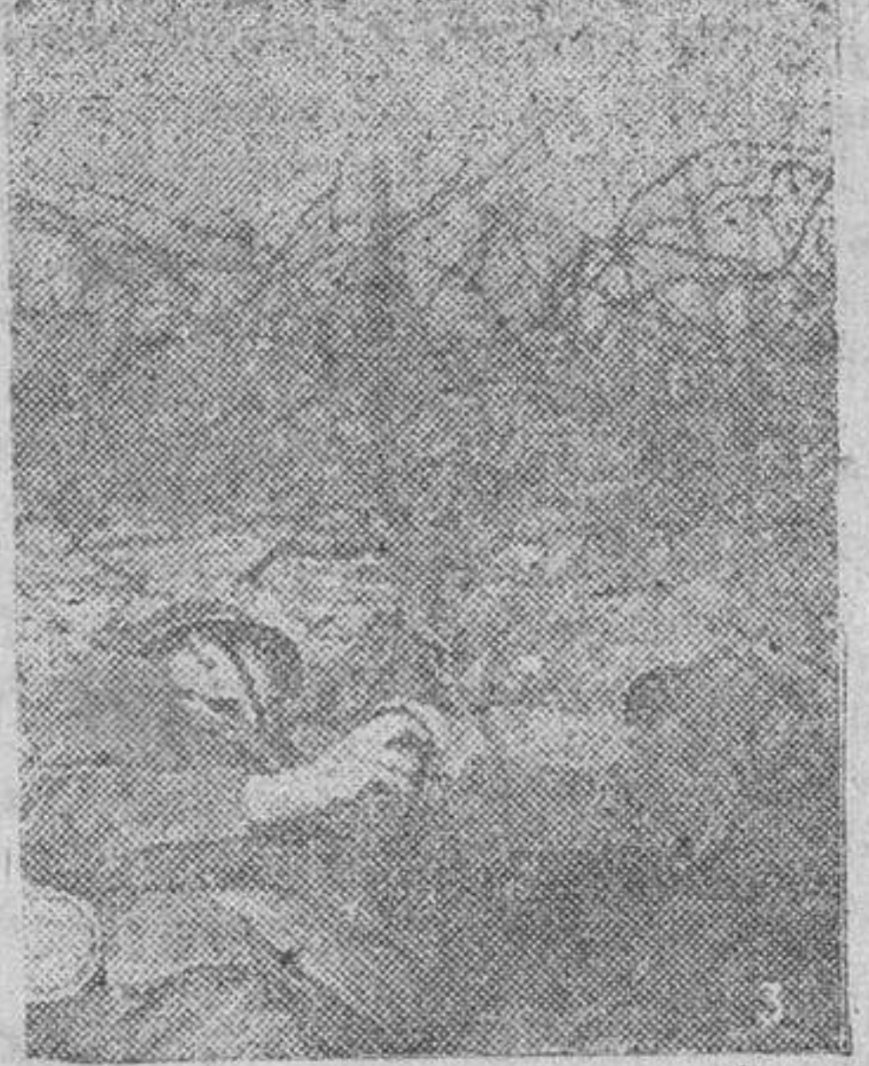
Soldados de ingenieros alemanes colocando cargas de dinamita para deshacer las alambradas enemigas.

se concentran especialmente sobre Düsseldorf, donde han sido provocados daños materiales e incendios en los barrios habitados. Entre otros edificios han sido alcanzados dos hospitales. La población civil ha sufrido pérdidas. Los cazas nocturnos y la artillería de la DCA derribaron a veintiséis de los aviones asaltantes.