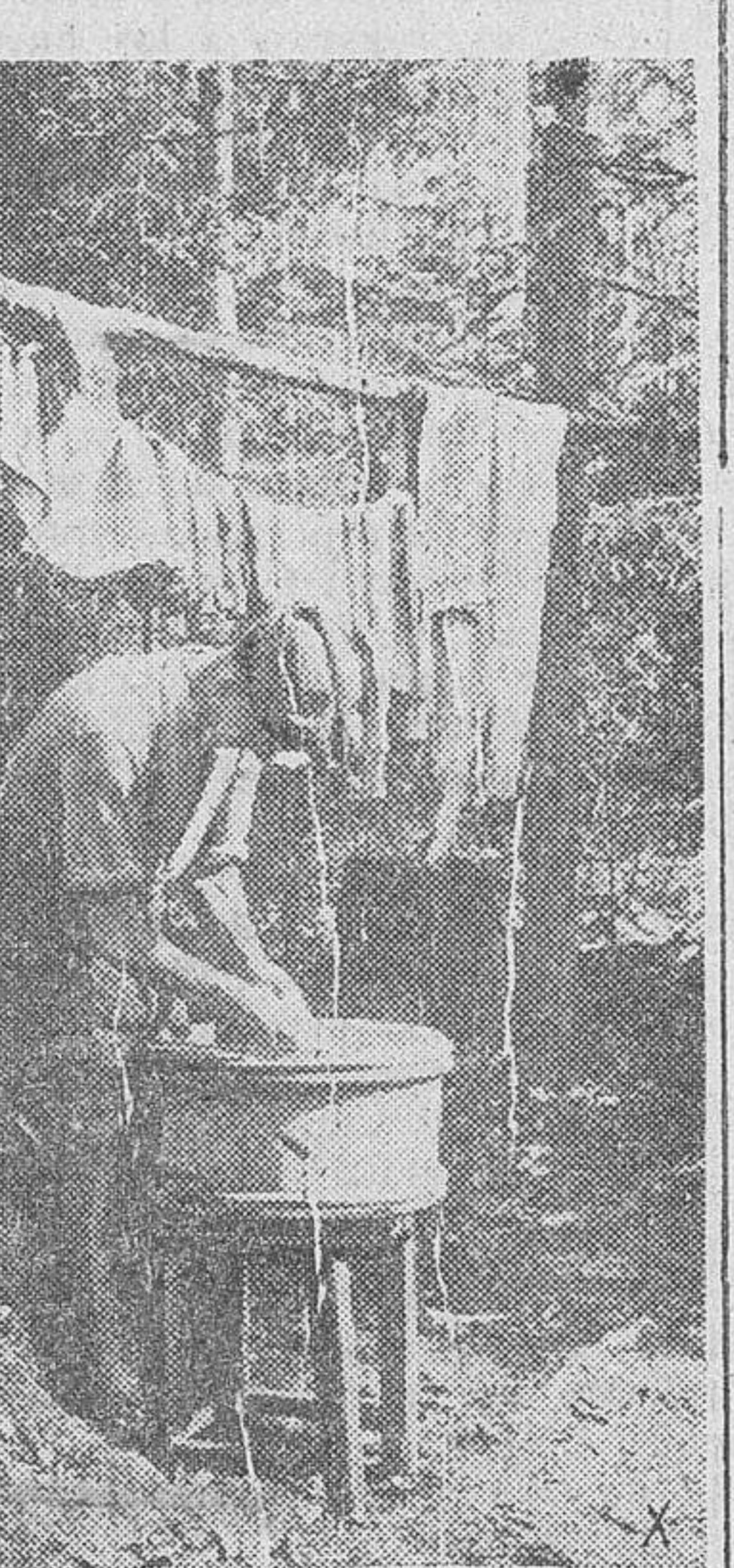
Con los soldados alemanes en el frente del Este.—El sol ya calienta y la vida comienza nuevamente al aire libre.

En la noche última, los aviones enemigos efectuaron un breve ataque contra Norwich. Fueron causados daños a consecuencia de los incendios, en barrios residenciales y comerciales. Resultaron muertas algunas perso-