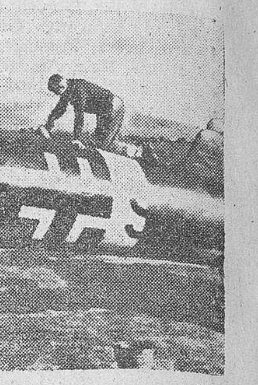
La última inspección del mecánico, antes de que el avión emprendiera el vuelo.

VIENE DE PRIMERA PLANA Reginald, que ha sido hecho prisionero por los alemanes durante la ocupación de Tobruk, ha declarado que si Inglaterra trata ahora de presentar la pérdida de Tobruk como un acontecimiento sin importancia, tal afirmación constituye una ofensa para los 5.000 soldados ingleses que han