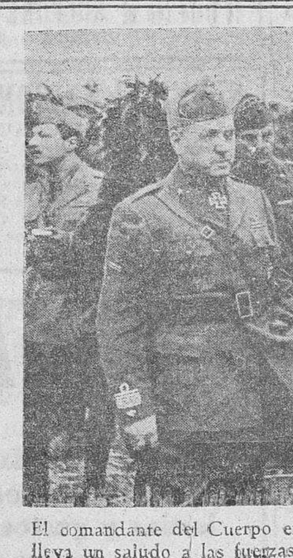
El comandante del Cuerpo expedicionario italiano en Rusia, lleva un saludo a las fuerzas destacadas en la primera línea

Granada.—Esta noche el ministro Secretario General del Partido, camarada Arrese, se reunió a cenar con los camaradas de la Vieja Guardia granadina. Con este acto terminó el viaje oficial del ministro, que mañana regresará a Madrid. (Logos.)