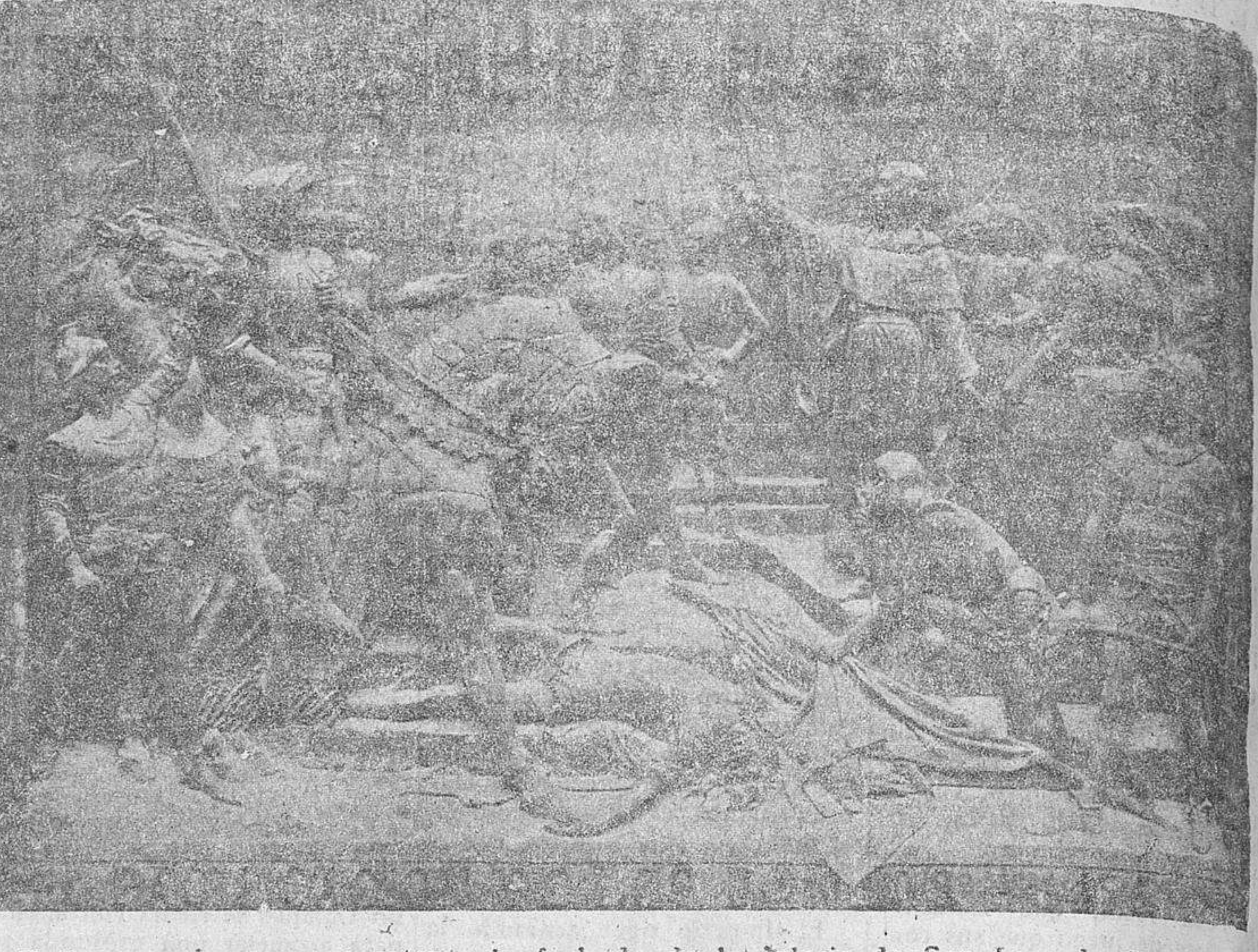
Relieve en bronce que ostenta la fachada de la iglesia de San Juan de Sahagún (Obra del escultor Marinas)

Ciertamente que hoy en día, los salmantinos están en deuda con su Santo Patrón. No reviste en la calle, la fiesta de San Juan de Sahagún, la merecida importancia, y solamente en los tiempos se conmemora debidamente el día del pacificador de los Bandos de Salamanca.