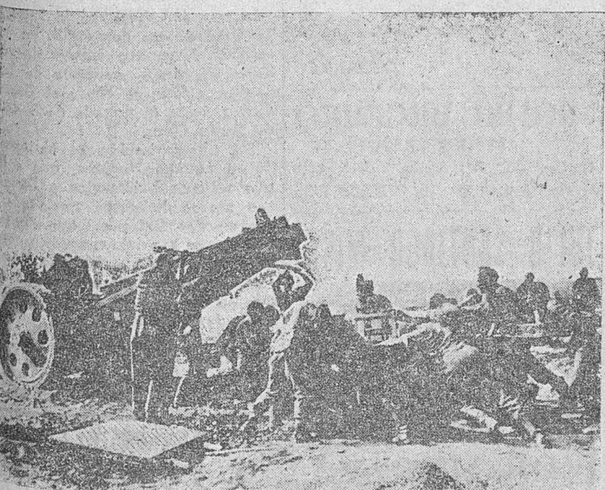
La pesada Artillería alemana en Rusia.

Dos grandes mercantes hundidos por la aviación alemana en el Artico