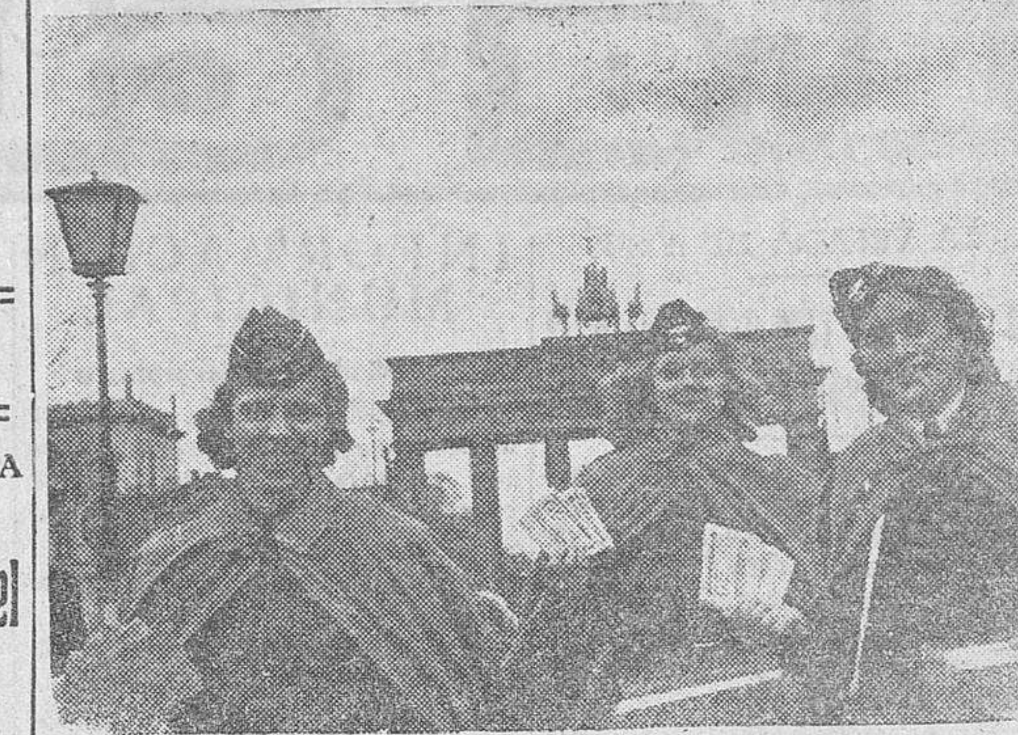
Jóvenes alemanes de la obra Auxilio de Invierno, en un día de reparto de billetes de la lotería benéfica de esta organización, que tanto éxito ha tenido últimamente.

La España de Franco monta su guardia junto al manantial de la vida mediante el SEGURO DE MATERNIDAD.