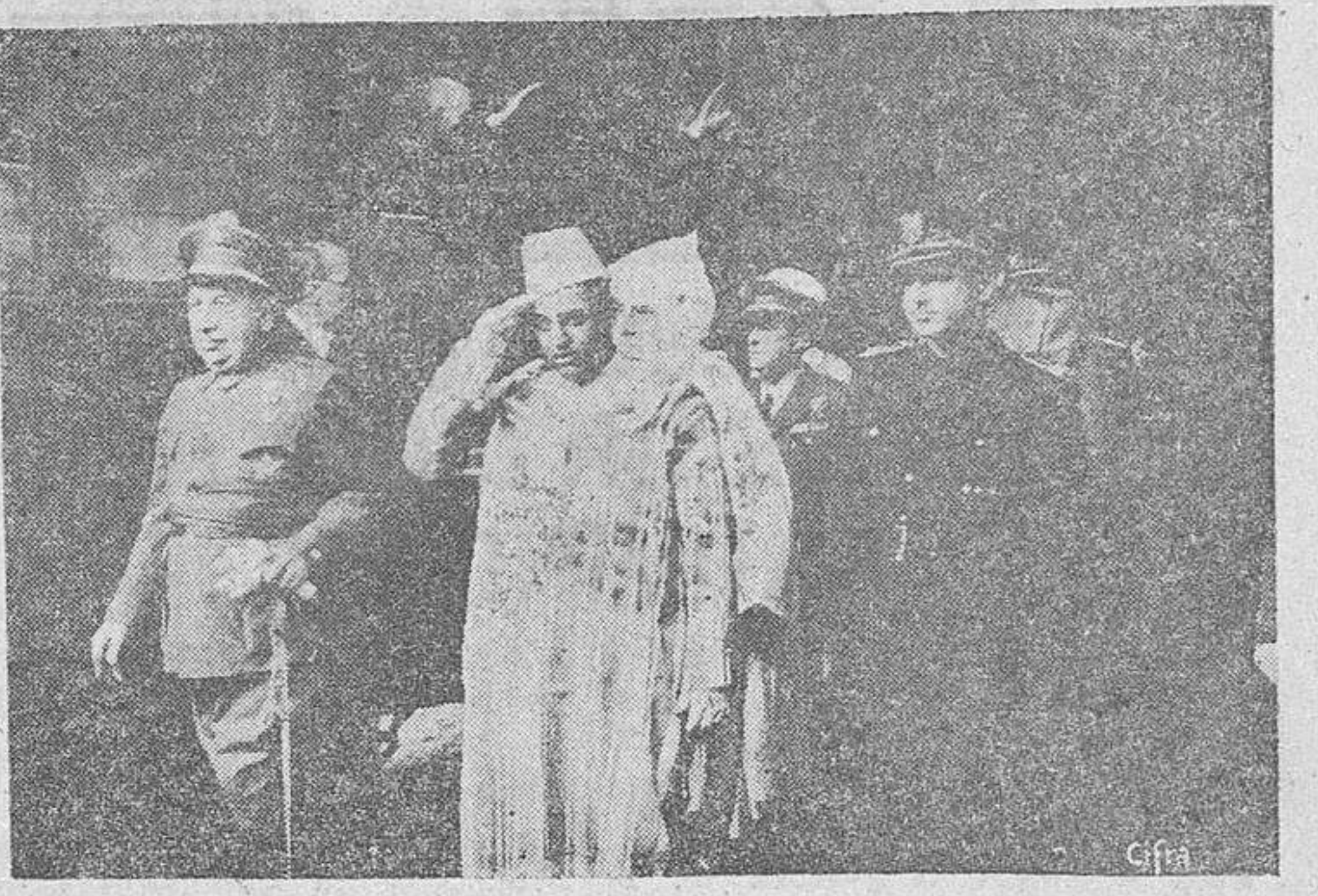
S. A. I. el Jalifa, con el ministro de Asuntos Exteriores, el general Orgaz y personalidades del séquito, a su llegada a Madrid (Foto Cifra).