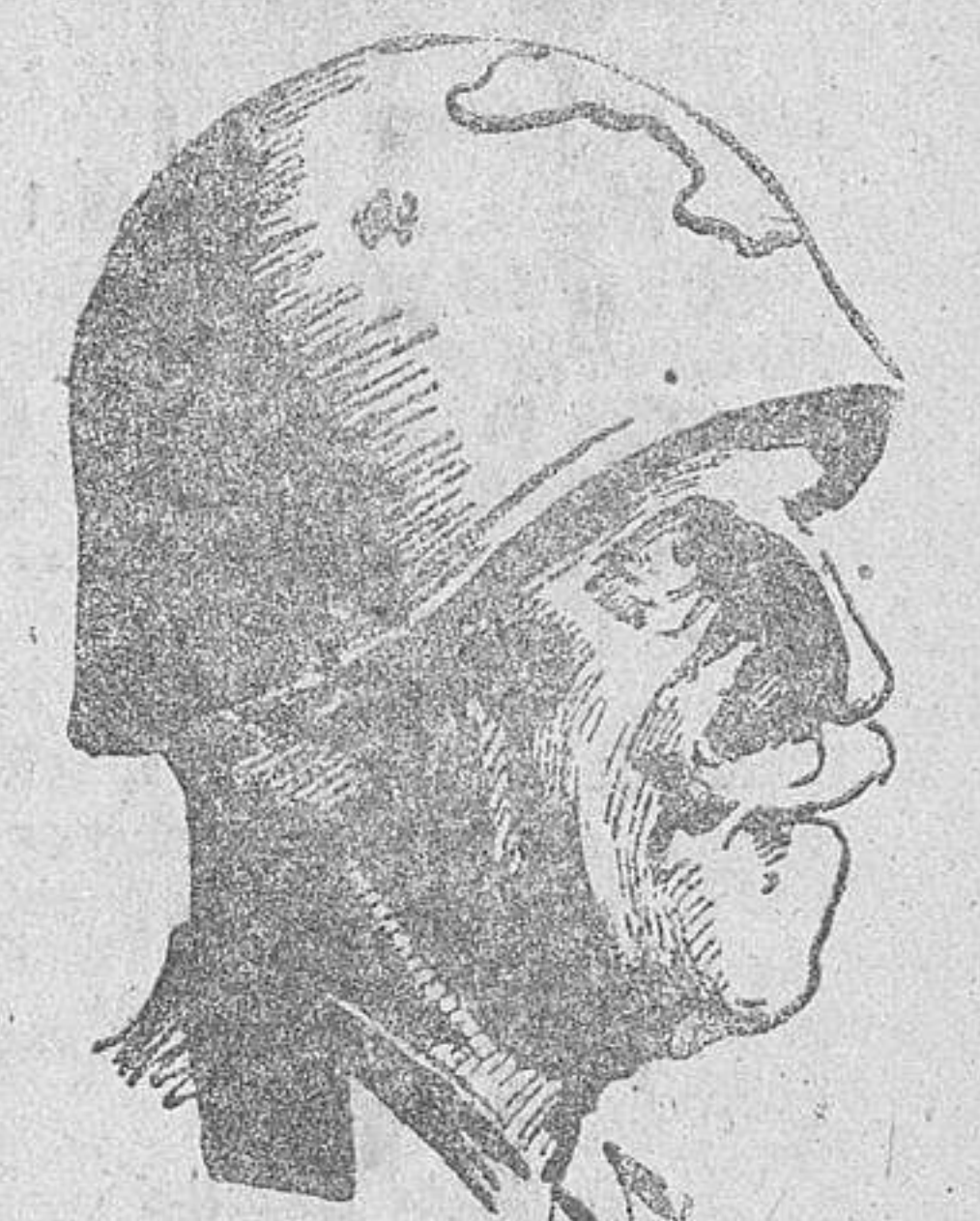
El general TOJO

Mujeres de Acción Católica de España. Madre buena: Ama mucho a tus hijos, pero no en detrimento de sus almas.