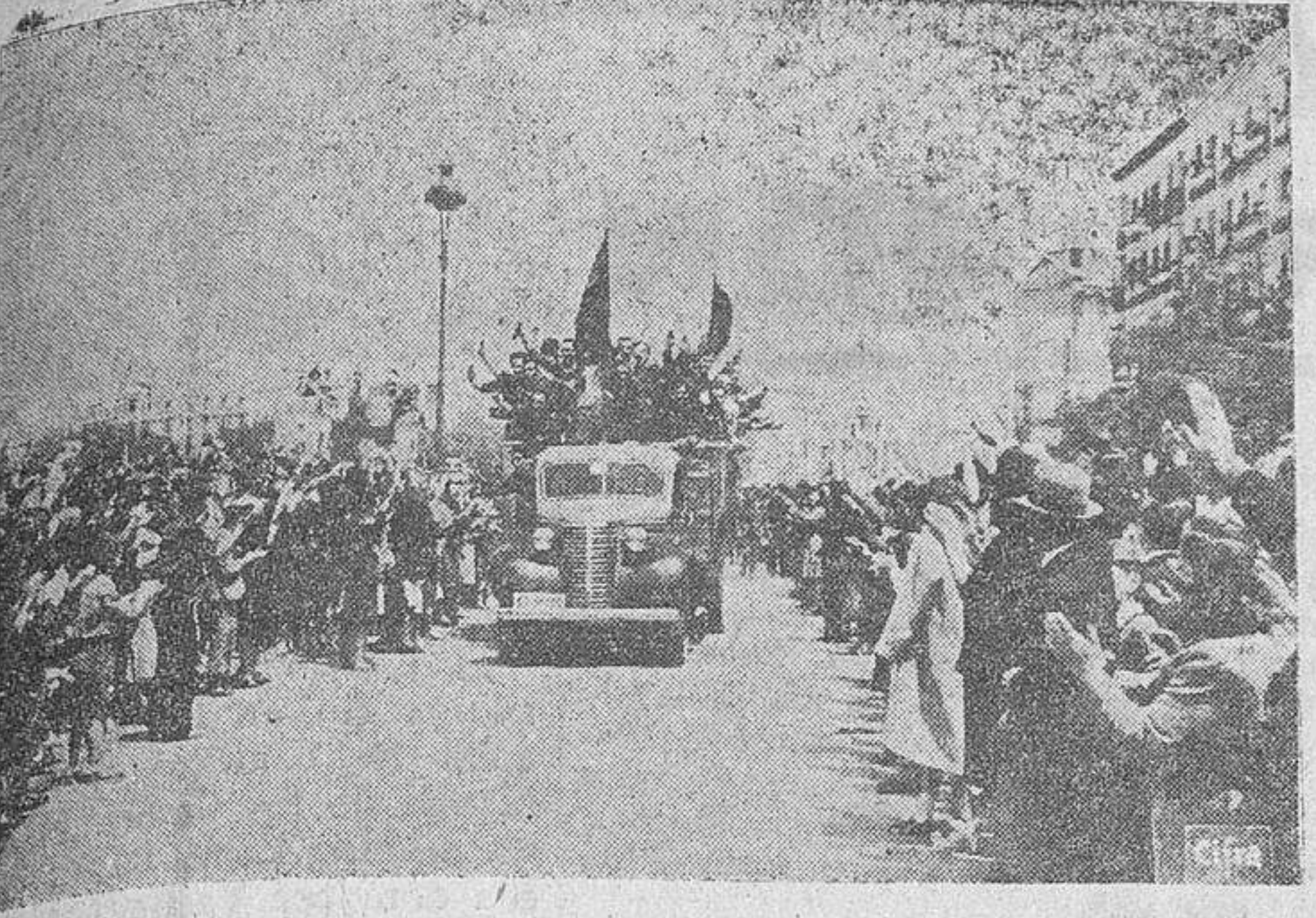
El público, apiñado en las calles de Madrid, aclama a los voluntarios de la División Azul.