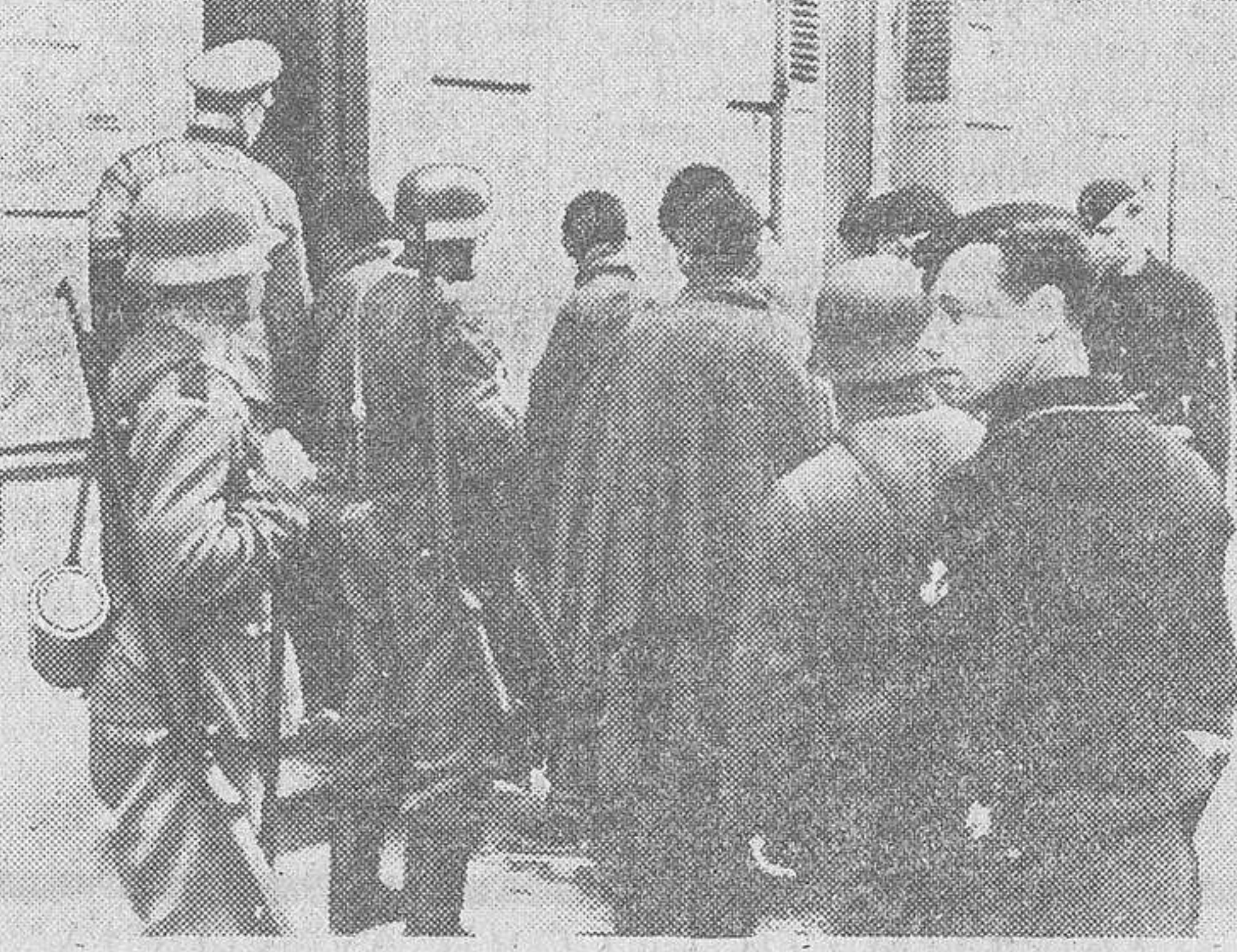
Prisioneros ingleses en el pequeño puerto francés St. Nazaire, después del fracasado golpe de mano ordenado por Churchill.