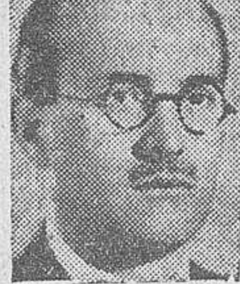
El ministro de Educación Nacional, don Juan Ibáñez Martín, en el momento de la inauguración de la exposición.

Madrid. — Organizado por el Patronato de la Biblioteca Nacional, en colaboración con el Archivo Histórico Nacional, con motivo de la Fiesta del Libro, se ha celebrado esta mañana, en la Biblioteca Nacional, el acto inaugural de la exposición de libros, en la que se exponen, ordenados por siglos, ejemplares preciosos y primeras ediciones de las diversas etapas del arte tipográfico en España, desde sus incunables hasta las más artísticas ediciones de estos años.