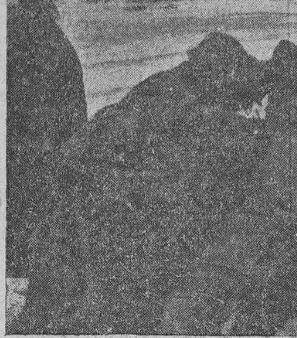
Voluntarios españoles colotando un antitanque de posición

Según cuentan los prisioneros, la masa de los atacantes estaba constituida por reclutas jóvenes y mal instruidos y por un batallón de caucásicos bien armados.