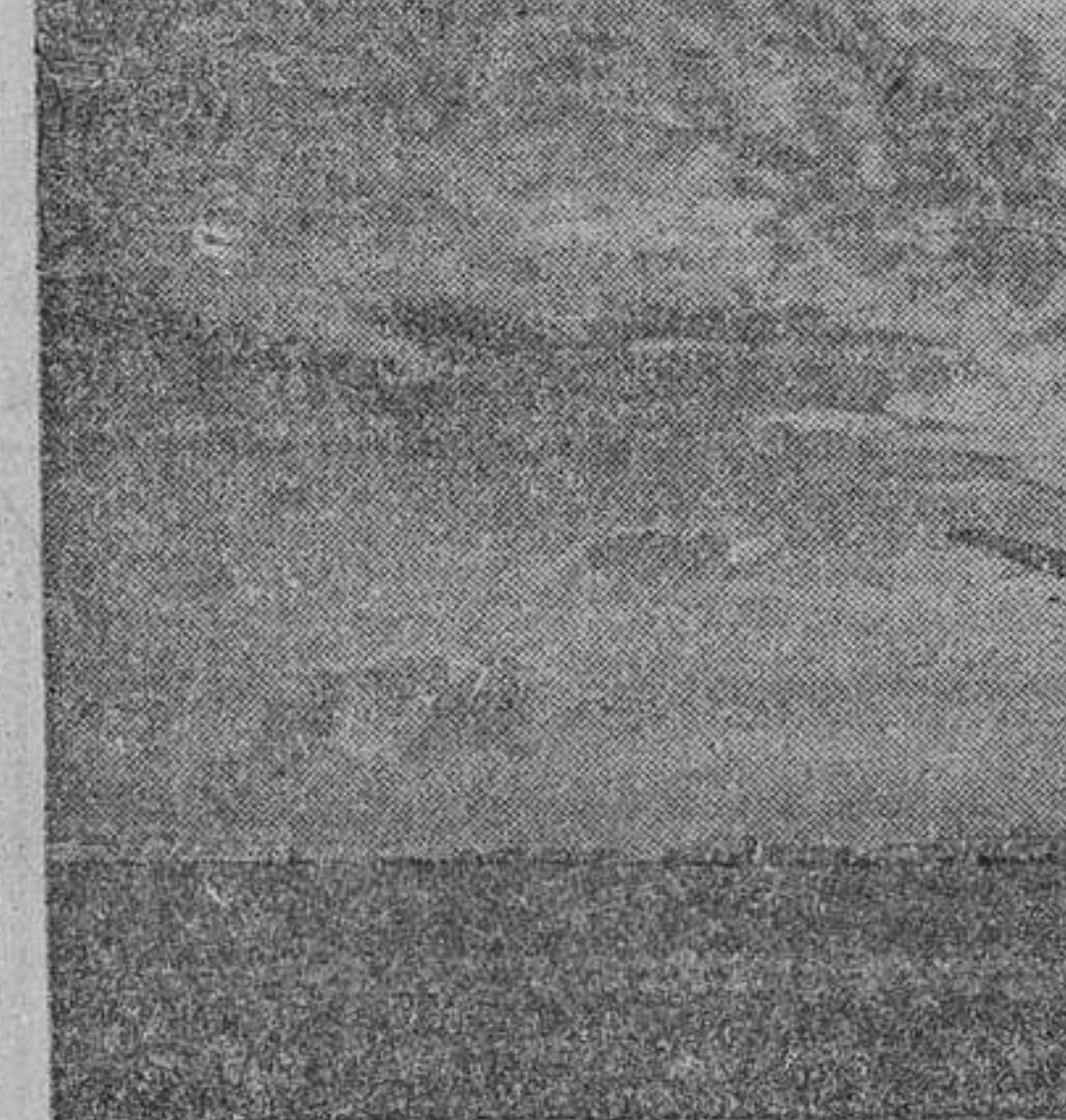
Otro avión de pasajeros, el trimotor "Junkers-52", en pleno vuelo.

leares, Sevilla, Tetuán, Ifni, Cabo Jubi y Canarias, a más de un servicio colonial entre Santa Isabel y Bata.