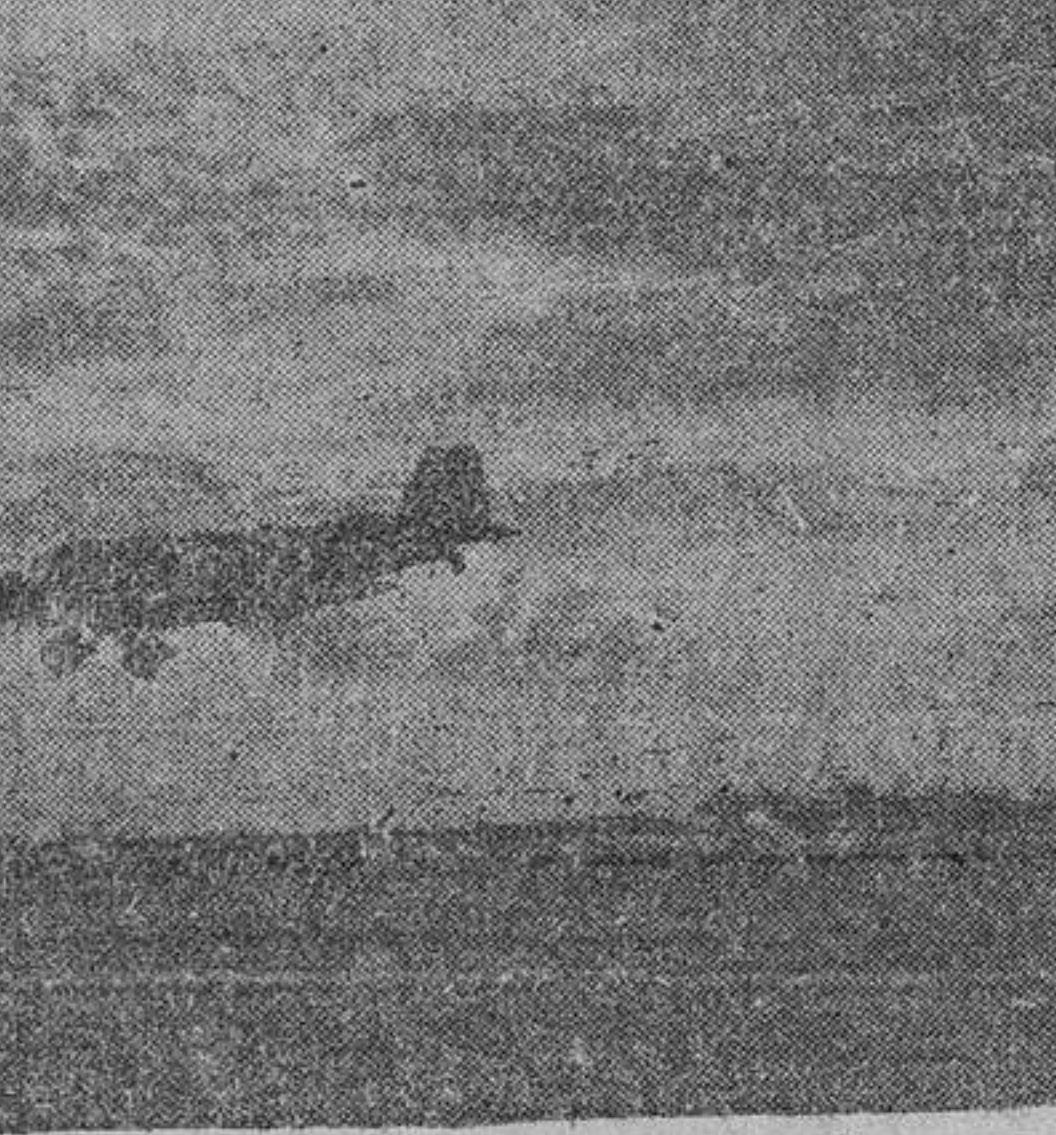
Otro avión de pasajeros, el trimotor "Junkers-52", en pleno vuelo.

leares, Sevilla, Tetuán, Ifni, Cabo Jubi y Canarias, a más de un servicio colonial entre Santa Isabel y Bata.