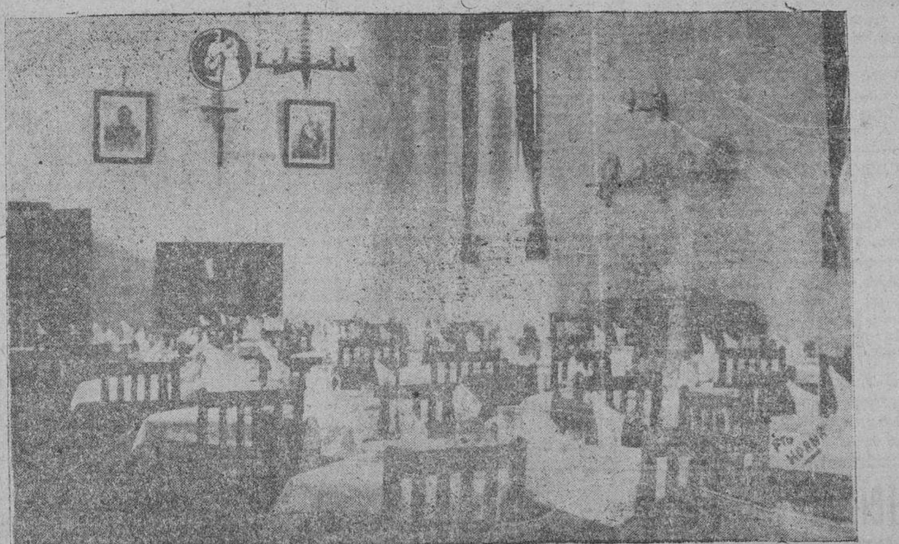
El Comedor Universitario que el S. E. U. ha instalado en la calle de Palominos, y que hoy será inaugurado solemnemente.

(Palabras de Franco en la Residencia de Oficiales, de Barcelona).