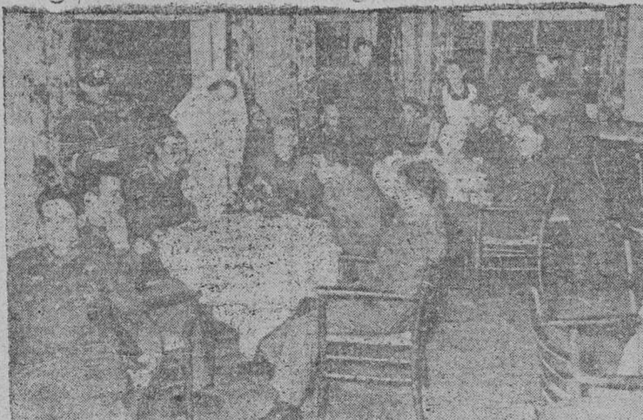
Aquellos de nuestros voluntarios, que en las tierras heladas de Rusia sufrieron heridas combatiendo contra el comunismo, tienen un hogar donde son atendidos con el mayor esmero y cariño. Las fotografías que reproducimos, nos muestran a los convalecientes, en escenas de gran camaradería, mientras esperan el alta para retornar a los frentes, donde están dando tantos ejemplos de heroísmo.