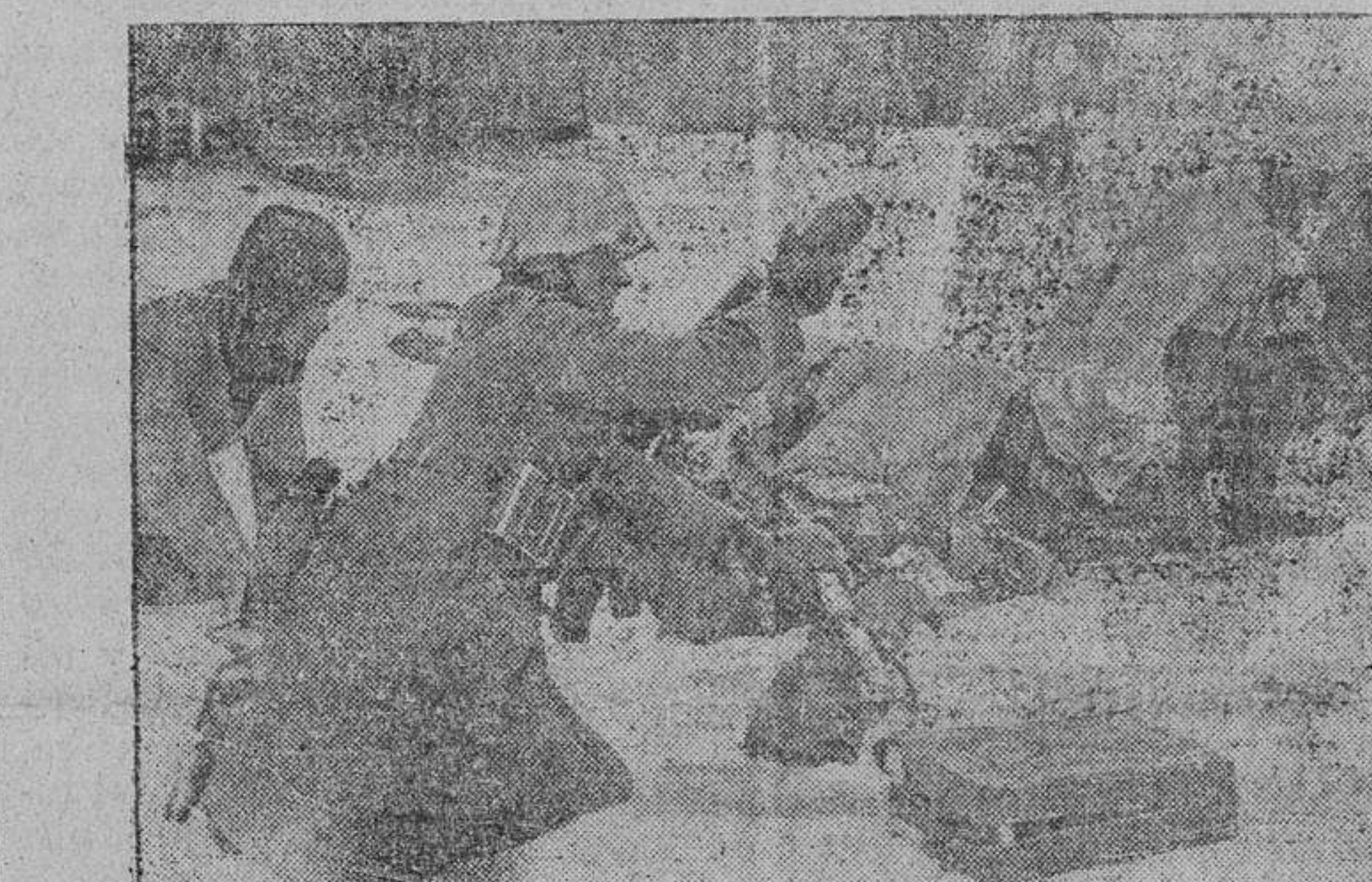
Soldados alemanes preparando las bombas de mano para un ataque a posiciones rojas.