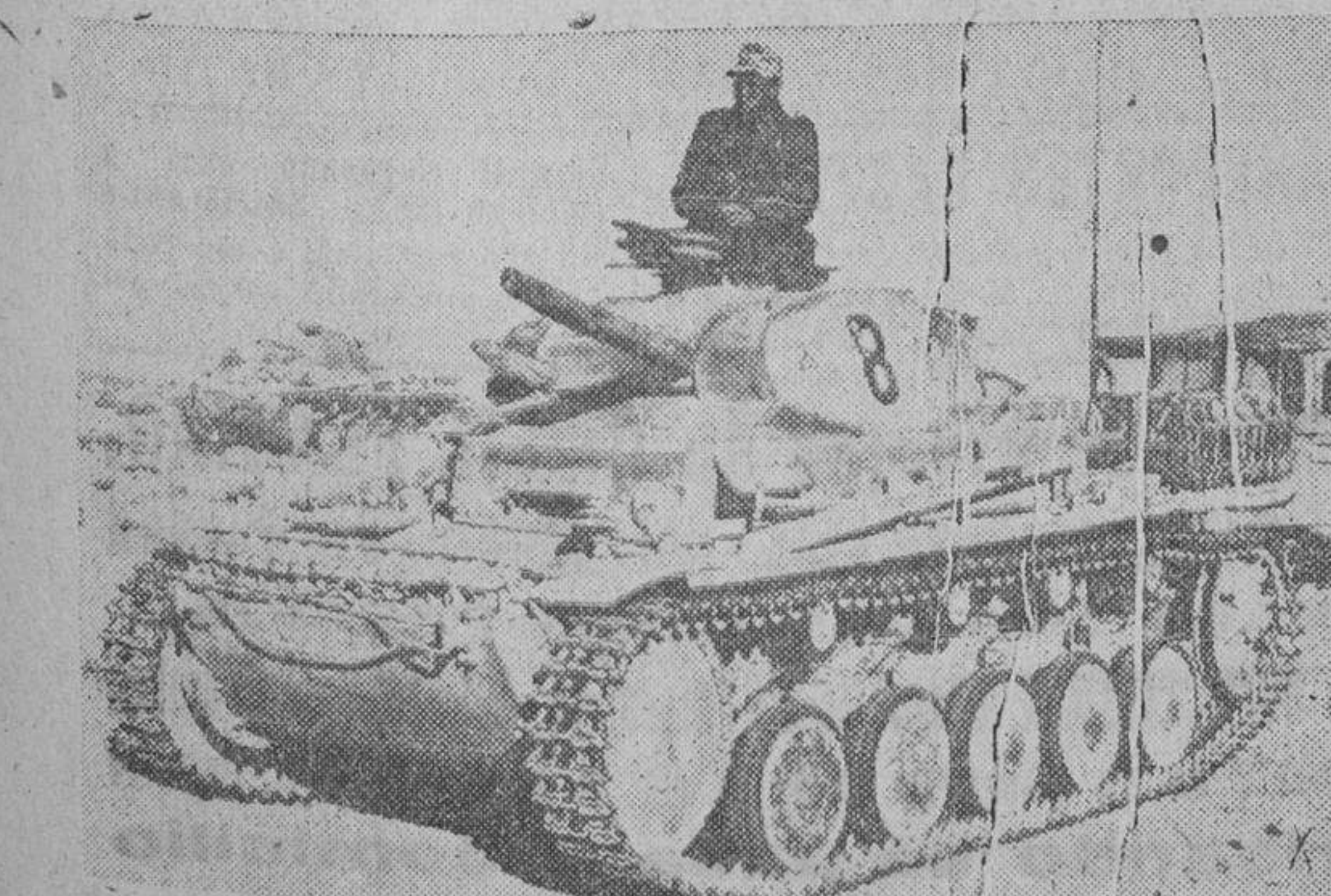
Tanques del cuerpo expedicionario alemán en el frente de Africa. Un breve descanso durante la marcha a través del desierto

París. — En subasta pública ha sido vendido el interior del Castillo de Merval, que fué habitado por la favorita del rey Luis XV, madame Dubarry. El producto de la venta ha alcanzado un total de 1.700.000 francos, de los cuales corresponden 338.000 al lecho de madame Dubarry. (Efe.)