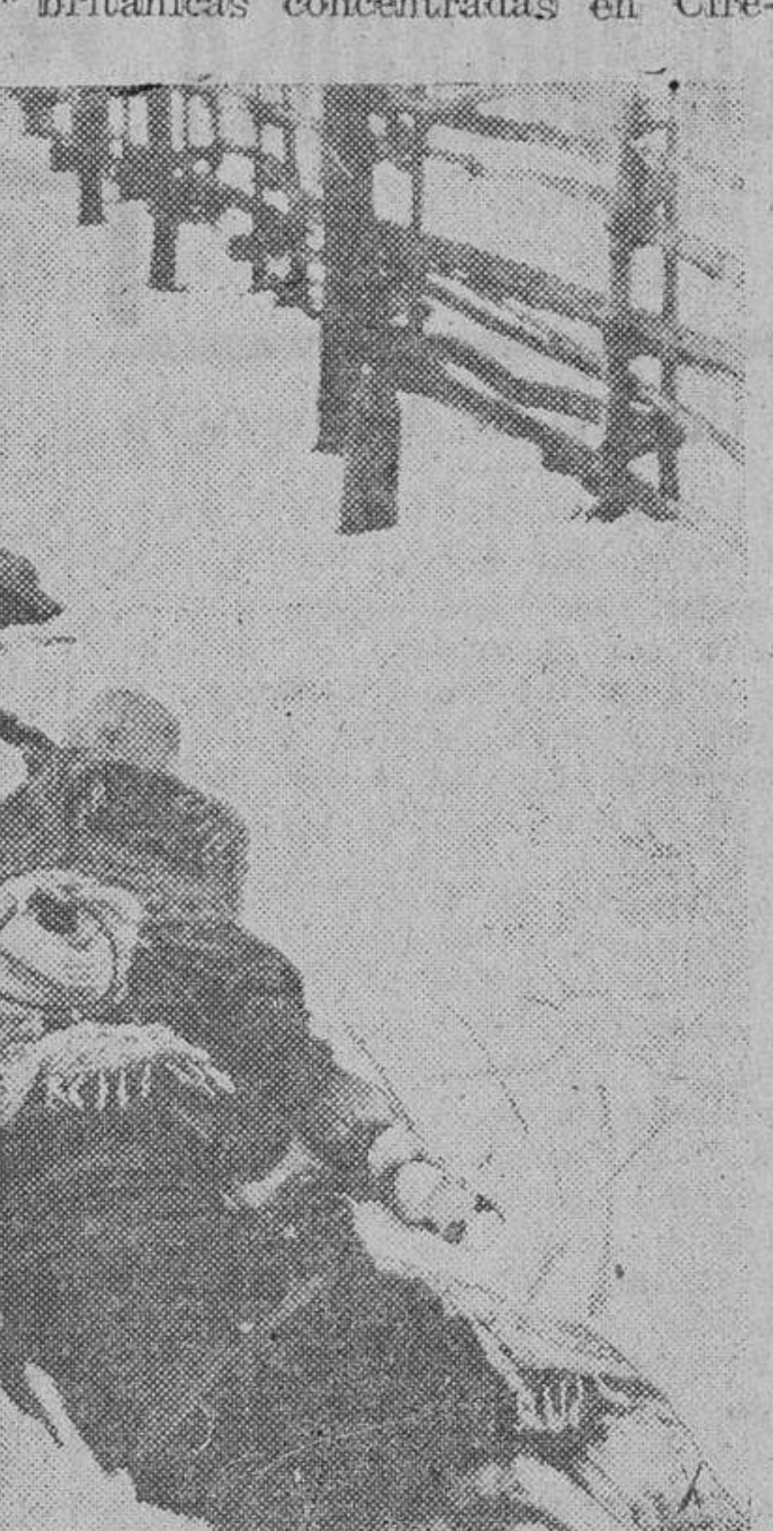
Camuflados con impermeables blancos, que los confunde con la nieve, estos soldados alemanos esperan la orden del mando para dar un golpe de mano al enemigo

En África del Norte, las tropas blindadas germano-italianas han efectuado un audaz ataque por sorpresa contra las fuerzas británicas concentradas en Cire-