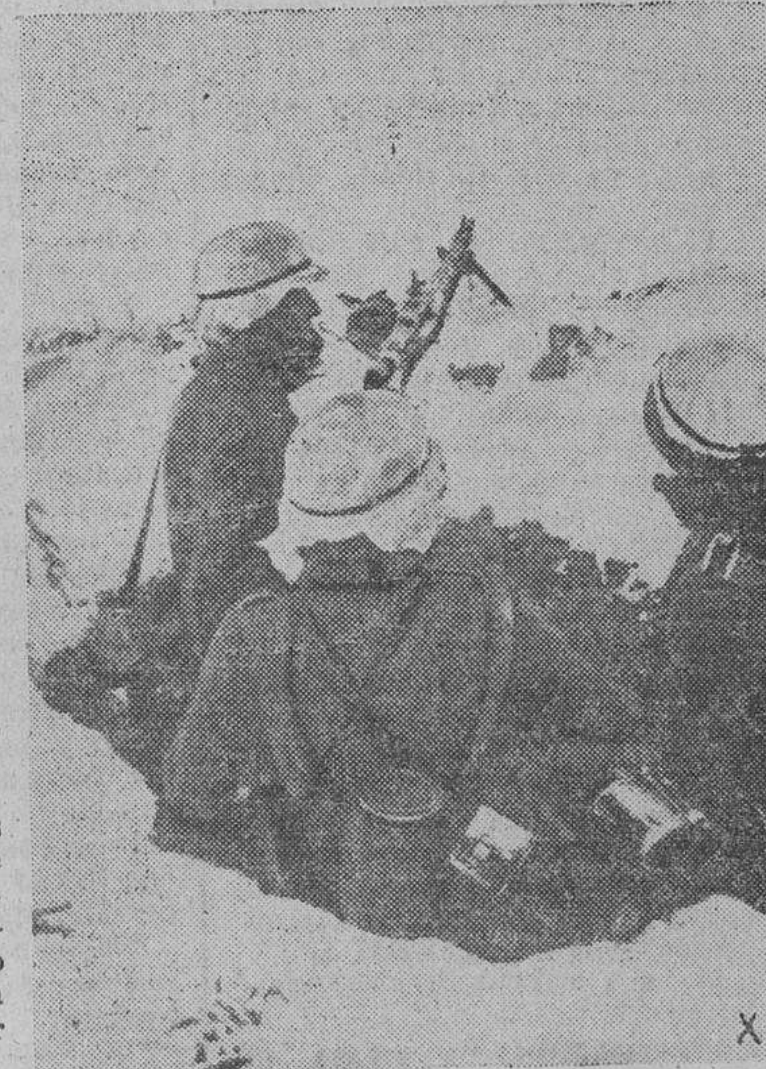
Posición avanzada de la infantería alemana. La lucha con la nieve y el hielo es soportada estroicamente por los bravos infantes del Reich.

Durante la noche del 15 al 16, nuestros aviones atacaron las instalaciones portuarias de la costa oriental inglesa. Varios altos hornos fueron alcanzados de lleno por las bombas.