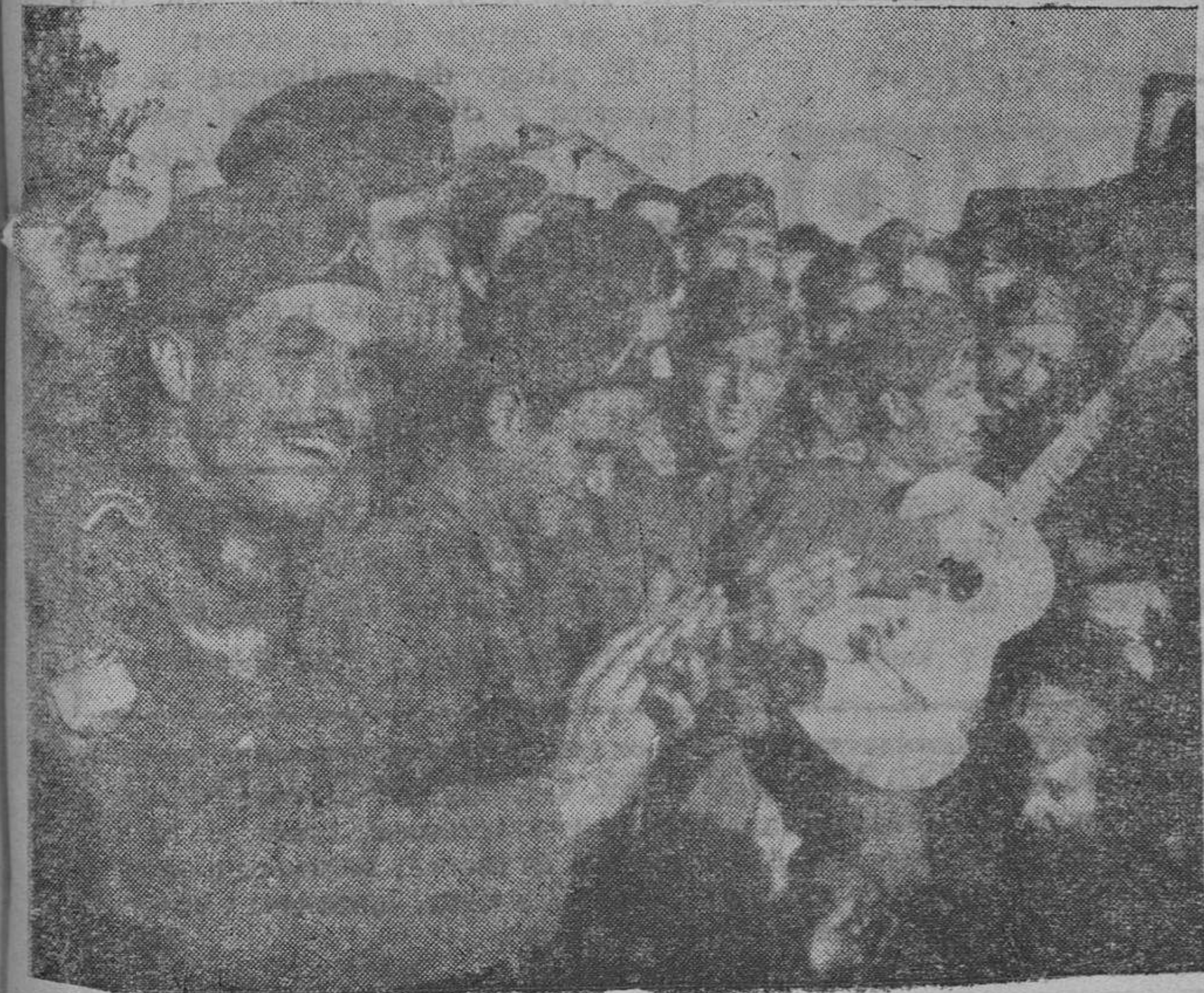
Un alto en la lucha. Los voluntarios españoles recuerdan a su Patria, cantando típicas canciones entre el rasgueo de la guitarra.

Los voluntarios españoles montan la guardia y esperan que se les dé la orden de lanzarse de nuevo al ataque.