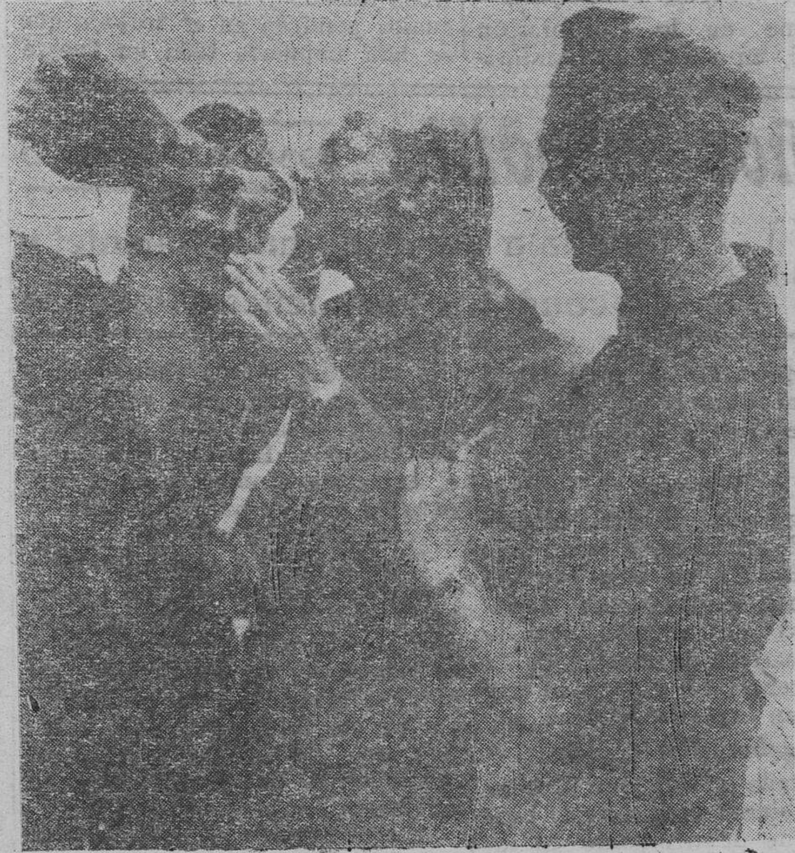
La "bota", un buen trago para "refrescar" la garganta.