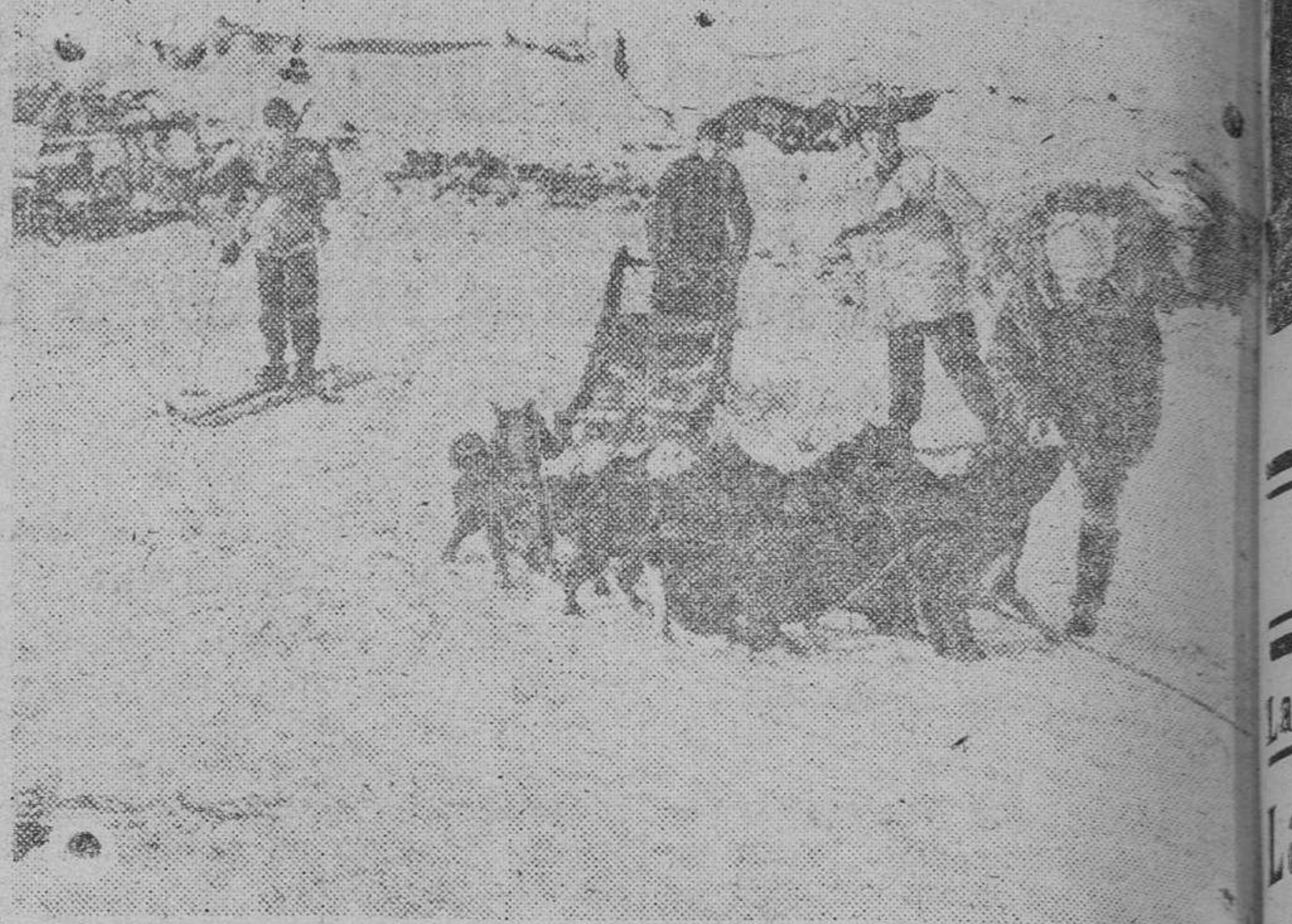
En el frente Extremo-norte el transporte se hace con trineos arrastrados por perros. He aquí uno de las tropas alemanas que se dirigen a primera línea