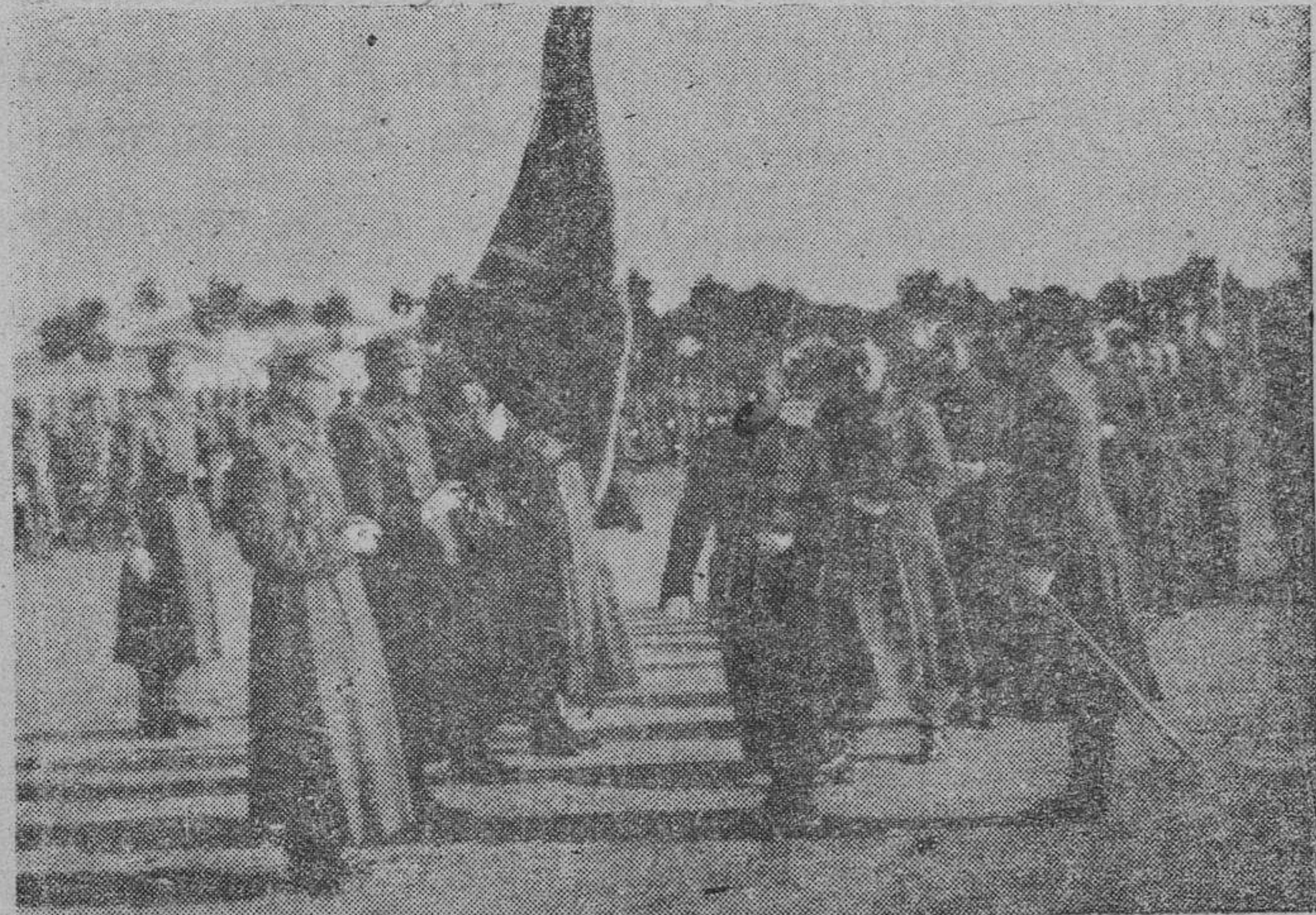
Los reclutas desfilan ante la Enseña de la Patria, después de haber prestado el juramento