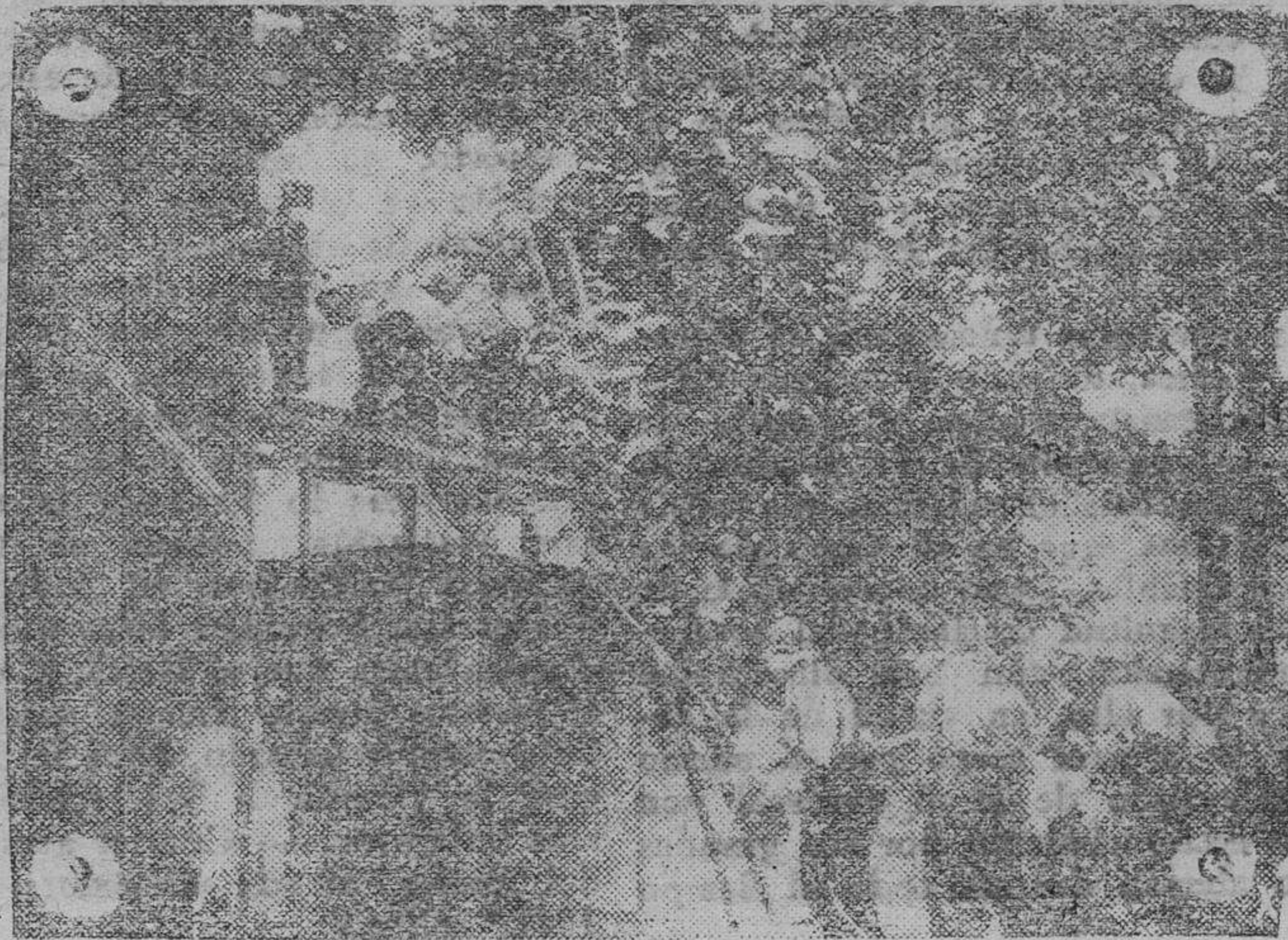
Japón está preparada a la perfección en el aspecto militar, lo mismo para la defensa que para el ataque. La foto muestra unos recientes ejercicios de defensa antiaérea en Tokio, en el que toman parte mujeres

El portavoz gubernamental ha declarado que después de la pérdida de la isla de Penang, la invasión de Hong-Kong y el avance japonés a lo largo de la costa occidental de Malasia, es muy probable una concentración de fuerzas niponas para atacar el frente a partir del río Kunang. En Londres se anuncia una ligera retirada de las fuerzas británicas en dicho río. También anuncia el mismo portavoz que fuerzas de guerrillas, compuestas especialmente por chinos, elegidos y entrenados, comenzarán a entrar en acción en el sector de Kuching, a lo