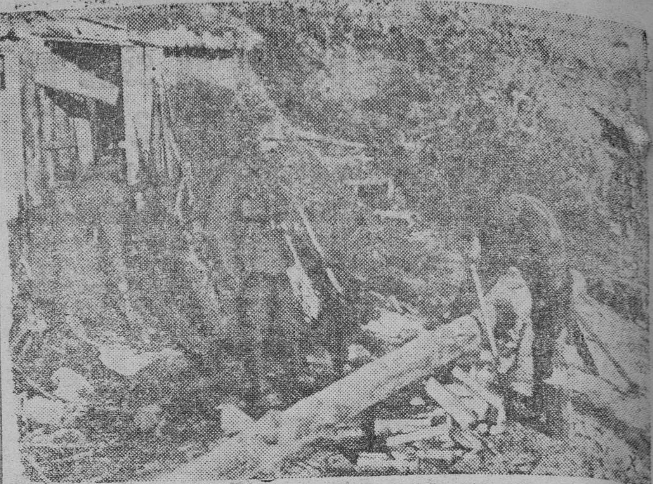
Soldados alemanes de un puesto de mando del frente de San Petersburgo parten leña para el fuego que siempre tiene que haber en esas latitudes

Nos encargamos de la redacción de documentos y tramitación del cobro de la bonificación de DIEZ PESETAS por quintal métrico de trigo entregado por el Agricultor, Rentista o Igualador, al Servicio Nacional del Trigo J. CRIADO, Gestor Admvo. PUBLICIDAD R. E. I. San Pablo, 5