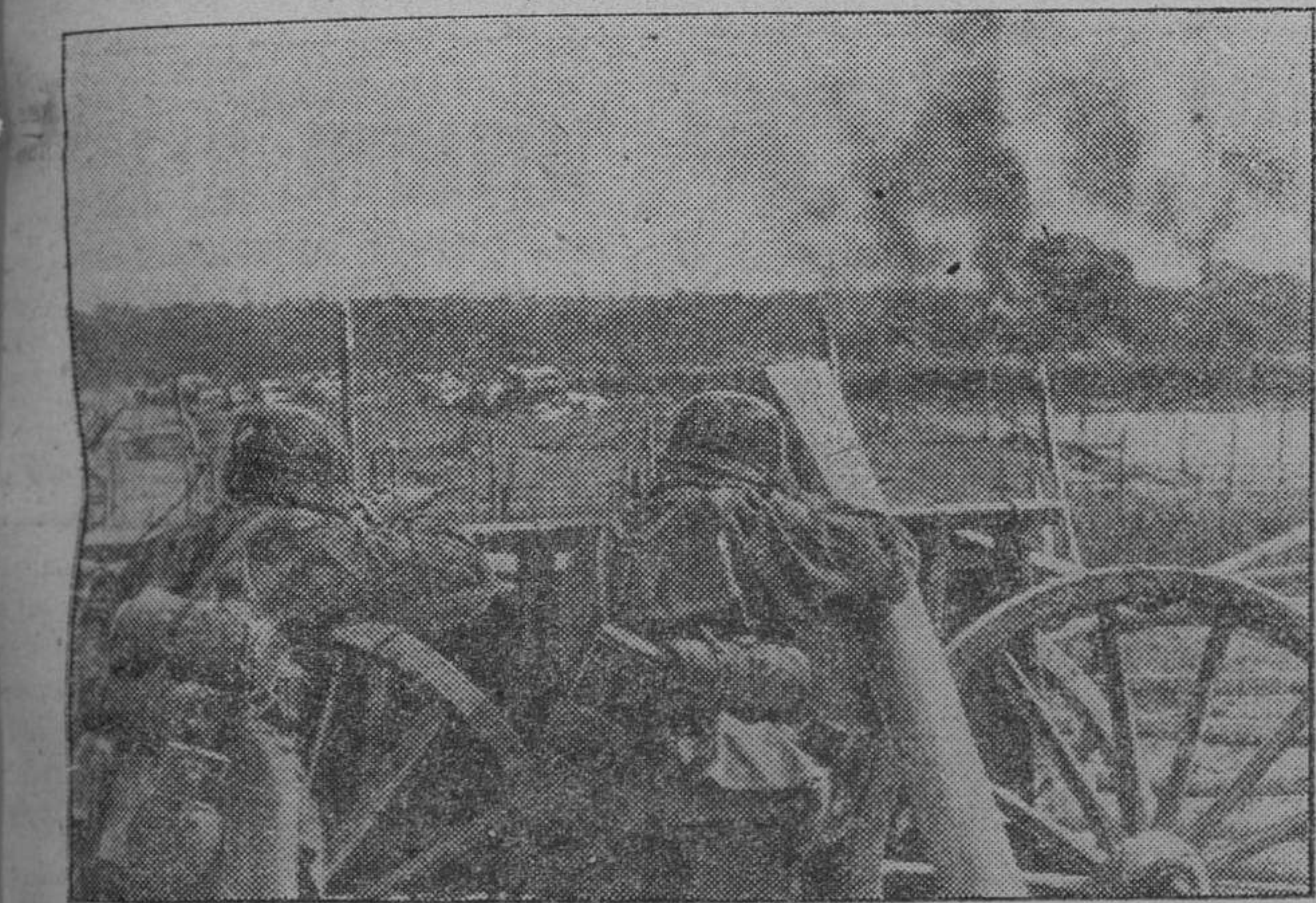
Soldados alemanes de la SS militarizada, batiendo con su fuego las últimas posiciones soviéticas en una aldea.

Berlín.—El general Moscardó visitó esta mañana el cuerpo de deportes Olímpicos, entrevistándose con el jefe de deportes del Reich, Tdchamler Von Osten. El general asistió a la cena dada en su honor por el embajador español, señor conde de Mayalde. Entre los invitados figuraban von Osten y el general von Faupel, presidente del Instituto Ibero Americano. (Efe.)