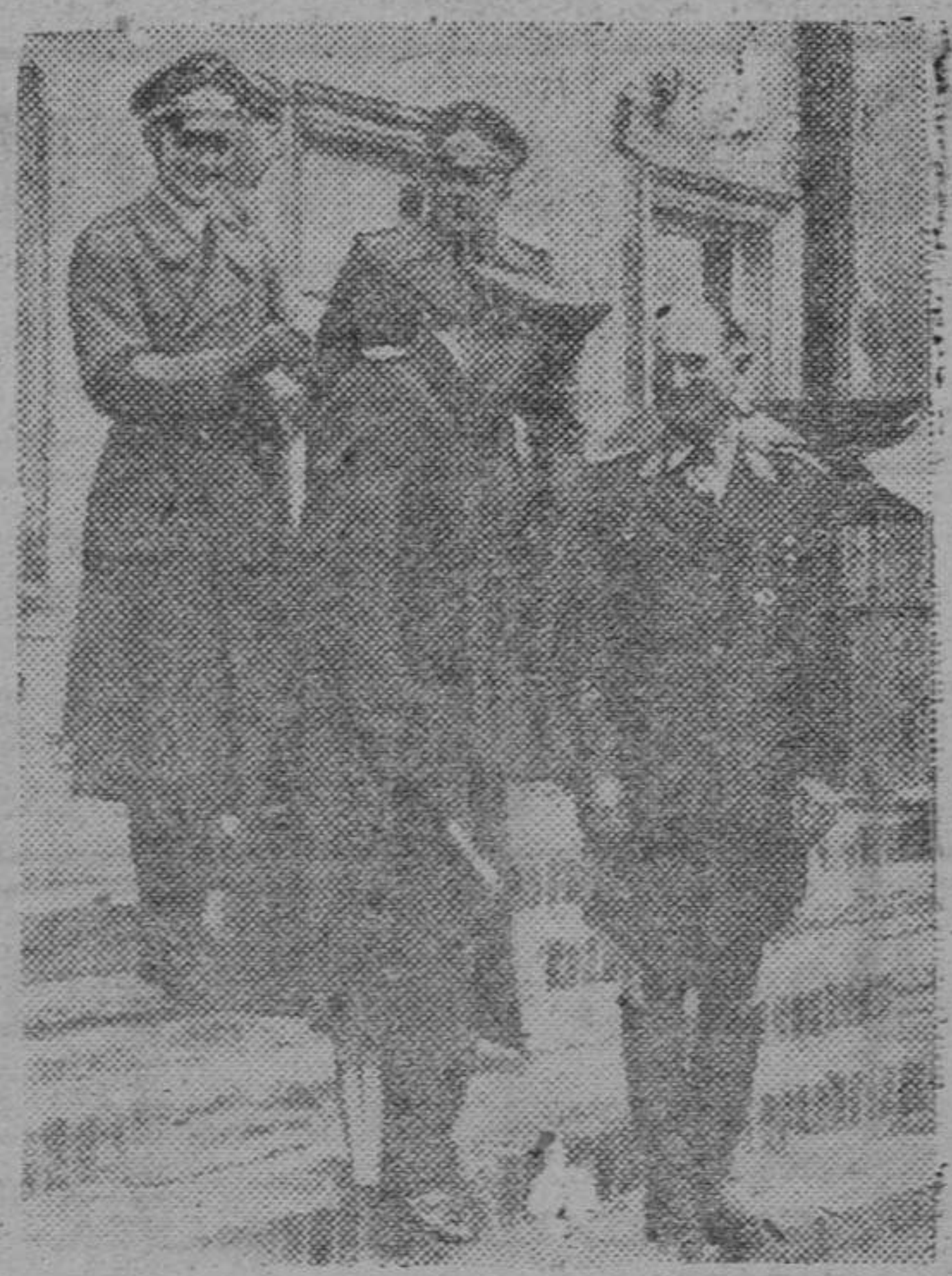
El mariscal Kesselring, que manda un cuerpo aéreo en Rusia, visita al General Loerzer. La foto nos muestra el momento de la despedida después de un cambio de impresiones sobre la marcha de las operaciones.

Gerente, Patrono: El Decreto del 31 de mayo de 1940 te prohíbe emplear personal femenino que no tenga cumplido el "Servicio Social" o la exención de él.