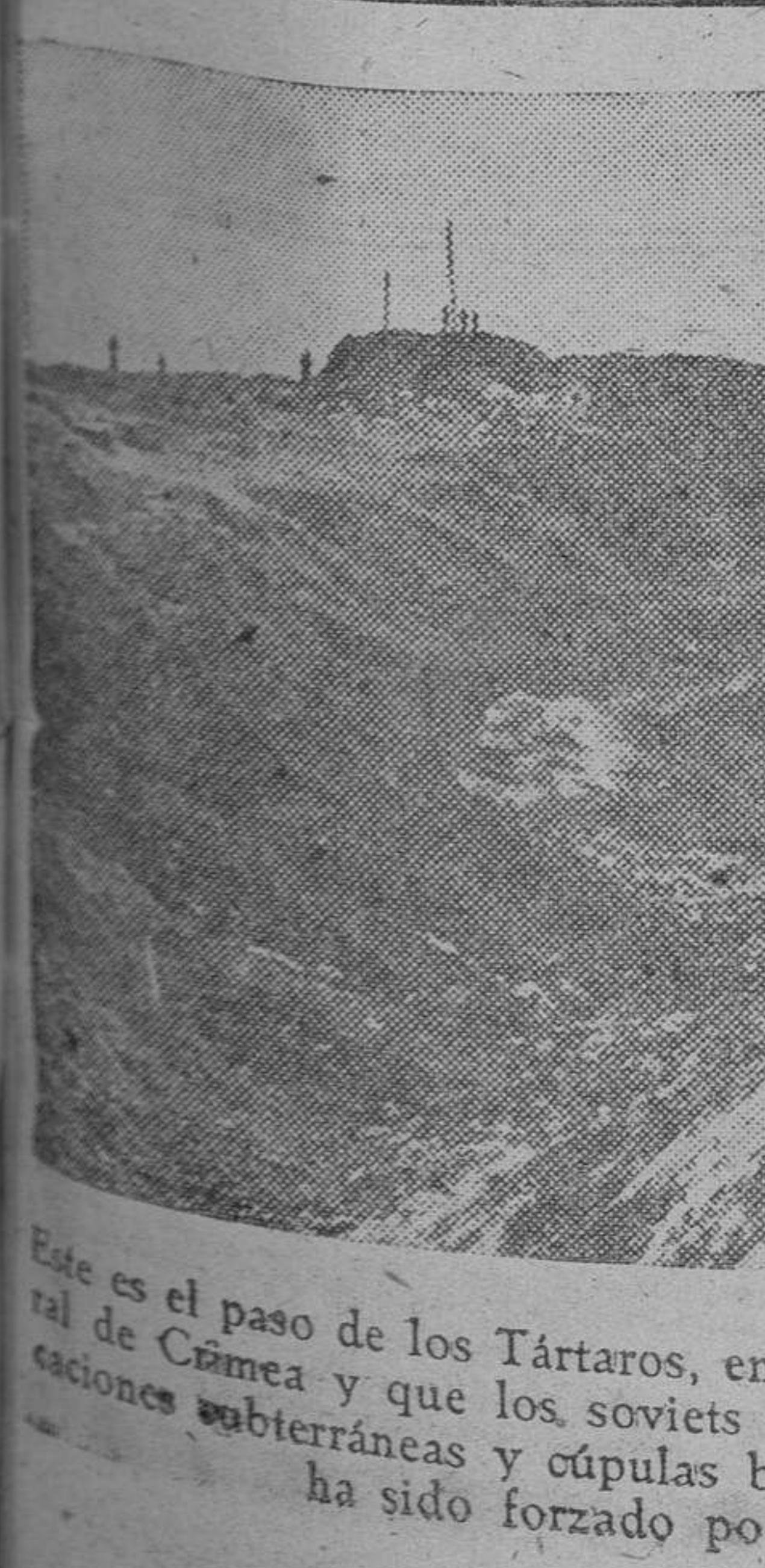
Este es el paso de los Tártaros, en el istmo de Perekow, defensa natural de Crimea y que los soviets habían dotado de poderosas fortificaciones subterráneas y cúpulas blindadas, pero que a pesar de todo ha sido forzado por las tropas del Reich.

Tokio.—En la resolución presentada al Gobierno por el Parlamento japonés, se declara que la actitud hostil de terceras potencias se acentúa de día en día, tanto en los hechos como en las palabras.