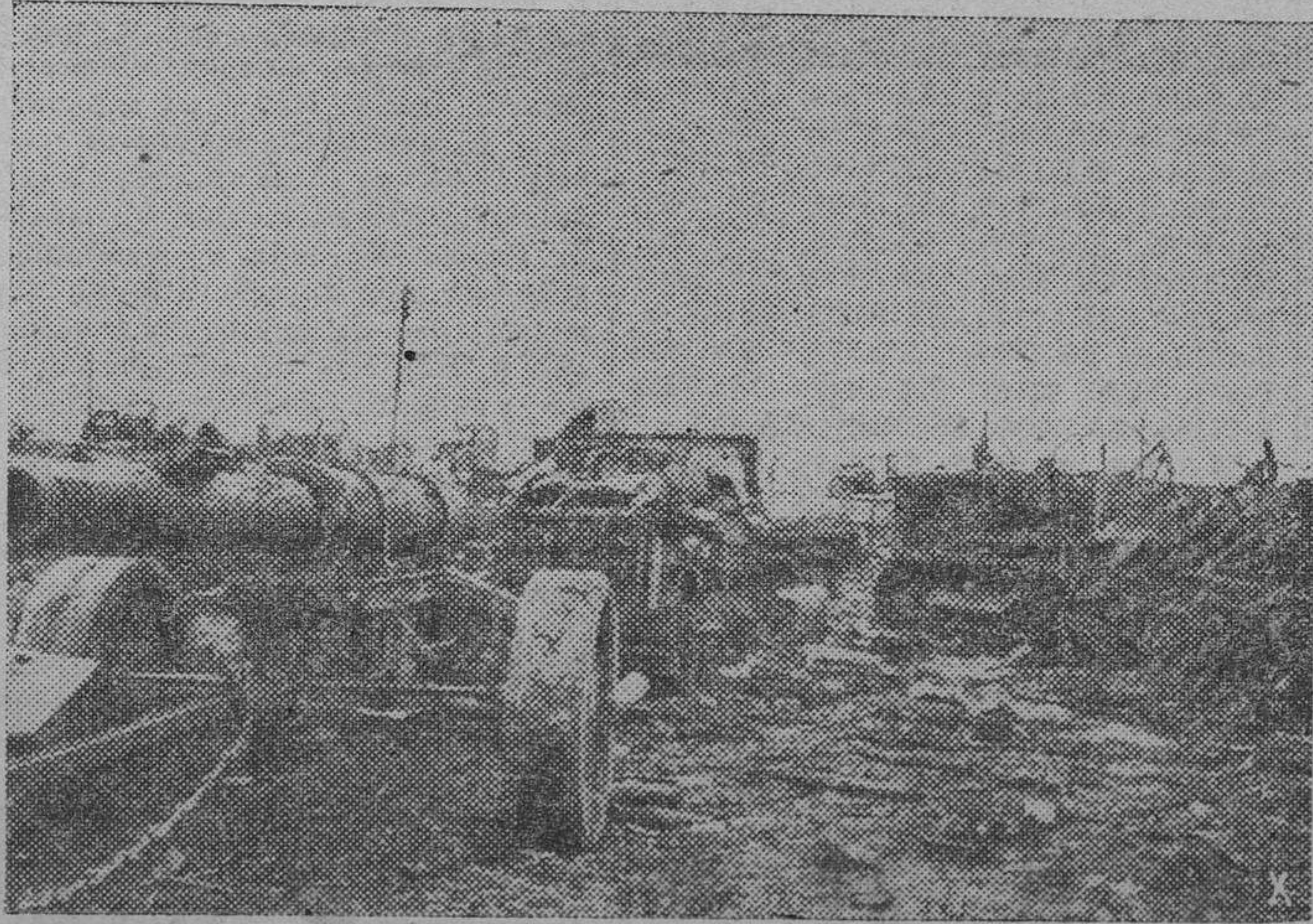
Crimea, otra derrota soviética.—Aquí, como en todas partes de Rusia, se ofrece a los ojos de los soldados alemanes la misma vista: material de todas clases y en gran abundancia, abandonado por los soviets.

Inglaterra, los aviones de bombardeo alemanes han atacado durante la pasada noche varios convoyes enemigos al Este de Lewestoff. Tres barcos mercantes bastante grandes han sido seriamente averiados por las bombas alemanas. Otros aviones alemanes han bombardeado las instalaciones portuarias del SO. de Inglaterra.” (Efe.)