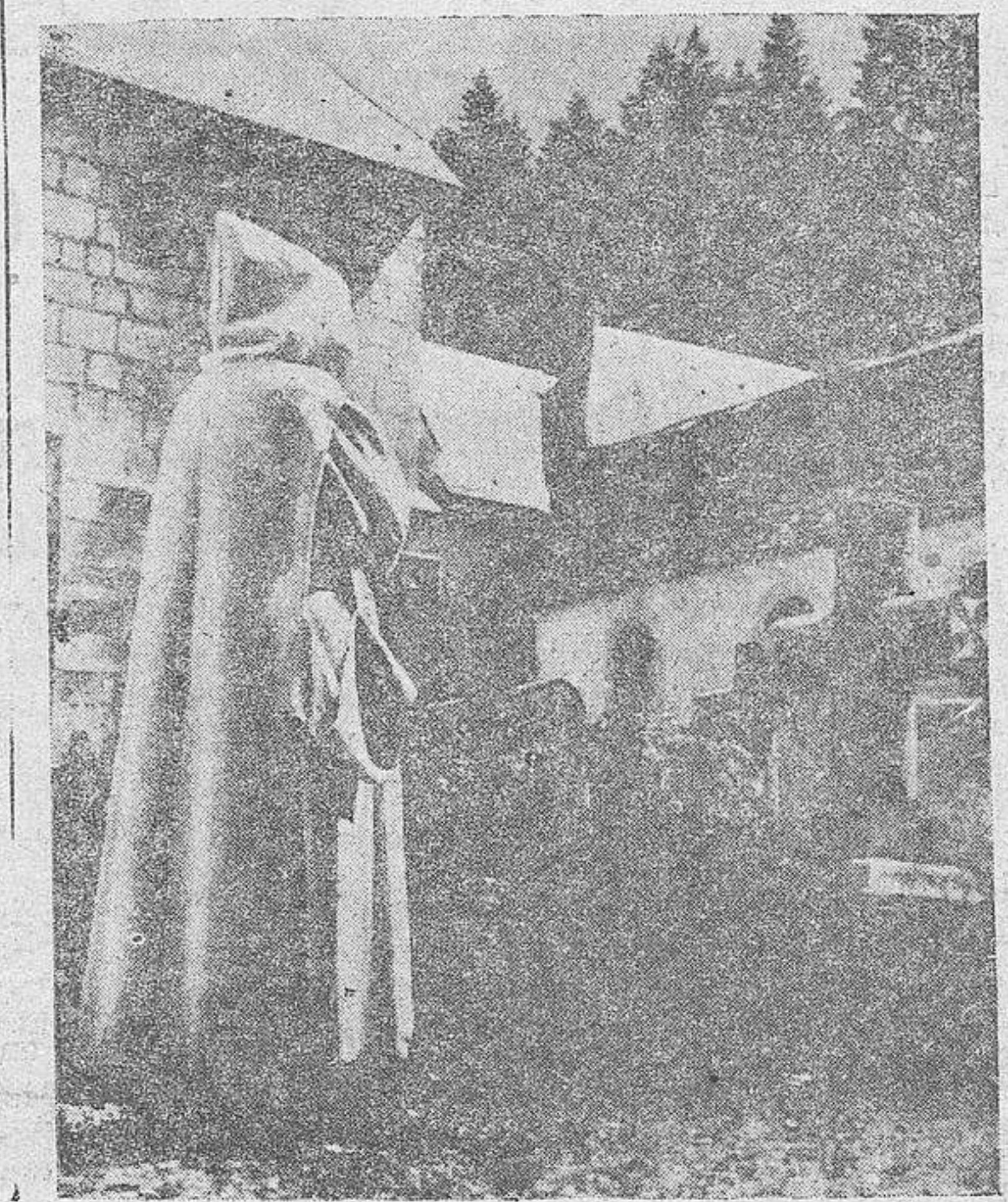
Uno de los patios del Monasterio

Francia, la nueva Francia del viejo mariscal, faustamente derrotada por Alemania—hay derrotas que constituyen las mayores victorias—se incorpora a la Europa grande que se está formando sobre los triunfos ininterrumpidos y el empuje avasallador del pueblo germano. A