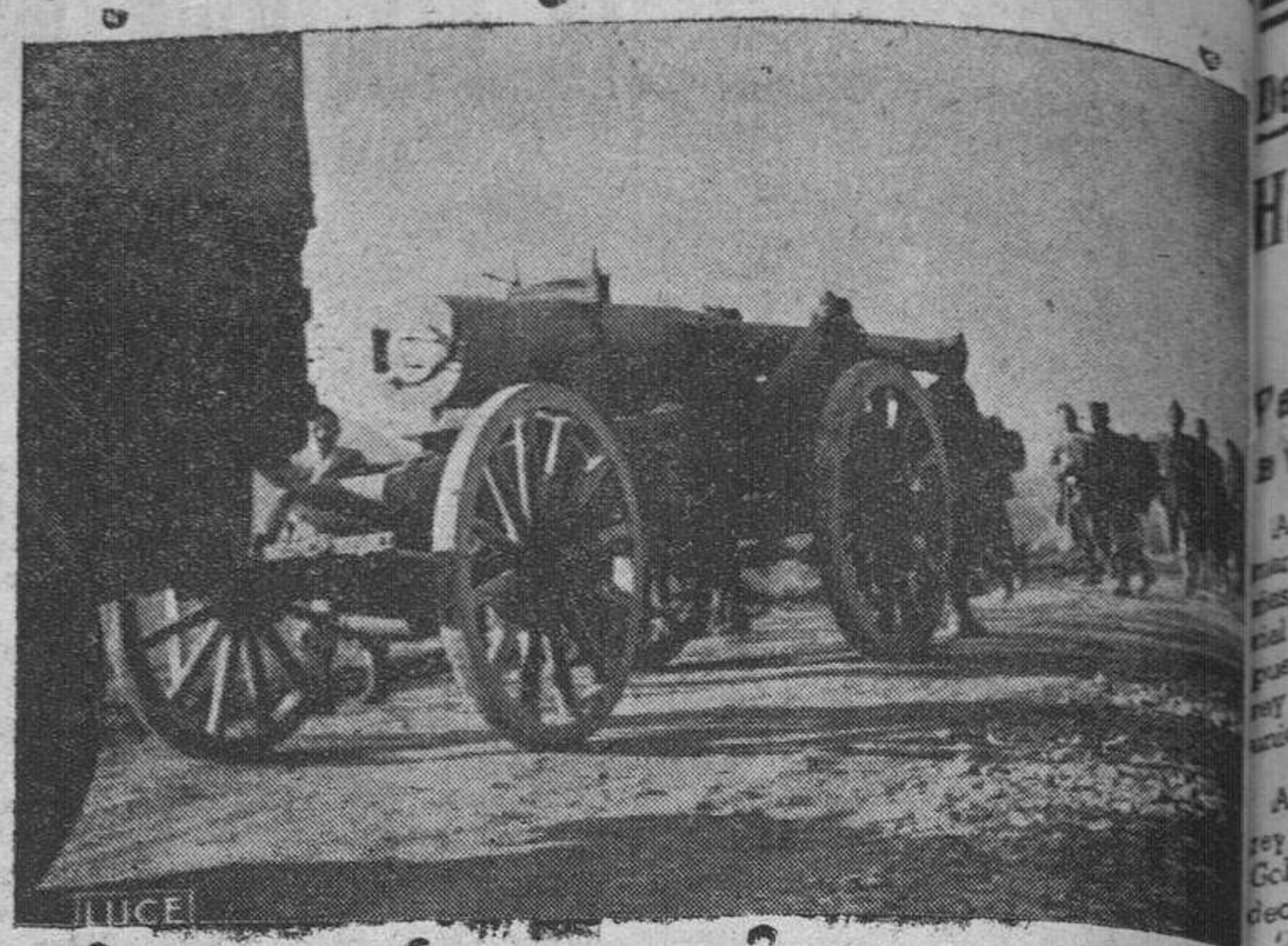
En el avance del frente griego-albanés, la artillería italiana es inmediatamente trasladada para su emplazamiento en las posiciones recientemente conquistadas

Berlín.—Se confirma oficialmente que se encuentra en Berlín actualmente el conde Schulenburg, embajador del Reich en Moscú. Se supone que su estancia es para presentar al Gobierno un informe sobre su actividad en Moscú. (Efe.)