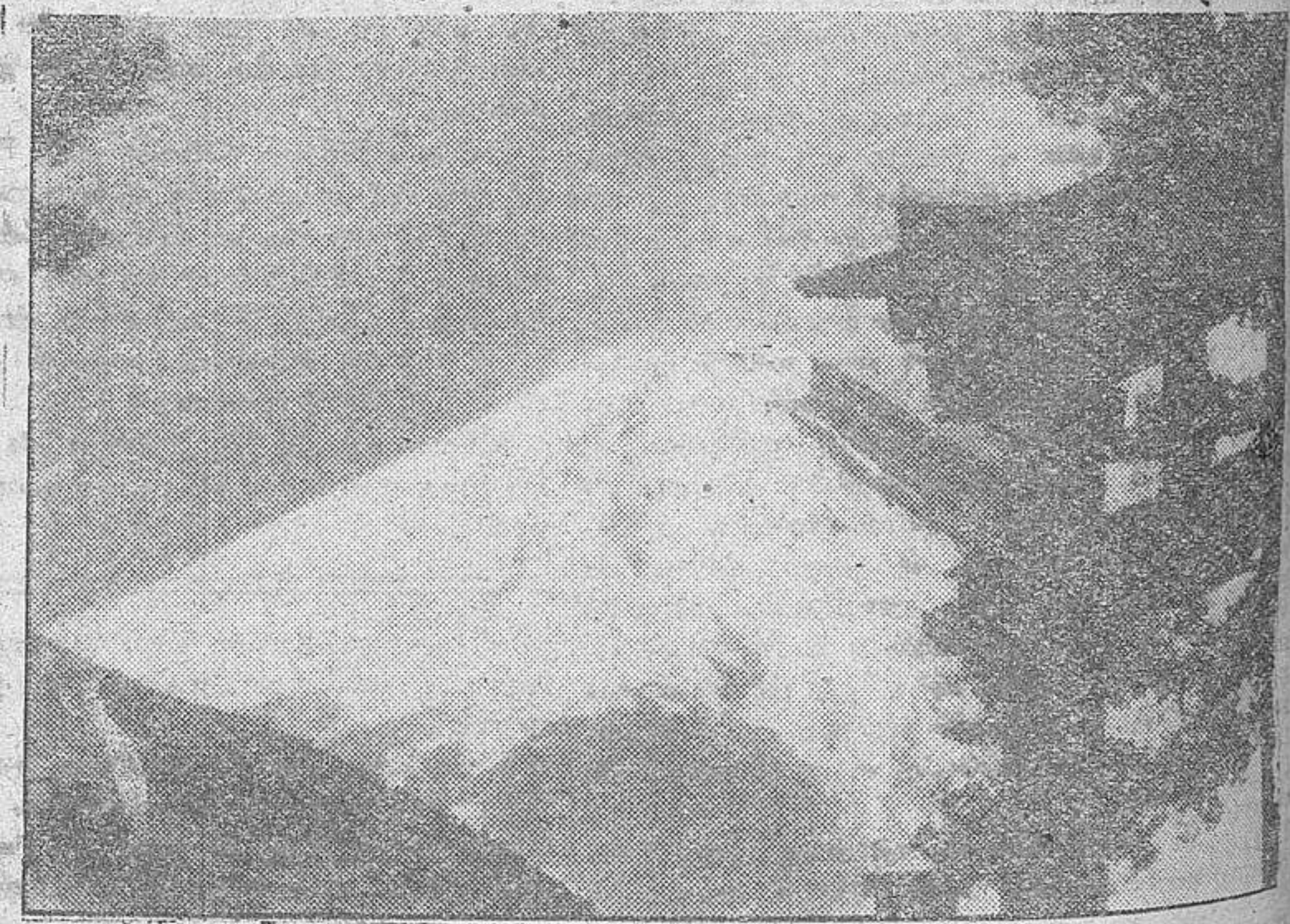
La montaña del «Fuji», el símbolo sagrado de un pueblo que, partiendo de las agrestes rocas de las montañas, está creando una nación, «La nueva Asia». Fotograma de la película de la Tobis del mismo nombre

acompañamos al Dr. Collin Ross en su viaje por Corea y Manchuria en dirección de Pekin. En todas partes