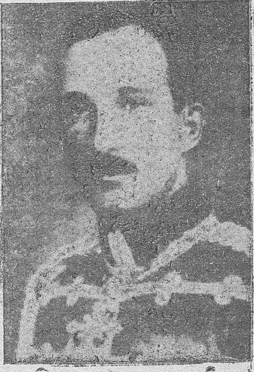
EL REY BORIS DE BULGARIA

Sofía.—Bulgaria ha decidido adherirse al pacto tripartito. El presidente del Consejo, Filoff, ha partido hoy para Alemania con objeto de firmar la adhesión de su país. Antes de salir, Filoff visitó al rey Boris, ante quien hizo una detallada exposición de la situación internacional en los Balcanes. Más tarde, ante el Consejo de Ministros, repitió su exposición y todos los miembros del Gobierno aprobaron sin vacilaciones la decisión de Bulgaria de pasar al lado de las potencias del eje de una manera rotunda.