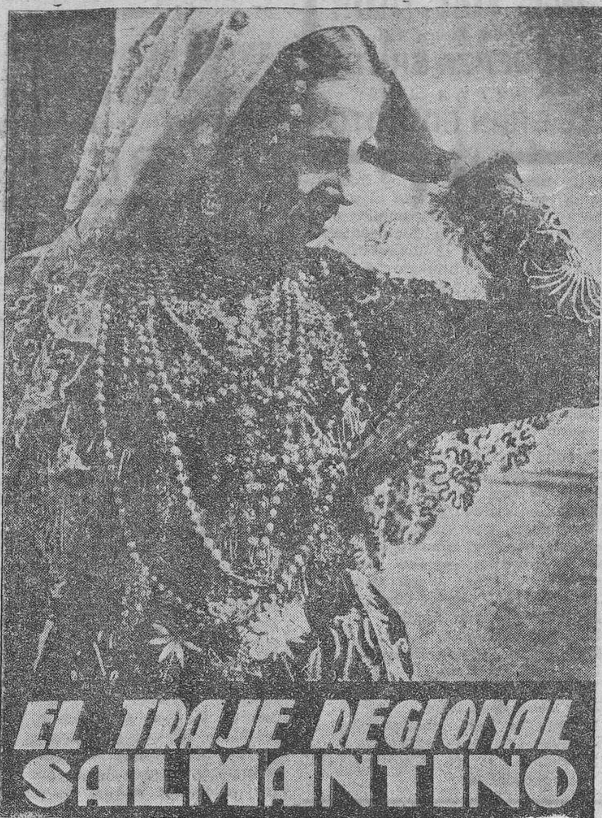
EL TRAJE REGIONAL SALMANTINO

En los viejos arcones de las casas se guarda, entre el perfume del tomillo y del romero, el traje regional auténtico y rico. Sólo en los días de la fiesta mayor salen a relucir esas galas, para trenzar la "rosca", tejer el cordón, y en estampa más plena de maravillosa emoción, hacer el ofertorio ante la virgencita colocada en la plaza pública. Y entonces sí que adquiere ritmo y rito el movimiento de la danza regional, el rebrincar de los hombres y el revuelo