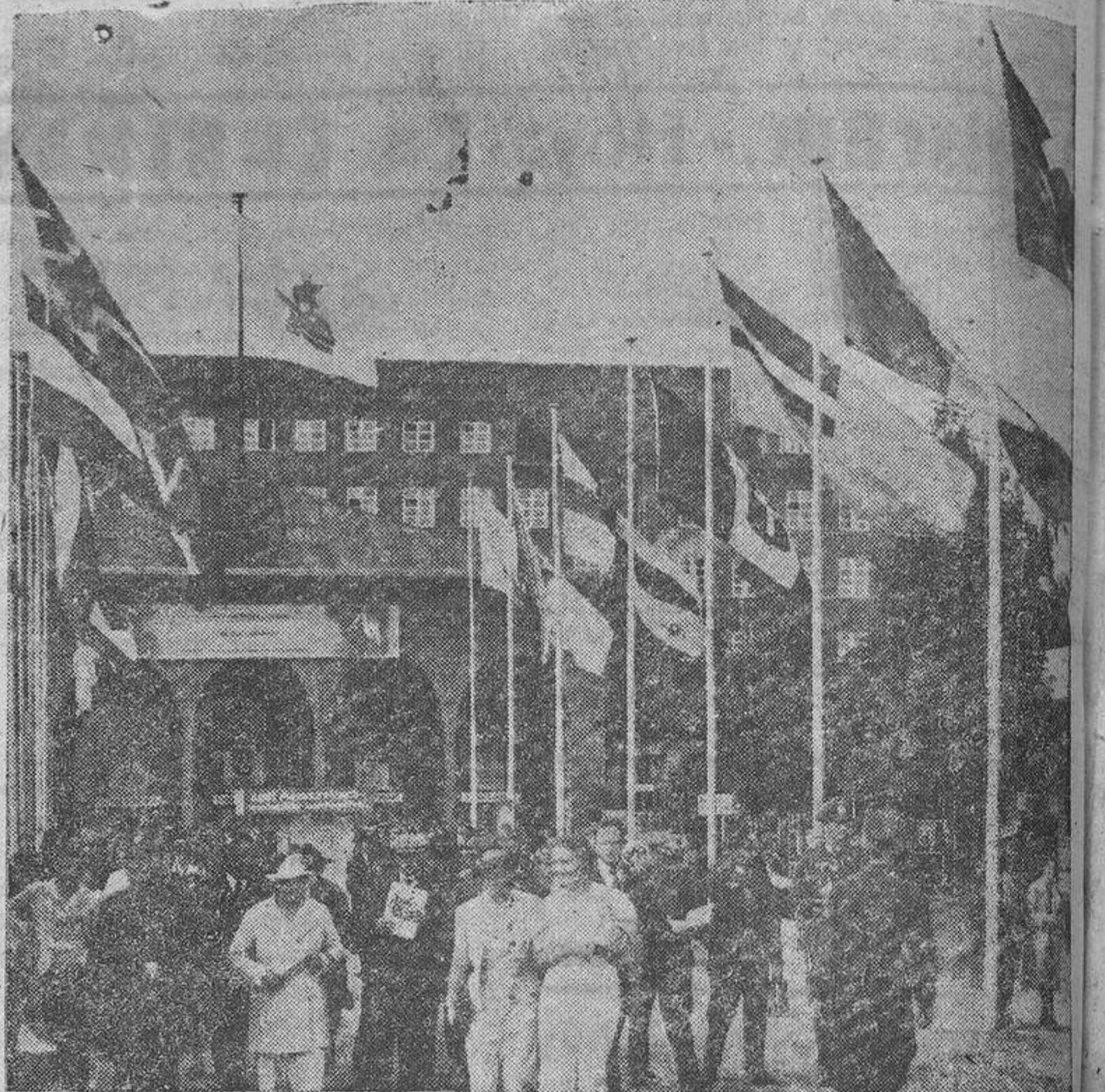
La 28ª Feria otoñal de Königsberg, 1940.—La entrada principal al campo de exposiciones

La feria ocupa todo el gran campo de exposiciones, a la entrada de la ciudad, con sus muchos y grandes pabellones, así como también con numerosas instalaciones al aire libre, destacándose las múltiples exposiciones técnicas y de especialidades, entre las que ocupan un lugar sobresaliente las de aprovechamiento industrial de la energía, construcción de vehículos motorizados, industria