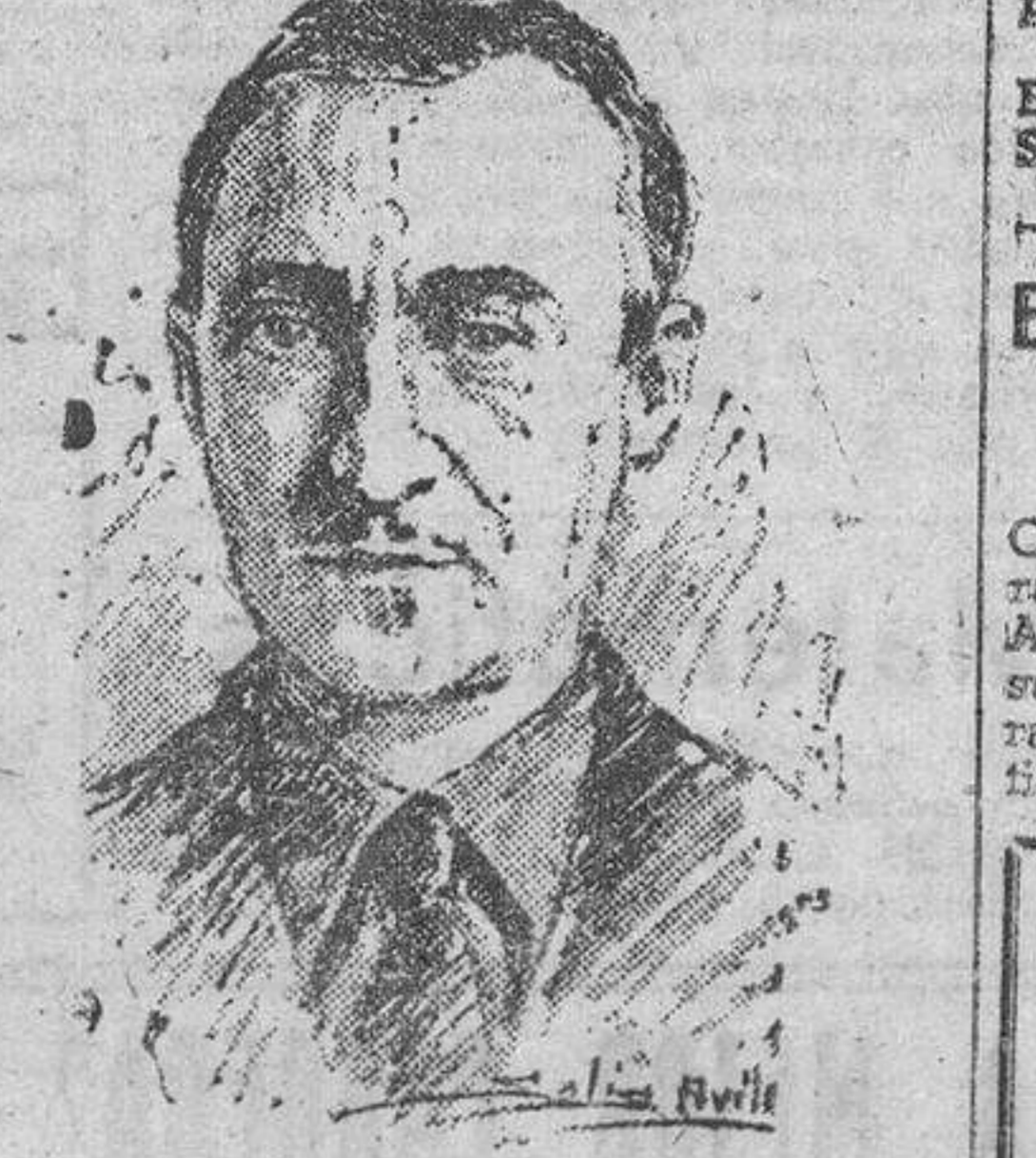
Miguel Primo de Rivera

Madrid.-A su regreso del extranjero, el jefe provincial del Movimiento en Madrid, camarada Miguel Primo de Rivera, interrogado por los periodistas, ha hecho las siguientes declaraciones: -Como español y como falangista, vengo de Alemania e Italia con profunda satisfacción, que tal vez sea innecesario exaltar, ya que el presi-