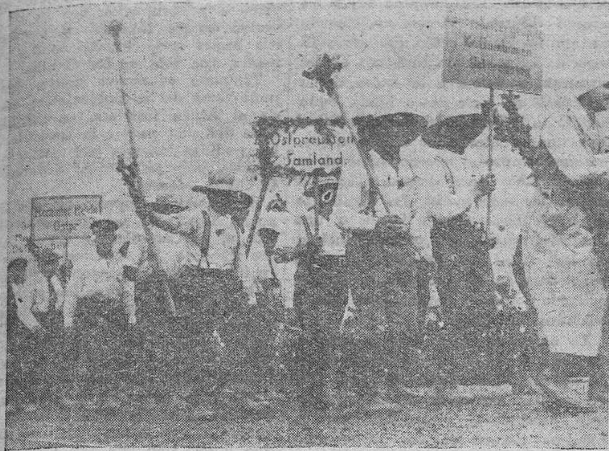
Campeños de la Prusia Oriental, en la fiesta de la cosecha

hempo reuniones muy interesantes para intercambio de impresiones entre los labradores, que se comunican la labor realizada por unos y otros e informándose mutuamente de las experiencias y resultados obtenidos en sus respectivas labranzas. Asimismo