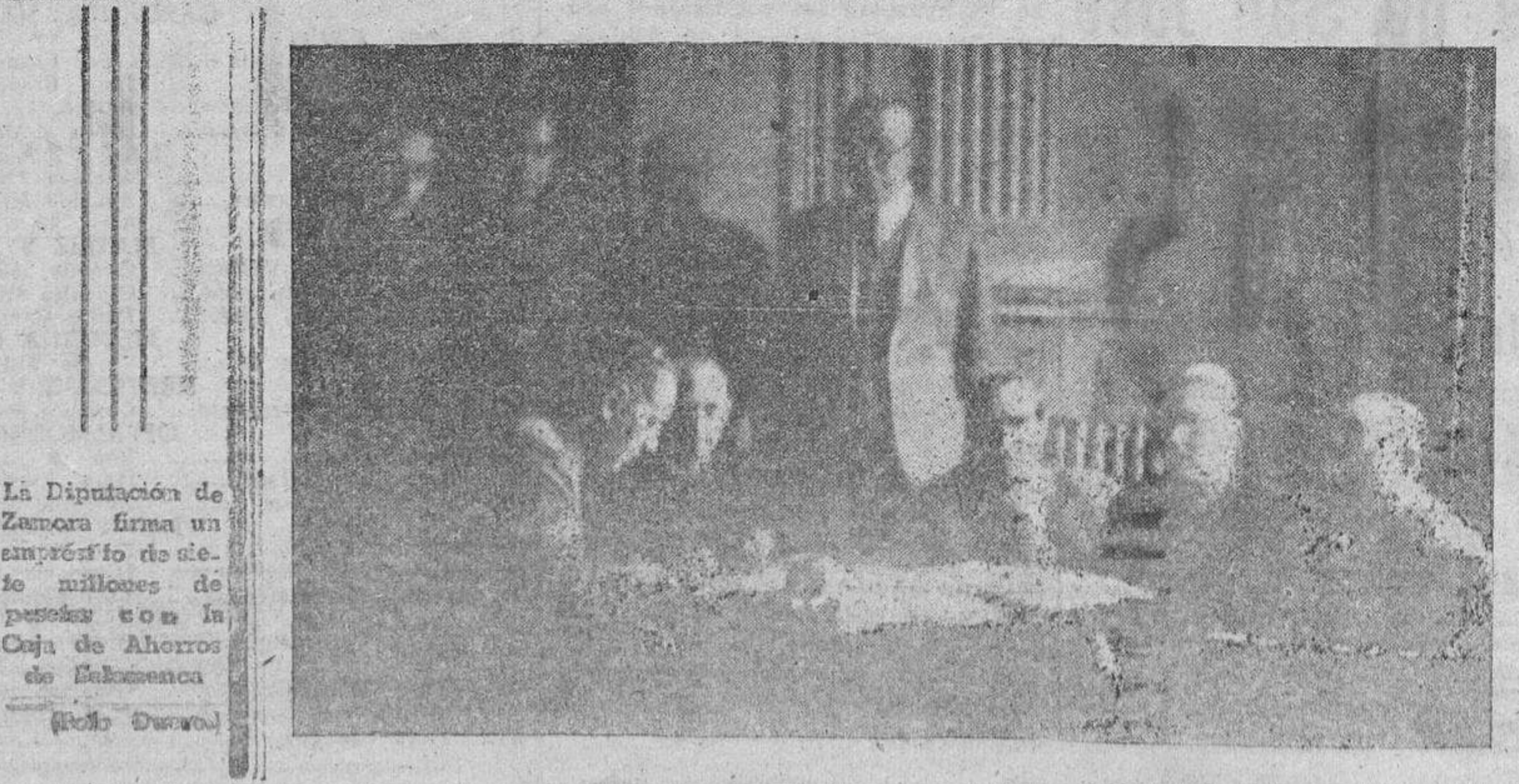
La Diputación de Zamora firma un empréstito de siete millones de pesetas con la Caja de Ahorros de Salamanca