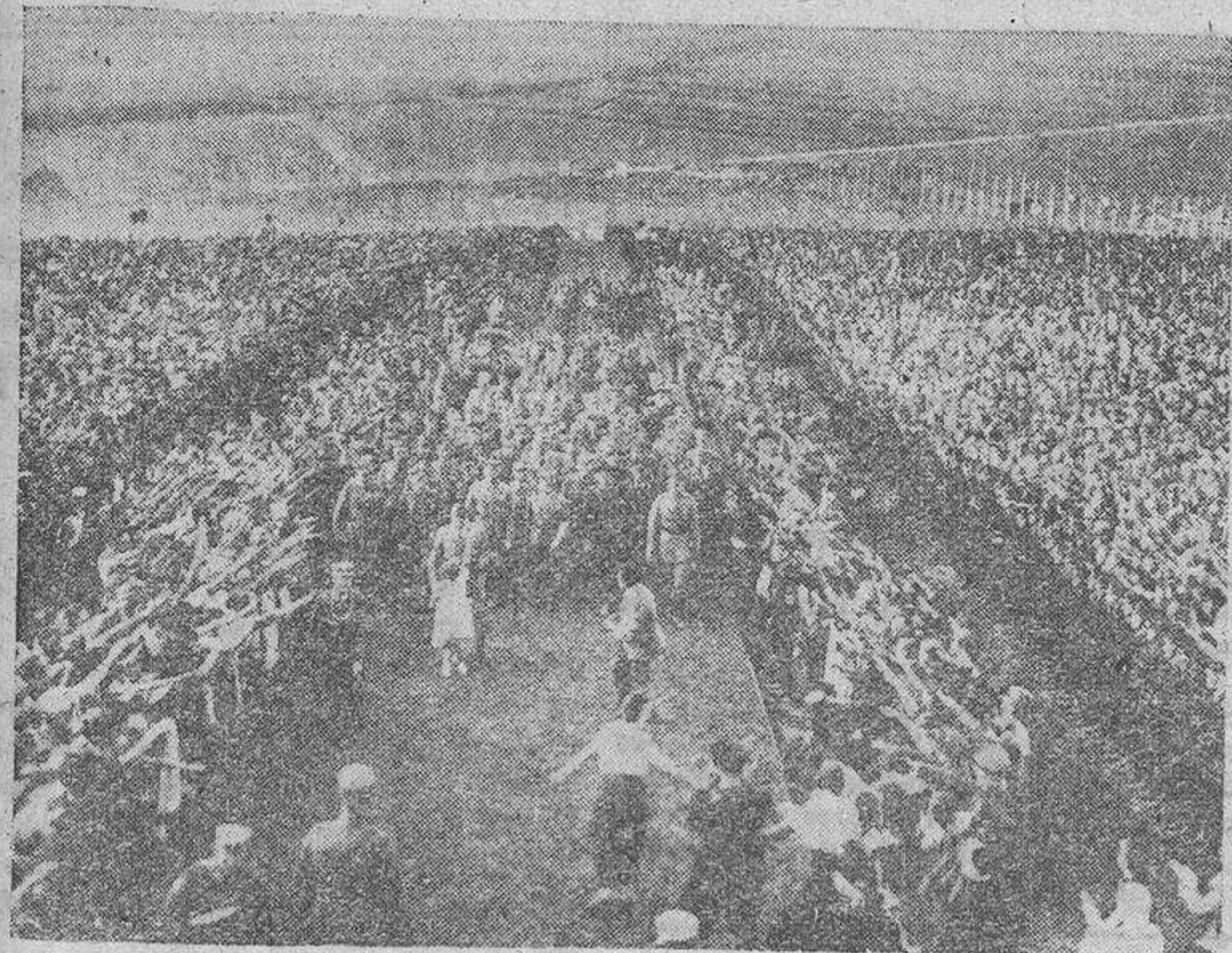
Hitler asiste a la fiesta de la cosecha

Hitler, como todos ellos, en cumplimiento de la tradicional costumbre, sube al monte de Bueckeberg, a la bellísima montaña que domina la hermosa población y la más espléndida campiña, y allí, en lo alto, rodeado de aquellas gentes sencillas y