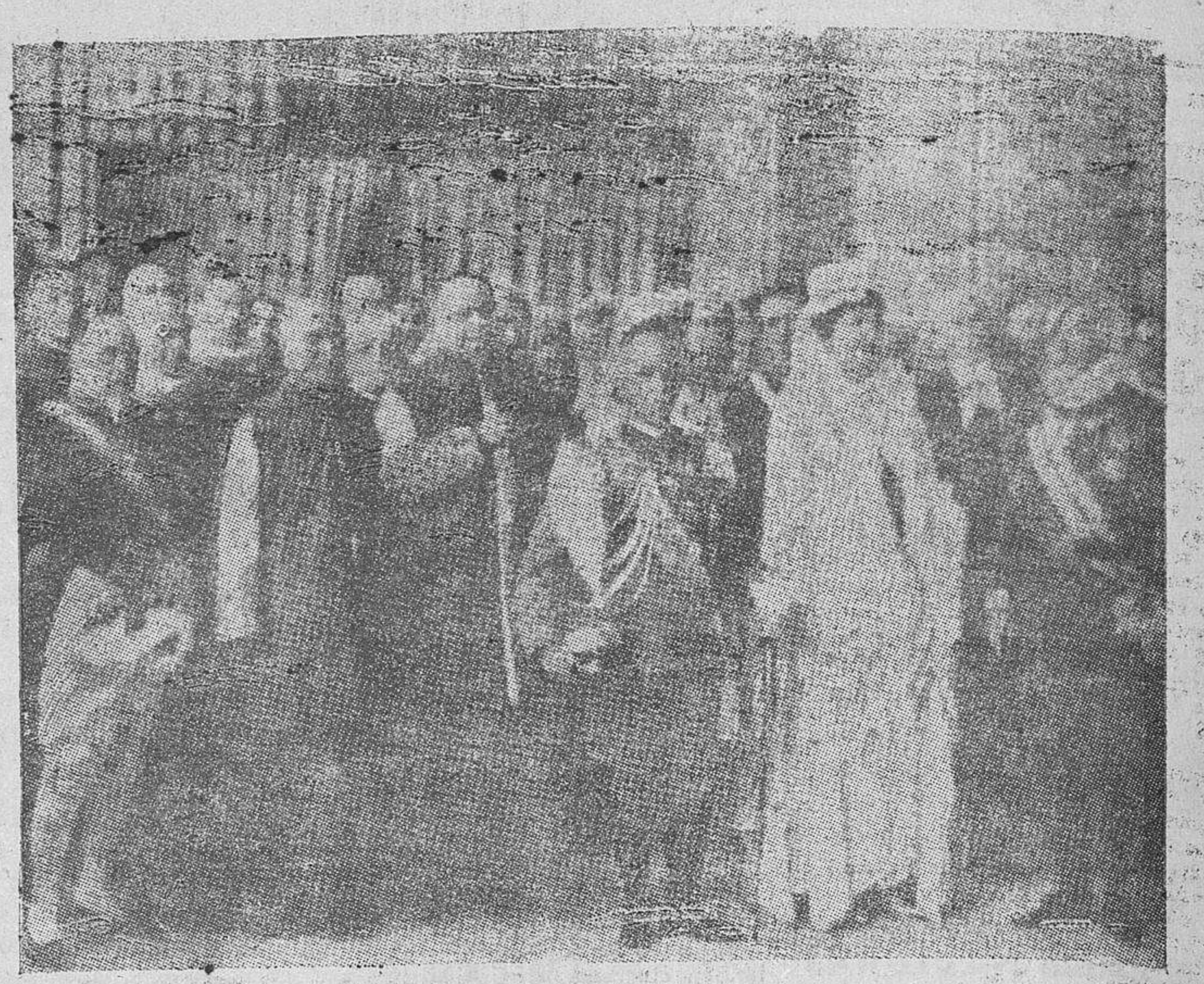
Fotografía de los soberanos italianos en el Vaticano, obtenida el día 5 de Diciembre con ocasión de la primera visita de Sus Majestades al Sumo Pontífice