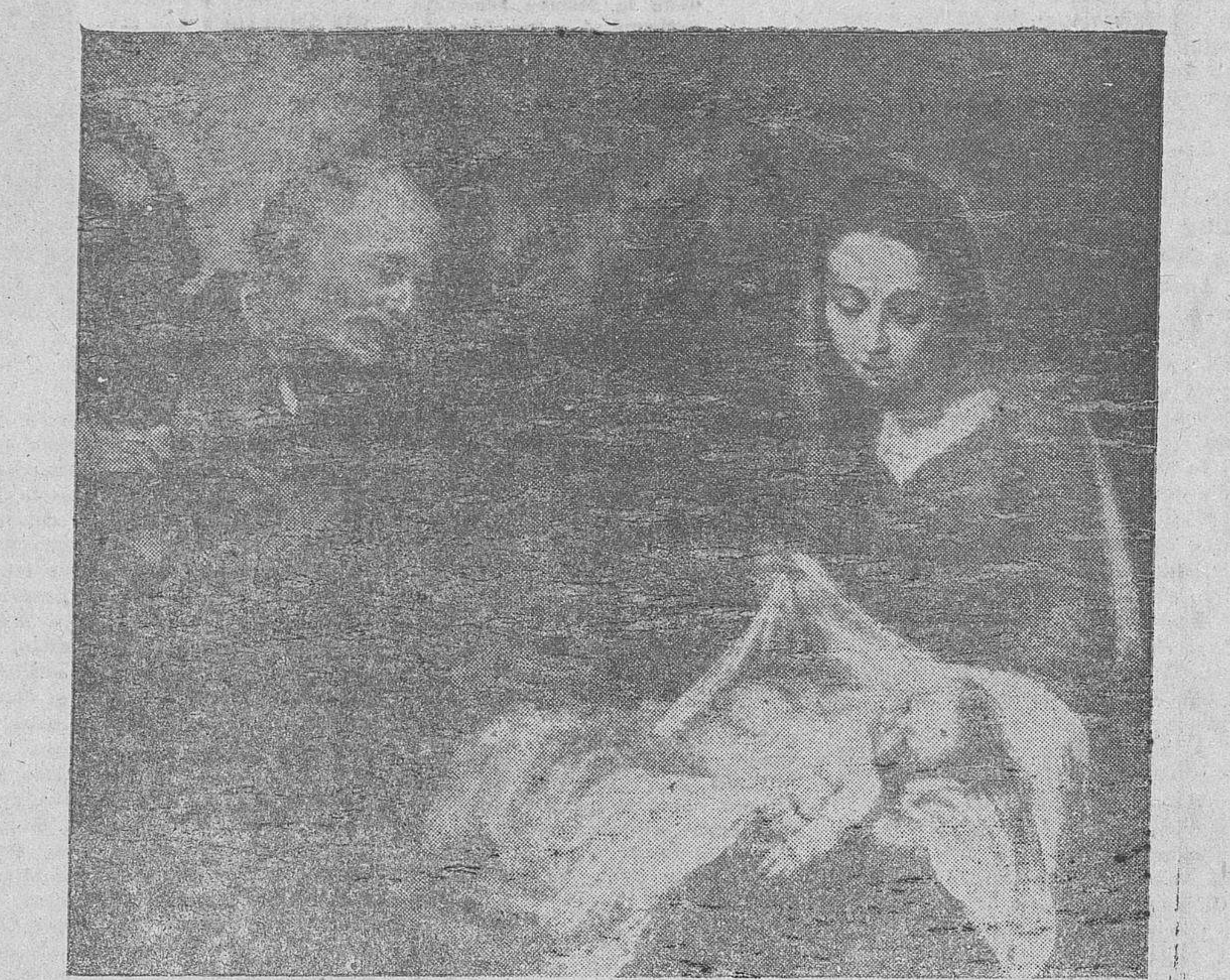
Fuierz decirse que en este lienzo del inmortal Murillo, la imagen de la Purísima Doncella es la rima pictórica de la musa con que el Félix canta el Nacimiento del Mesías

Blanco trigo y pajas, panal sabroso, que en la cara virgen cupiste todo, pajarrico en nido, que cantabas quejoso, porque de alba os cubran nevados copos, perla de aquel nácar que al salir Apolo recibió el rocío intacto y glorioso,