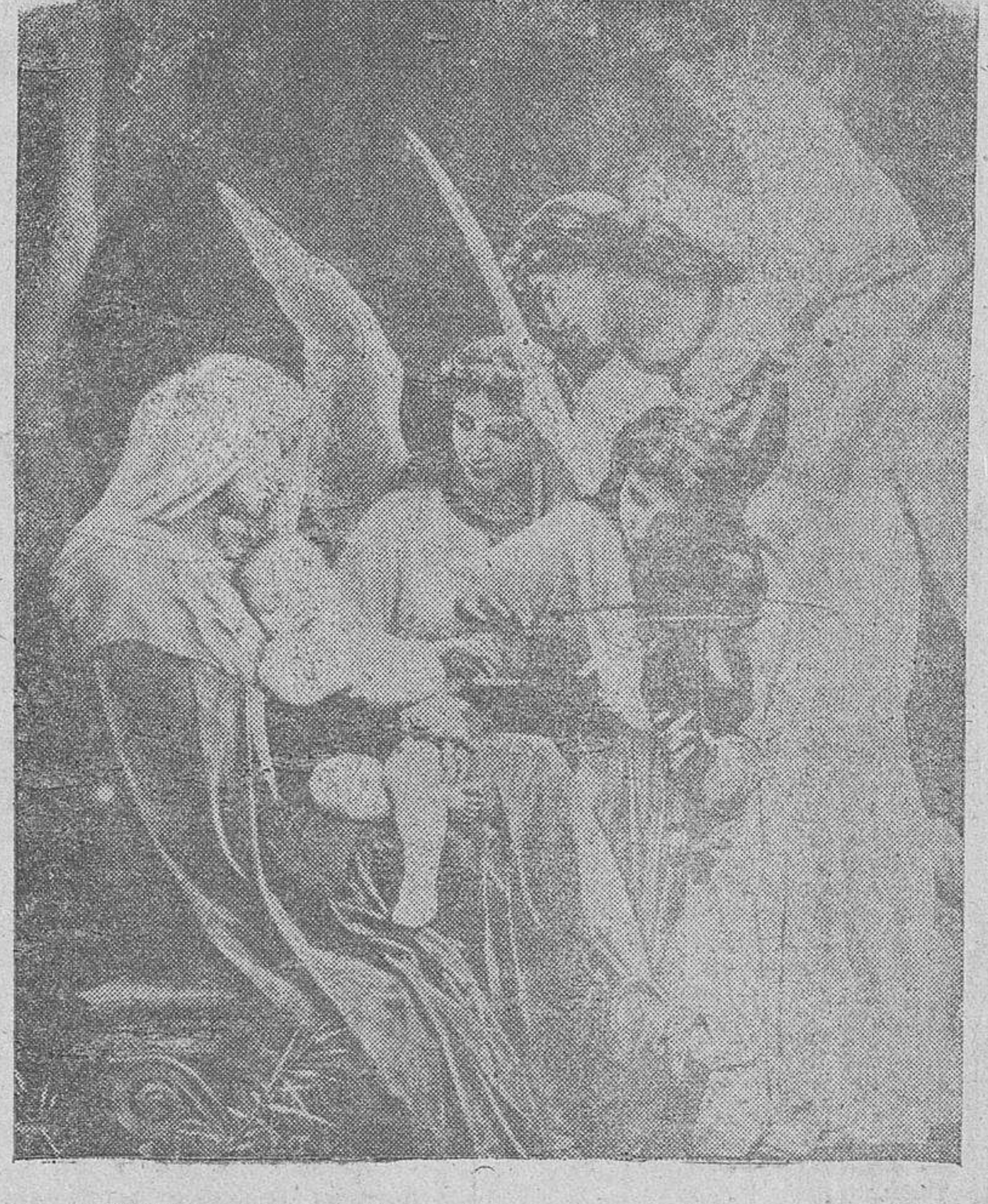
"Natividad", cuadro de Bouguereau

El ver las estrellas me causa enojos, pero vuestros ojos más lucen que ella, ya sale con ellas la noche oscura, a vuestra hermonura la luz se esconde: "mas quien lleva el sol no teme la noche." Maravillosa inspiración la del poeta inmortal que de tan preciosas galas supo revestir las imágenes y abrigar los loores, encendiendo con el fuego de su inspiración los corazones devotos que por los siglos se recrean y repiten su cantar, en estrofas del Dios-Niño, que nació en Belén. J. MUÑOZ SAN ROMAN