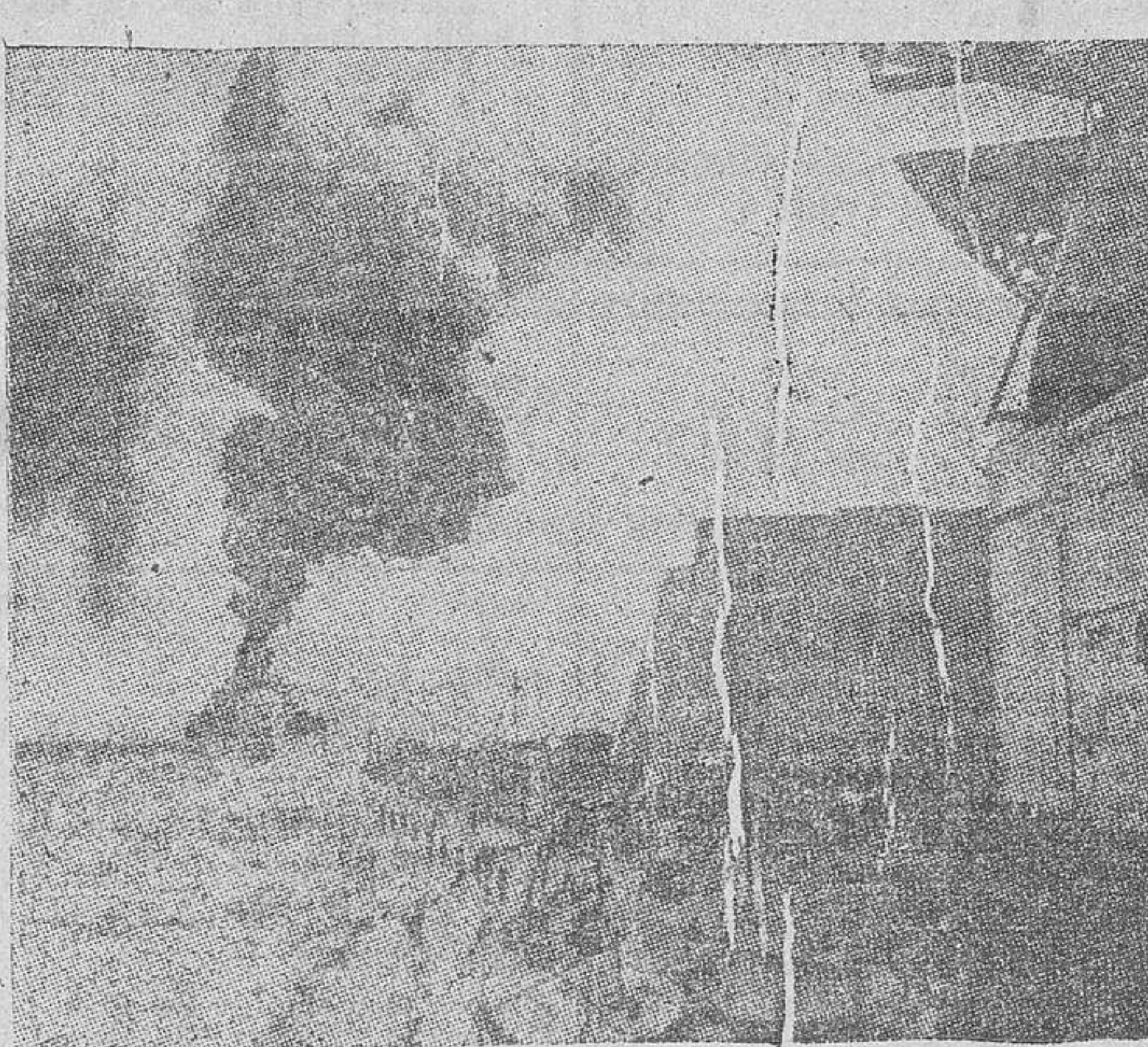
Duques de guerra ingleses prestan servicio de vigilancia en aguas del mar del Norte