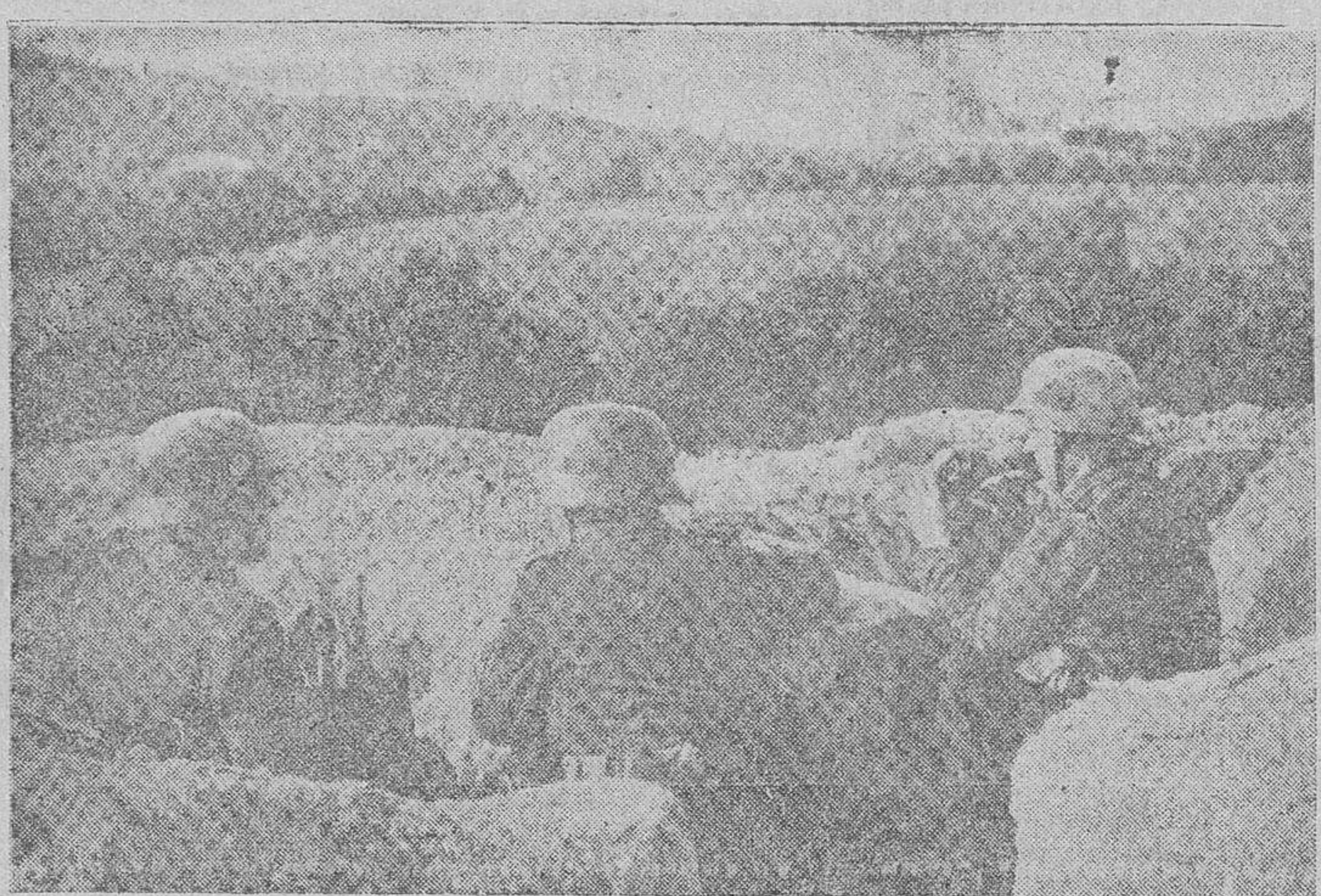
Soldados alemanes en un puesto avanzado de vigilancia, en territorio polaco

Mañana, lunes, a las diez y media, y organizada por el Regimiento de Infantería «La Victoria», se celebrará, en la iglesia de los reverendos padres Dominicos, de esta capital, una solemne fiesta religiosa en honor de los gloriosos caídos de dicho Regimiento. Al piadoso acto, en el que dirá un responso el ilustrísimo Prelado de la diócesis, están invitadas todas las autoridades, y por estas líneas se hace también al pueblo salmantino.