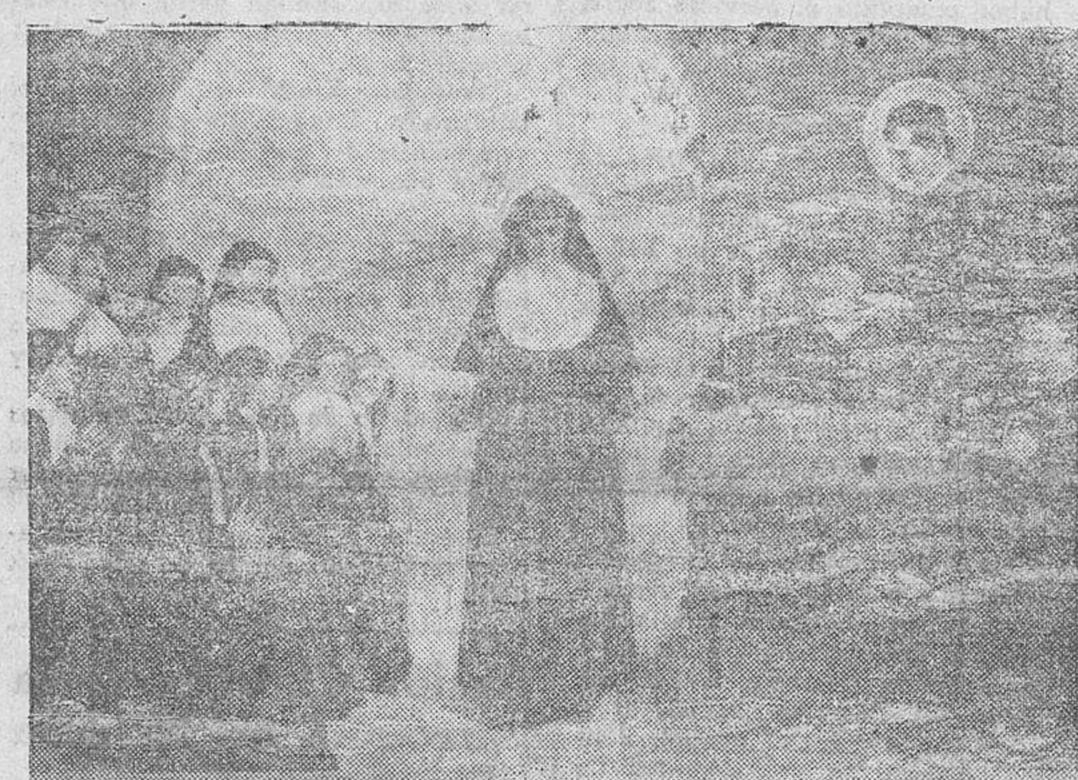
Reproducción de un cuadro publicado por "L'Osservatore Romano" el día de la beatificación de la Madre María Mazzarello, representando la escena en que la Beata fue nombrada Superiora por San Juan Bosco

La primera fundación fue la de Sarriá, siguiendo después las de otras muchas ciudades, entre las que se cuenta Salamanca