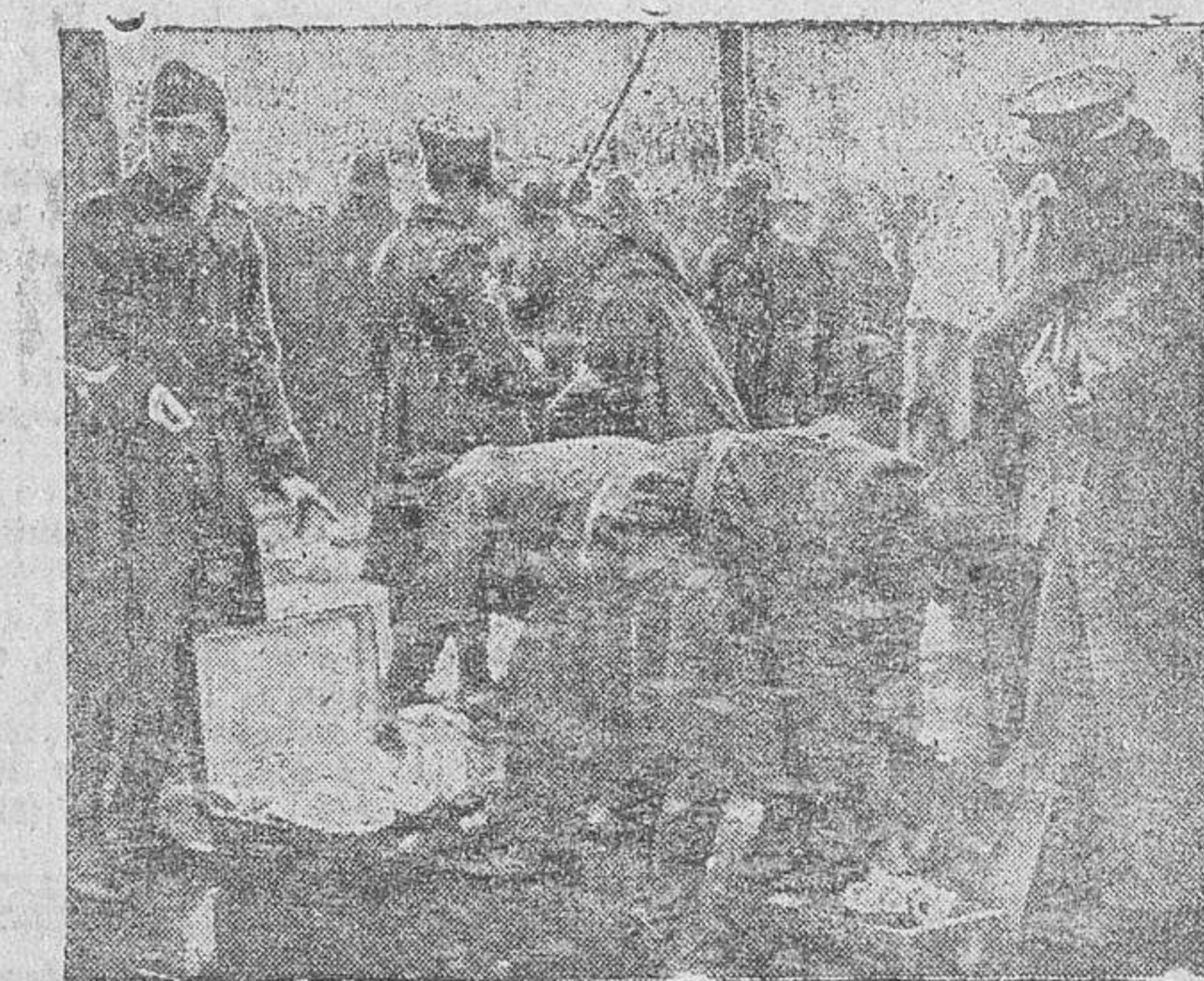
La gendarmería francesa registra cuidadosamente los equipajes de los milicianos rojos, que atraviesan la frontera en alocada huida ante el victorioso avance de nuestro Ejército

Poco después de las cuatro y media ha llegado al Perthus la primera sección militar de las tropas rojas españolas; desde entonces no