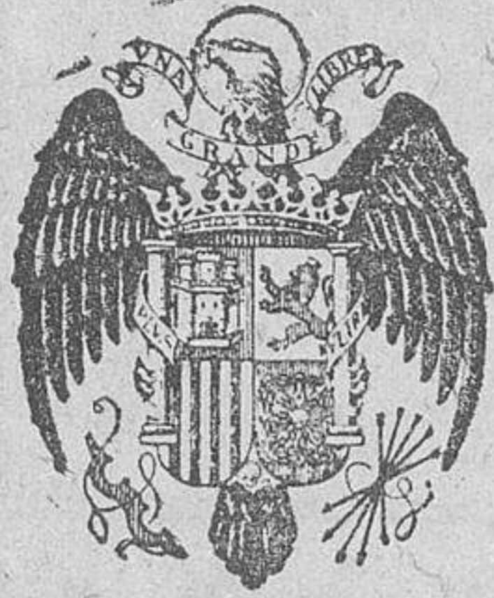
PARTES OFICIALES DE GUERRA

«Si alguien ha entrado en negociaciones con una persona que no es judía y entonces viene otro judío en su auxilio y engaña al que no lo es en peso, número y medida, la ganancia se reparte entre los dos judíos, incluso cuando el auxiliar ha recibido una remuneración por su trabajo.» (Choschen hamispat).