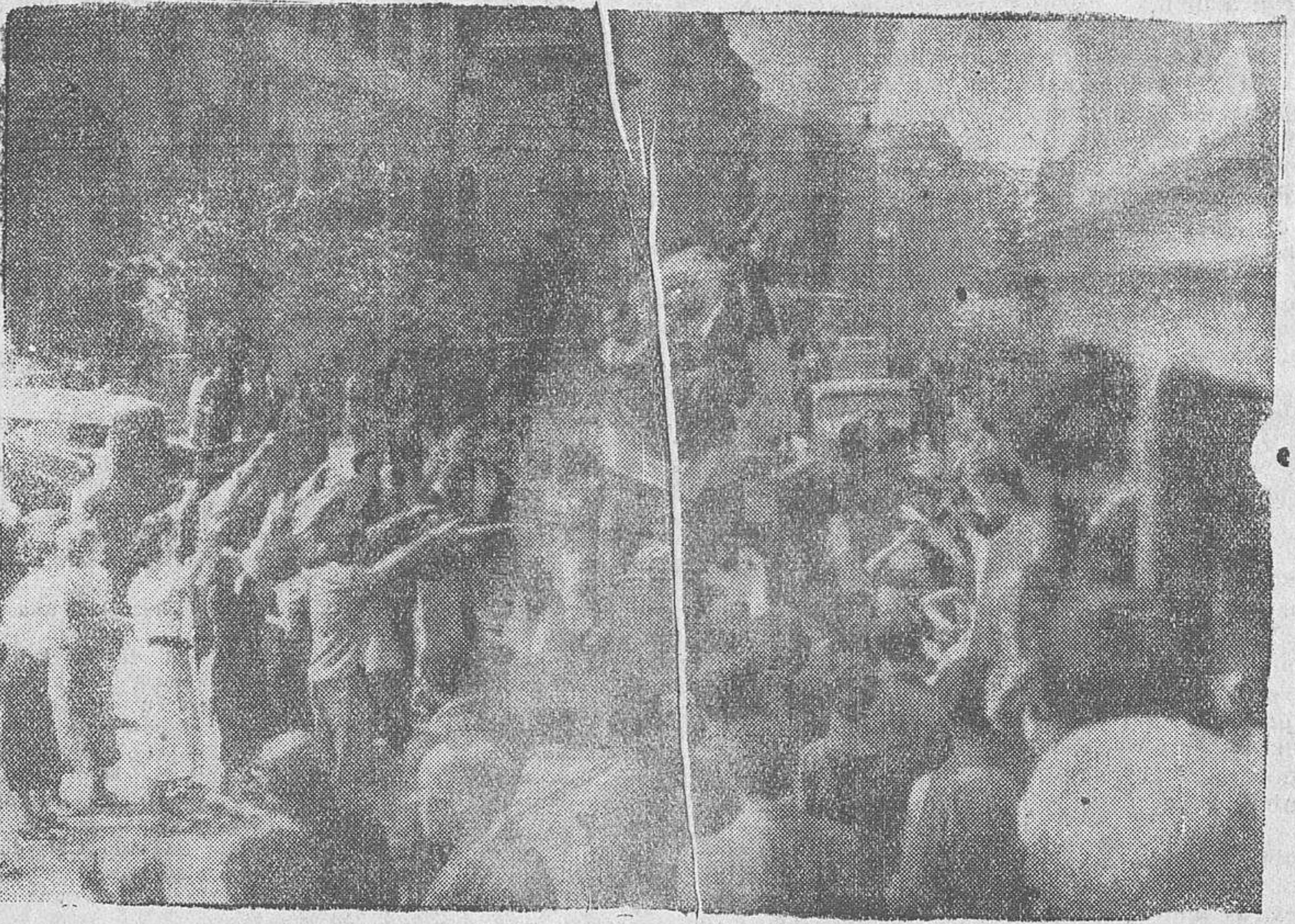
Uno de los momentos emocionantes de la entrada de las tropas nacionales en Santander.