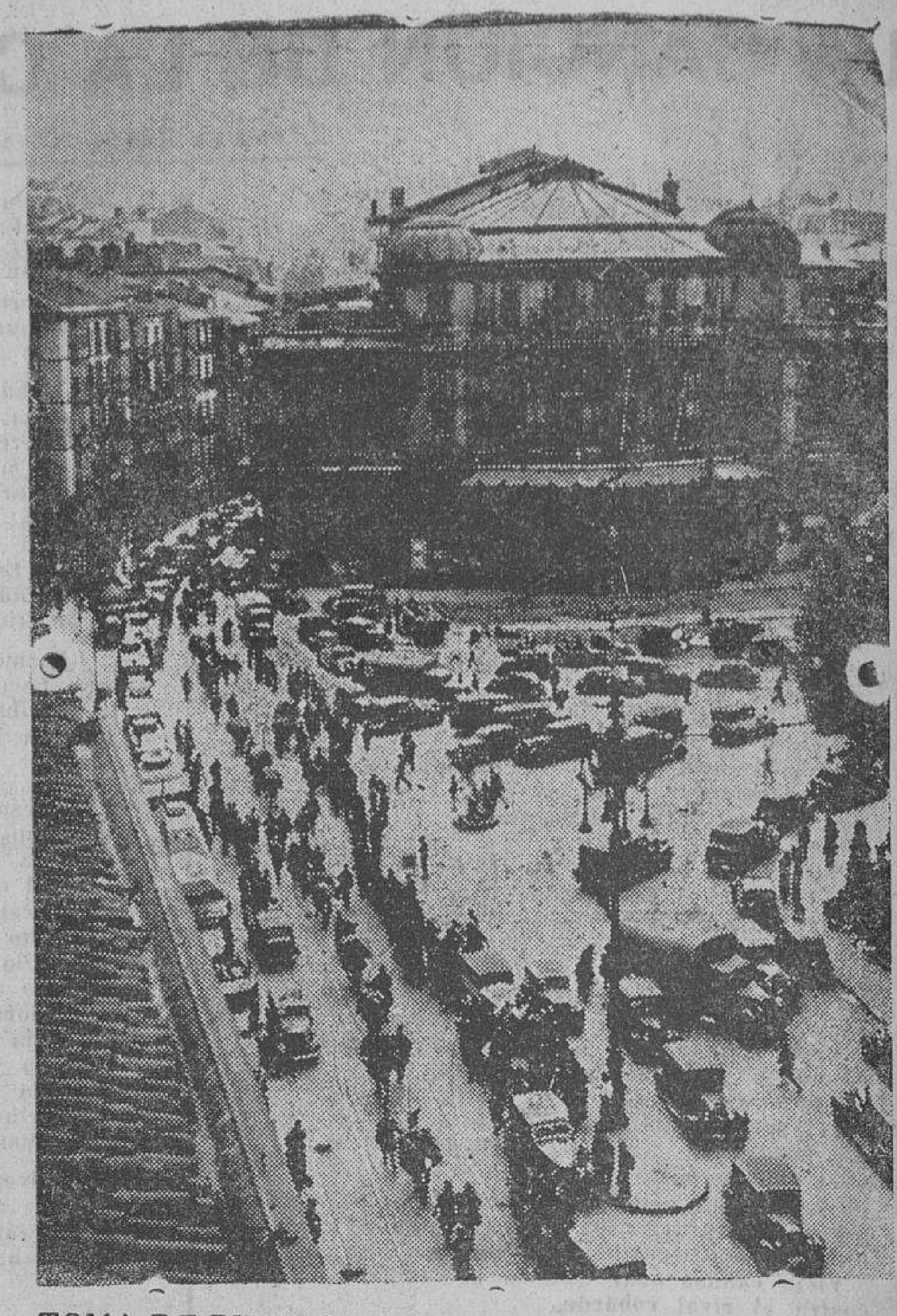
TOMA DE BILBAO.—Aspecto de la ciudad a las pocas horas de entrar las victoriosas tropas de Franco: Al fondo, el teatro Arriaga