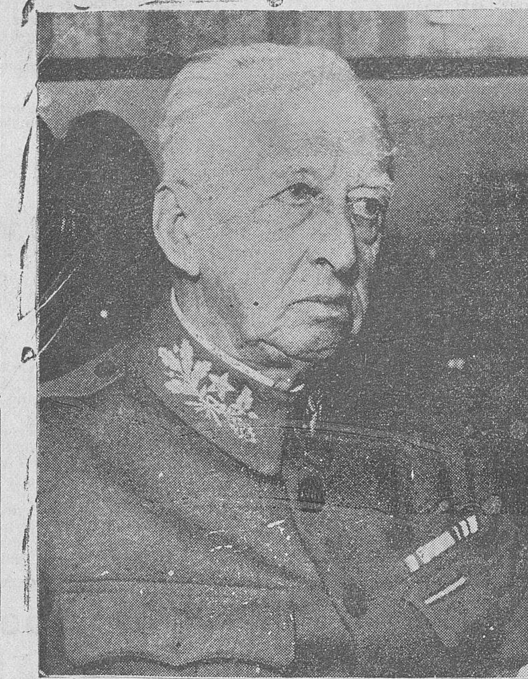
El excelentísimo señor don Jesús Ferrer Gimeno, nuevo Gobernador civil de la provincia de Salamanca, que anteaayer se posesionó de su cargo.