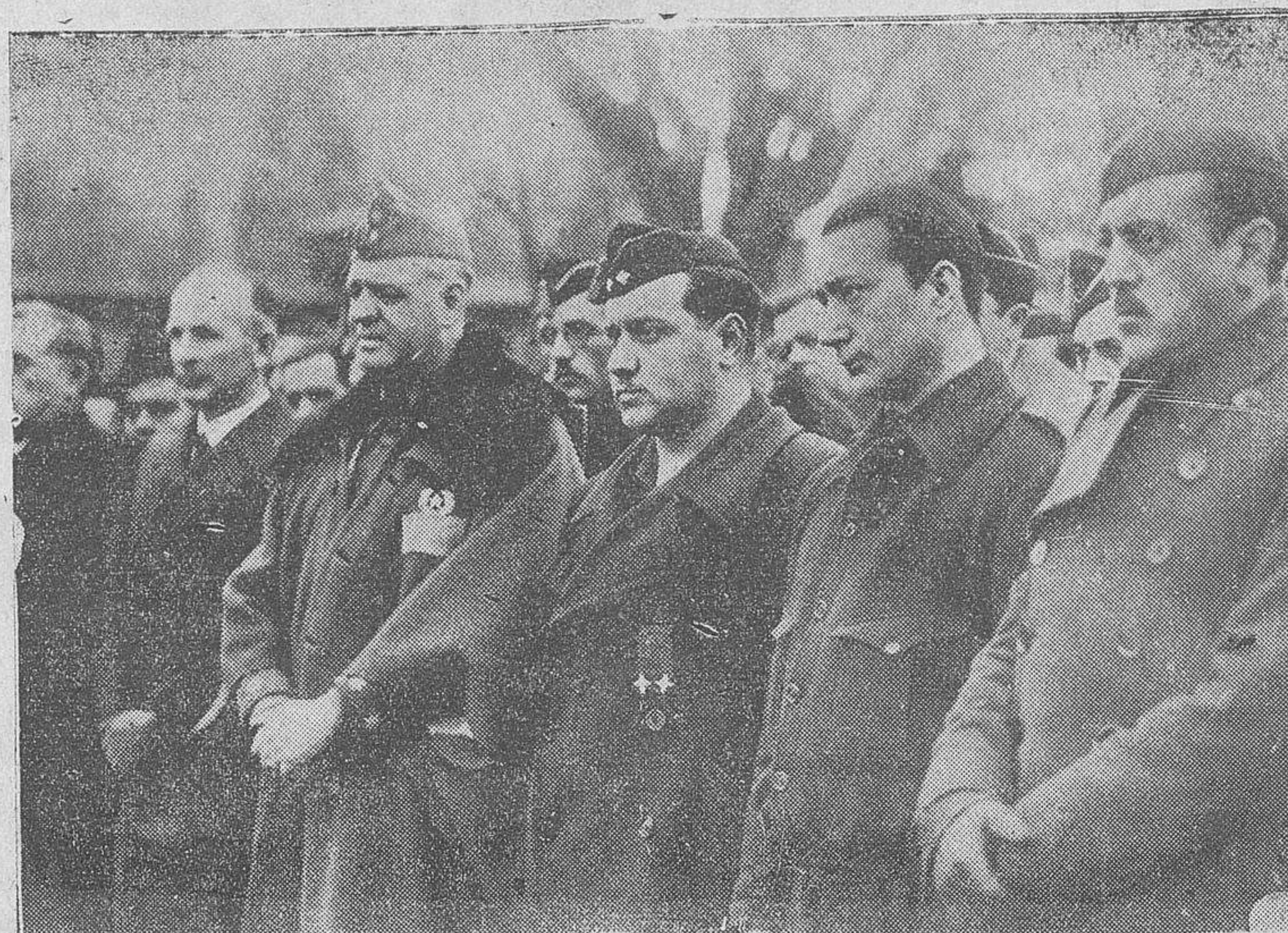
Presidencia del duelo en el entierro del cadáver del hijo de Manuel Hedilla, jefe nacional de la Junta de Mando Provisional de F. E. de las J. O. N. S.

Sinceramente creemos que el programa satisfará a los más exigentes. La música religiosa, las canciones castellanas y las partes alemana e italiana, forman un conjunto com-