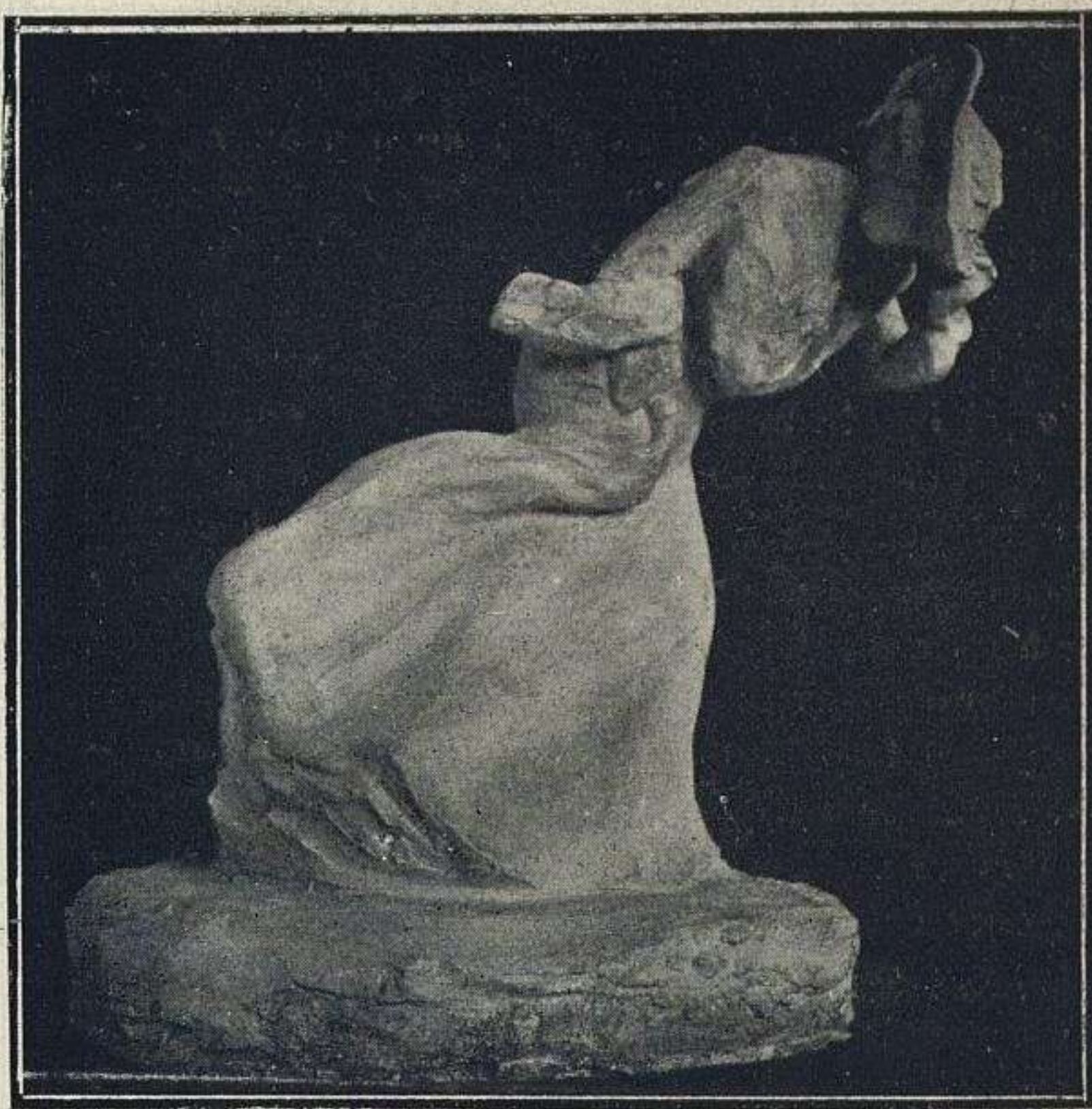
GOLPE DE VIENTO, POR ALEJANDRO VILLODAS

todo, algunos párrafos extractaremos, pues merecen ser conocidos por todos los artistas.