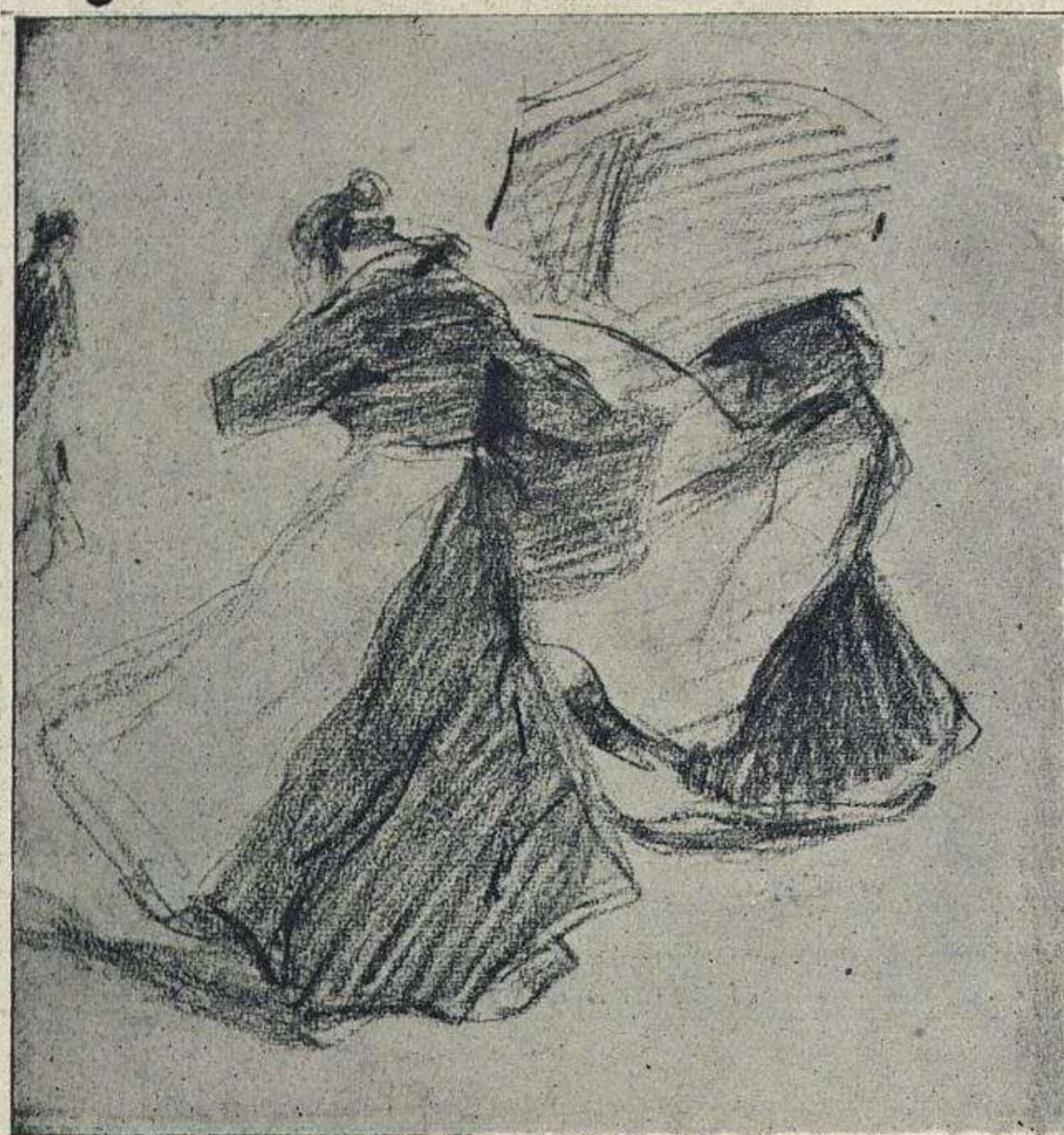
APUNTE, POR F. VILLODAS

duos se dedican á la pintura y á la escultura y en cuantas personas sienten amor por estas manifestaciones de la expresión artística.