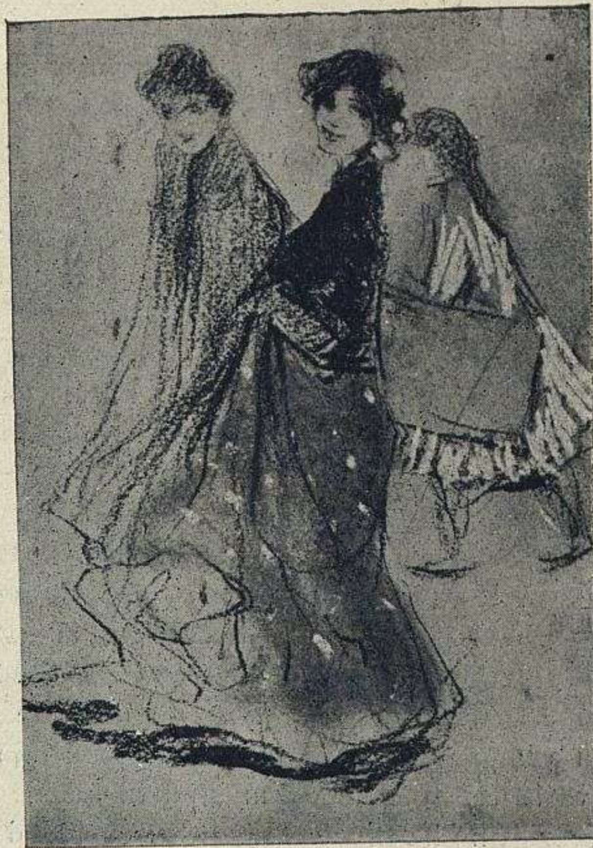
APUNTE, POR F. VILLODAS

El hondo sentimiento de las formas y la exquisita percepción de las líneas que las limitan y describen en todos sus aspectos de conjunto y de detalle, constituyen una cualidad de carácter meramente gráfico con la que se hacen maravillas de caracterización de finura y elegancia, mas cuando ese sentimiento del conjunto y de la línea va como englobado en el total del color, más que los límites de las formas y que sus detalles descriptivos, se siente la intimidad de la vida que encierran, y como la vida es palpación y, por consiguiente, movimiento, el que siente la vida ha de reflejarla de cierto modo movida y en totalidad. Esa totalidad, esa visión abarcadora, permítaseme la palabra en gracia á lo bien que expresa mi idea, es la del colorista que