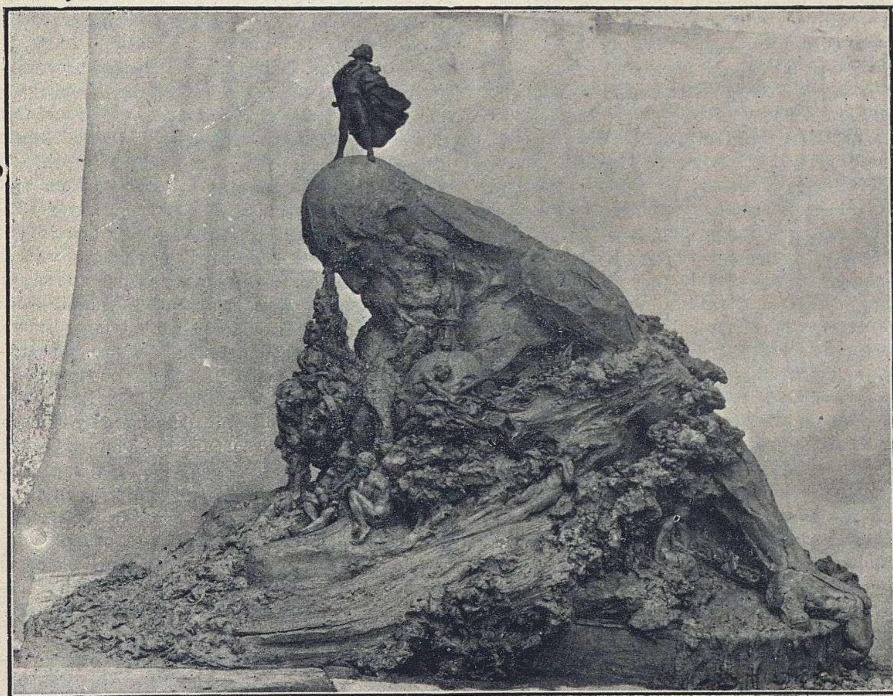
PROYECTO DE MONUMENTO Á ESPRONCEDA, POR CABRERA