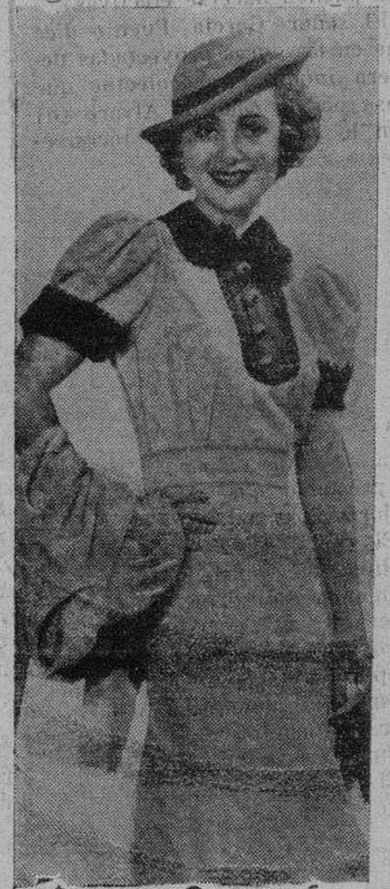
Traje de punto de seda beige con adornos de azul vivo