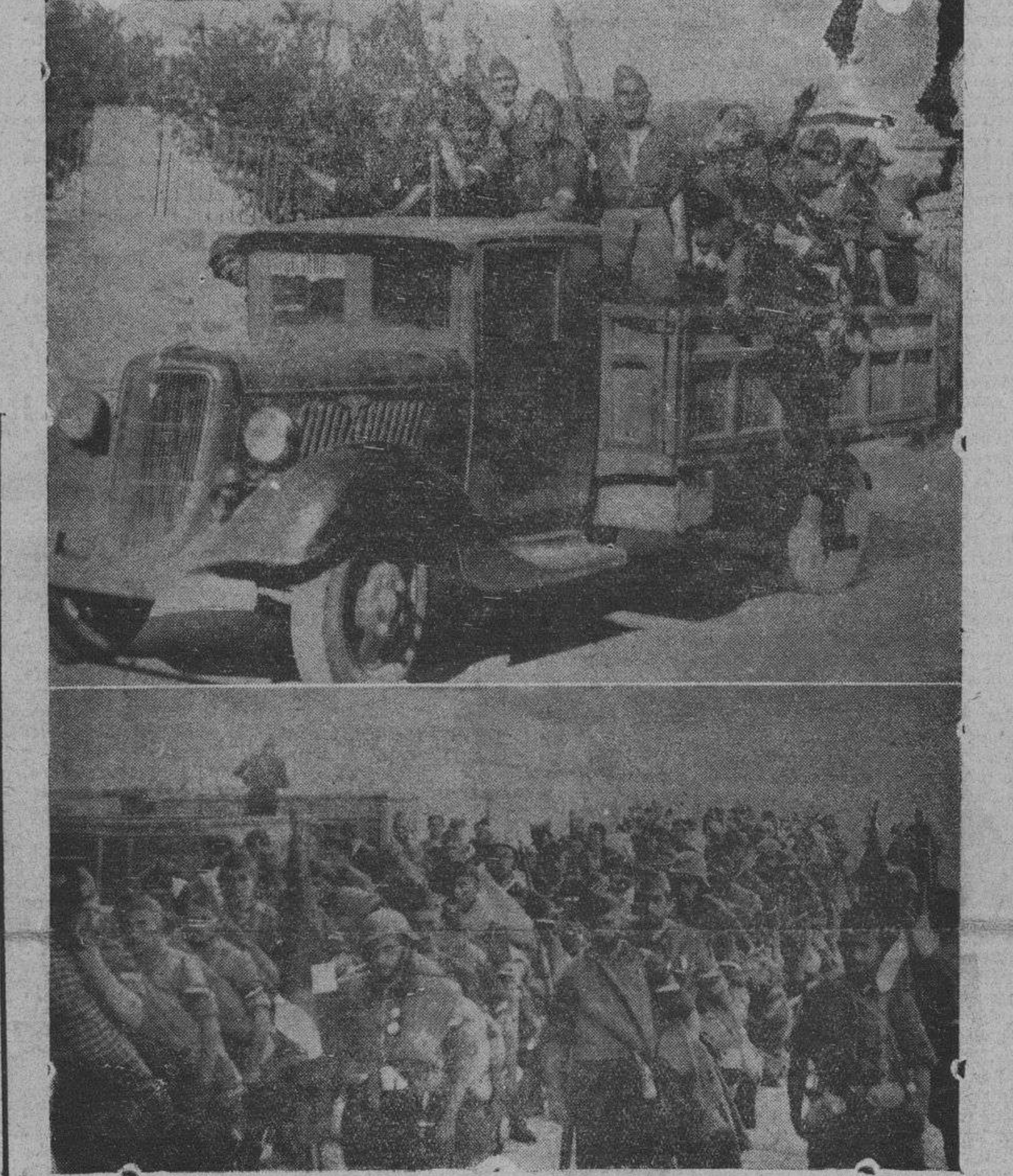
Dos momentos de la llegada de la centuria de Falange Española, que ayer regresó del frente de El Espinar y que fué objeto de un entusiasta recibimiento

horizontes y restaurará su grandeza y su historia, dando todo por ella hasta morir, y jamás capitular. (En este momento se oyen grandes aplausos, y el orador dice: Agradezco estos aplausos, que los recojo para postroarlos ante Cristo Rey). ¡¡¡Arriba España!!!