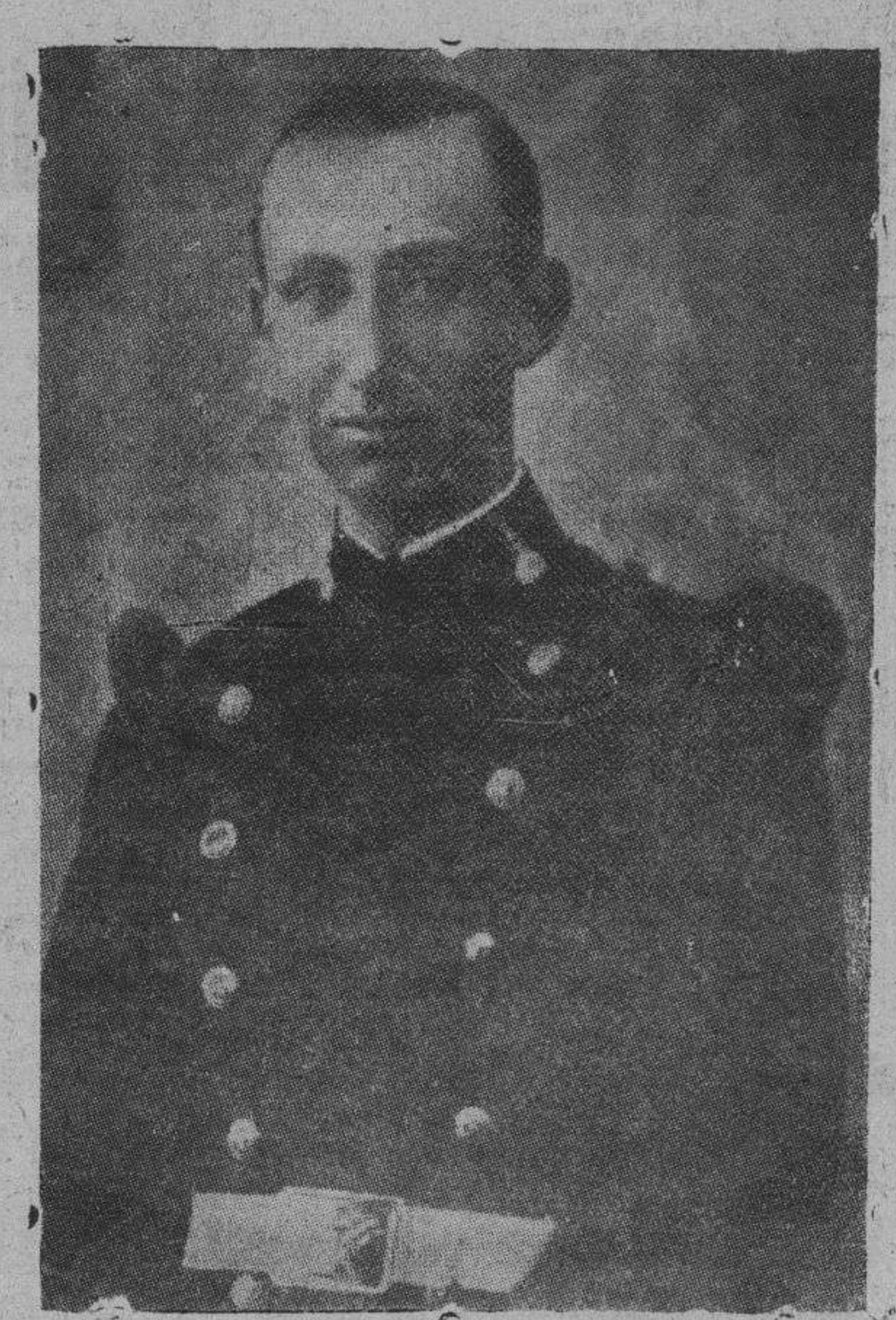
El requeté S. A. R. el Principe don Carlos de Borbón y Orleans, muerto gloriosamente en el frente de Eibar