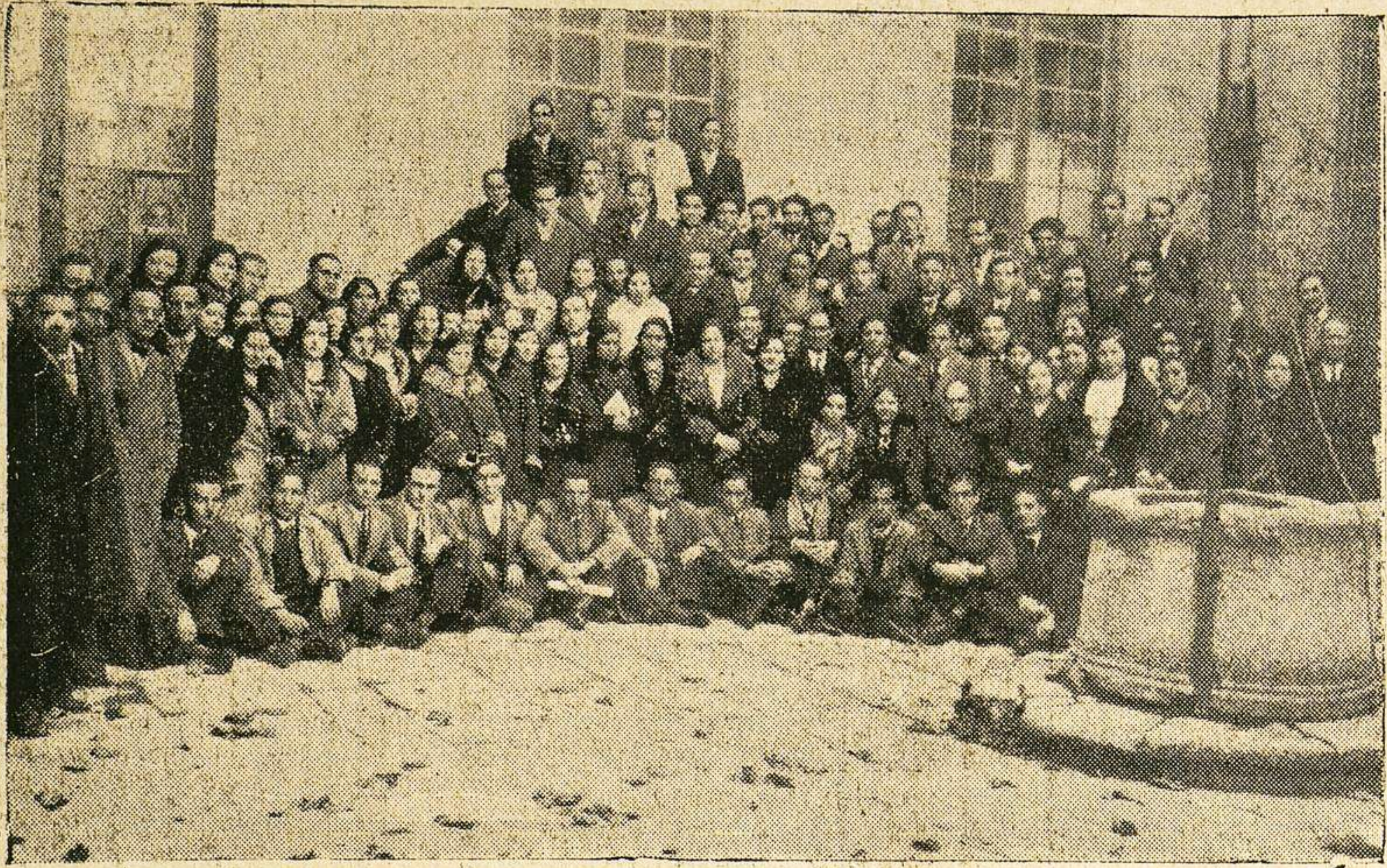
Cursillistas del segundo grupo que se hallan des arrollando la tercera parte del cursillo del Magisterio.