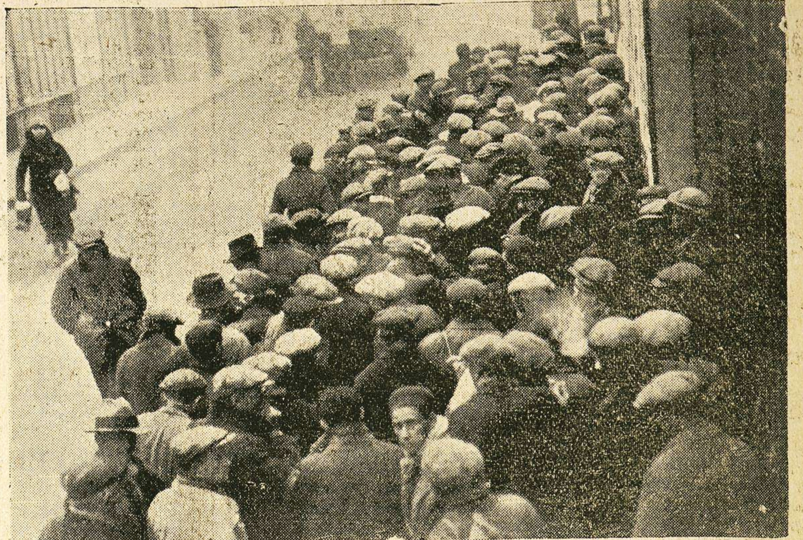
Como todos los inviernos, la sopa popular de París, ve aumentar considerablemente su clientela. Sobre todo desde hace unos días, que reina un frío de ocho bajo cero. La foto reproduce la cola que forman los menesterosos, delante del tercer distrito, donde se distribuye cada mañana la sopa popular.