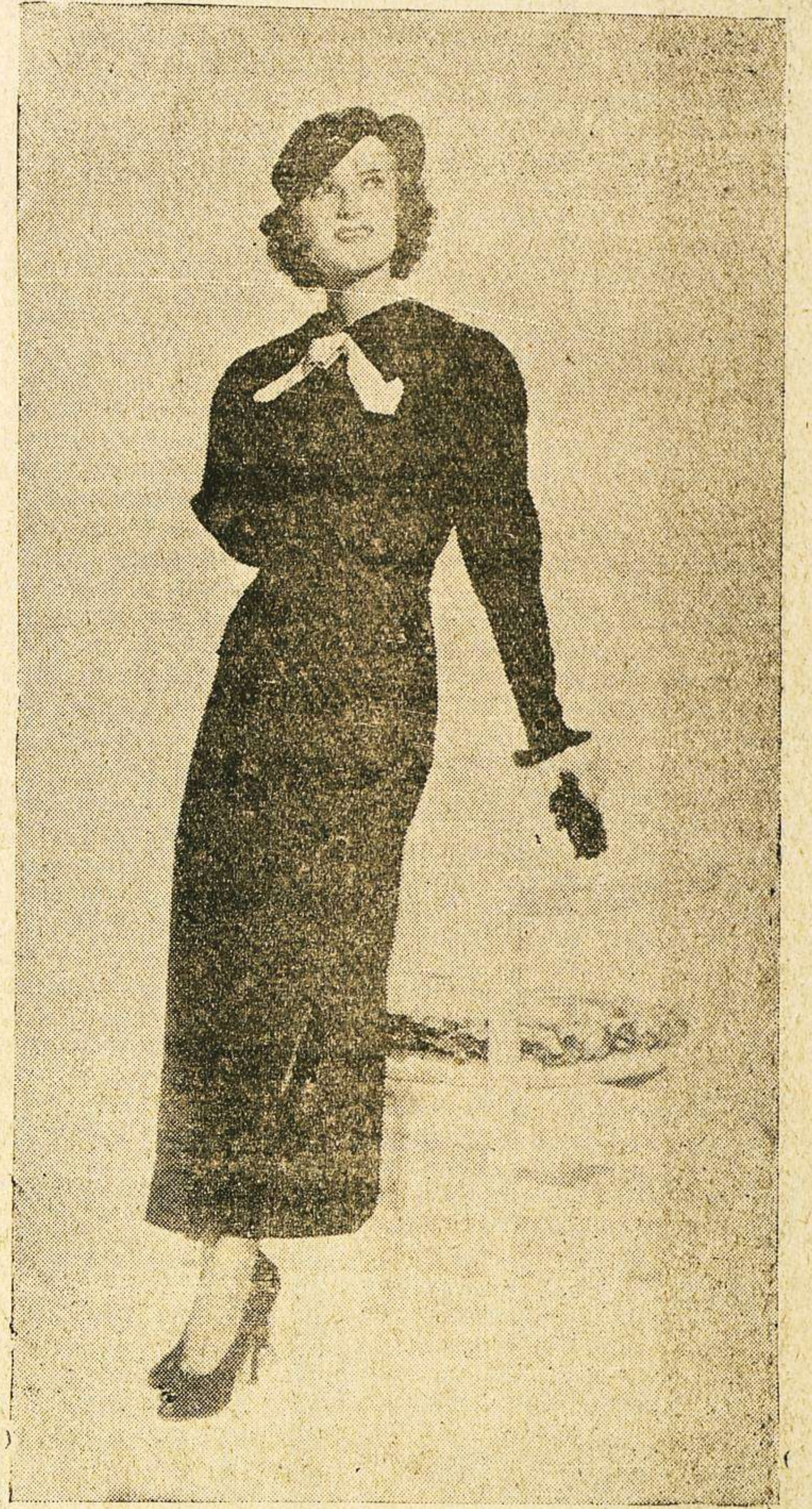
Florine Mokimney, joven actriz de la Metro-Goldwin-Mayer, luce en esta fotografía un elegante traje negro con corbata de gro blanco