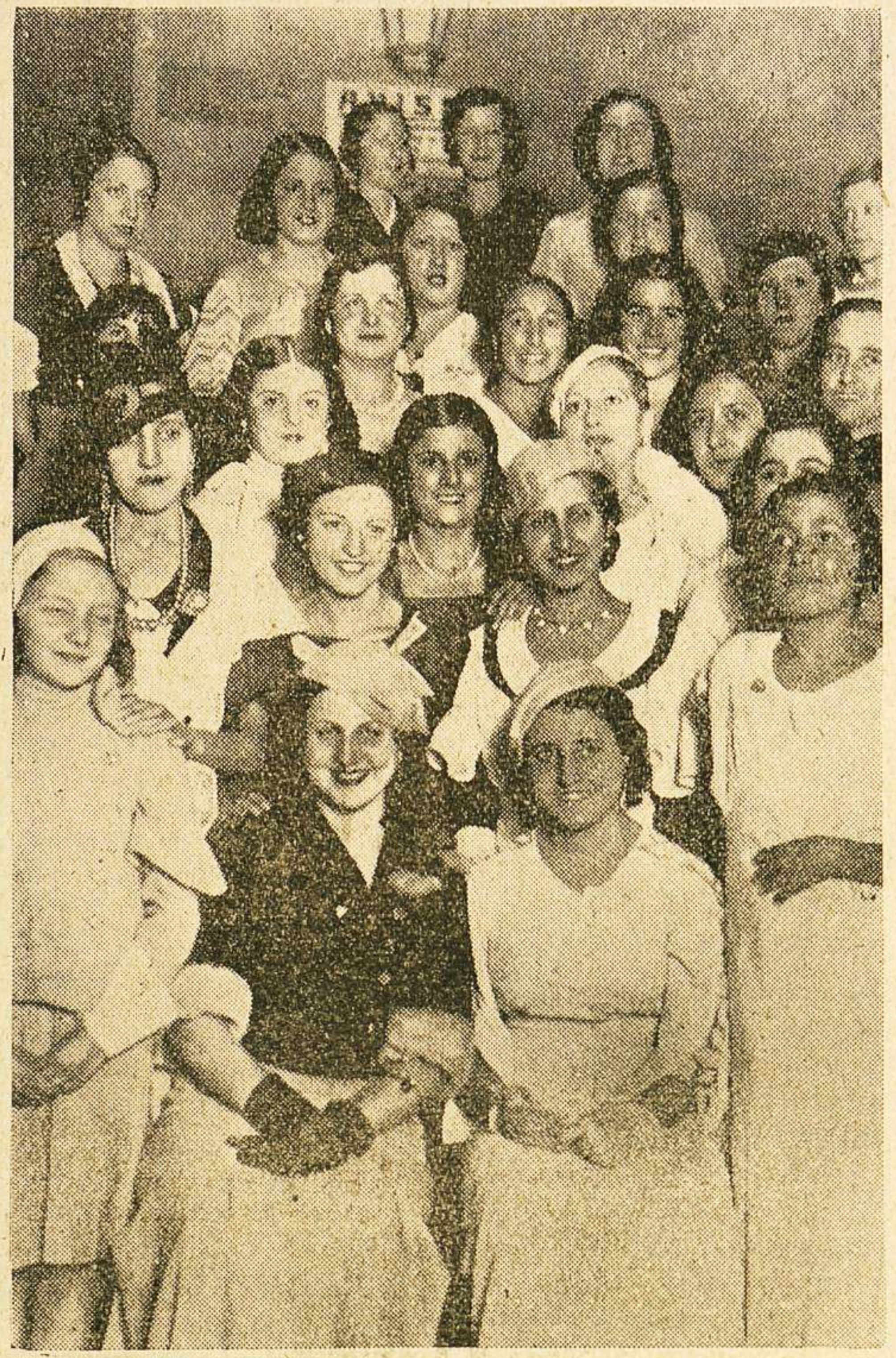
Miss Vitigudino y la Moza Charra, acompañadas de un grupo de señoritas que concurren a la velada de la Casa Charra, de Madrid, dada en honor de la señorita primera belleza de Vitigudino

Con el mayor gusto nos hacemos intérpretes del agradecimiento sincero de la "Señorita Vitigudino",