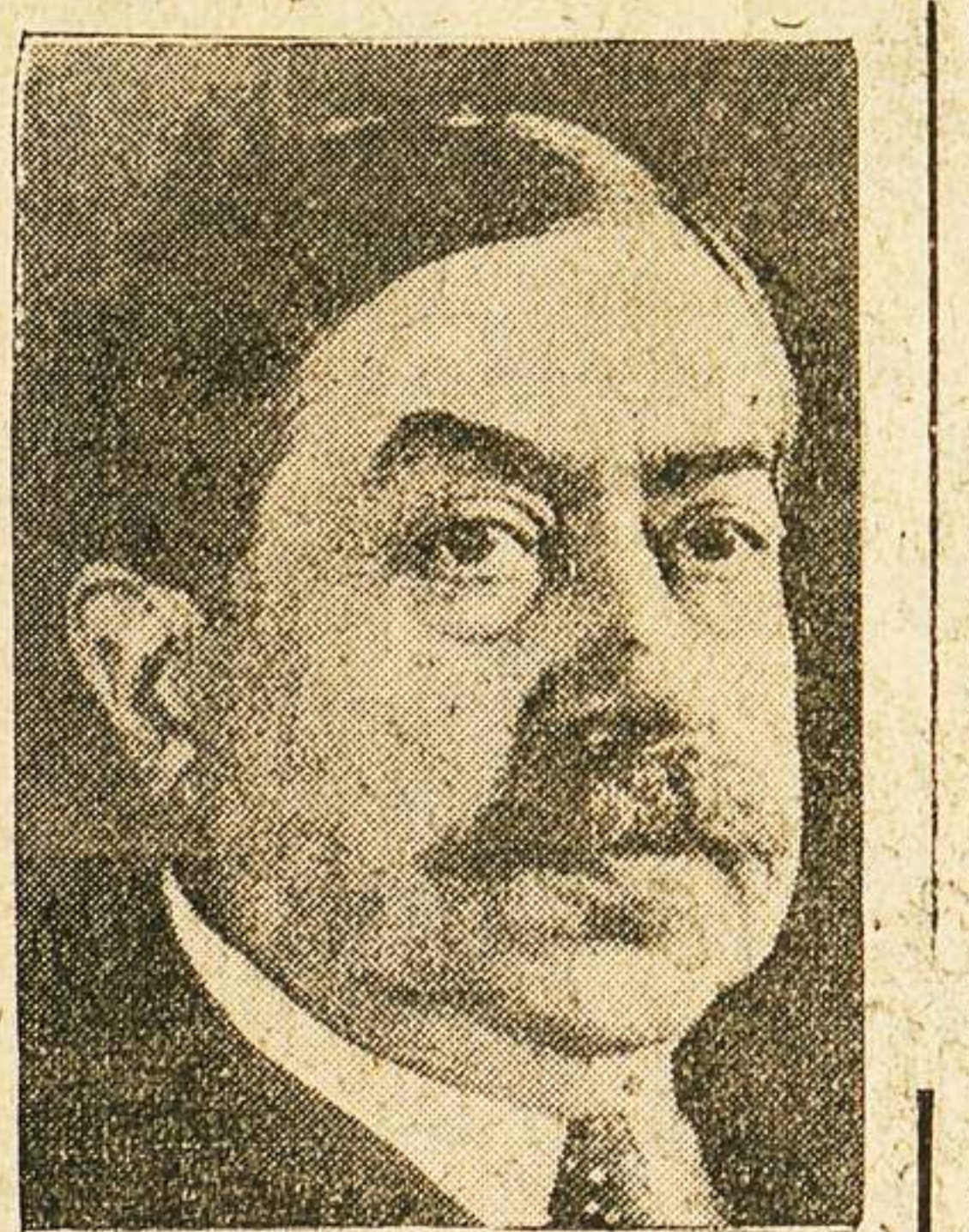
M. Paul Painlevé, ex Presidente del Consejo de ministros francés, que ha fallecido en París, y cuyo cadáver recibirá sepultura el próximo día 4, en el Panteón Nacional