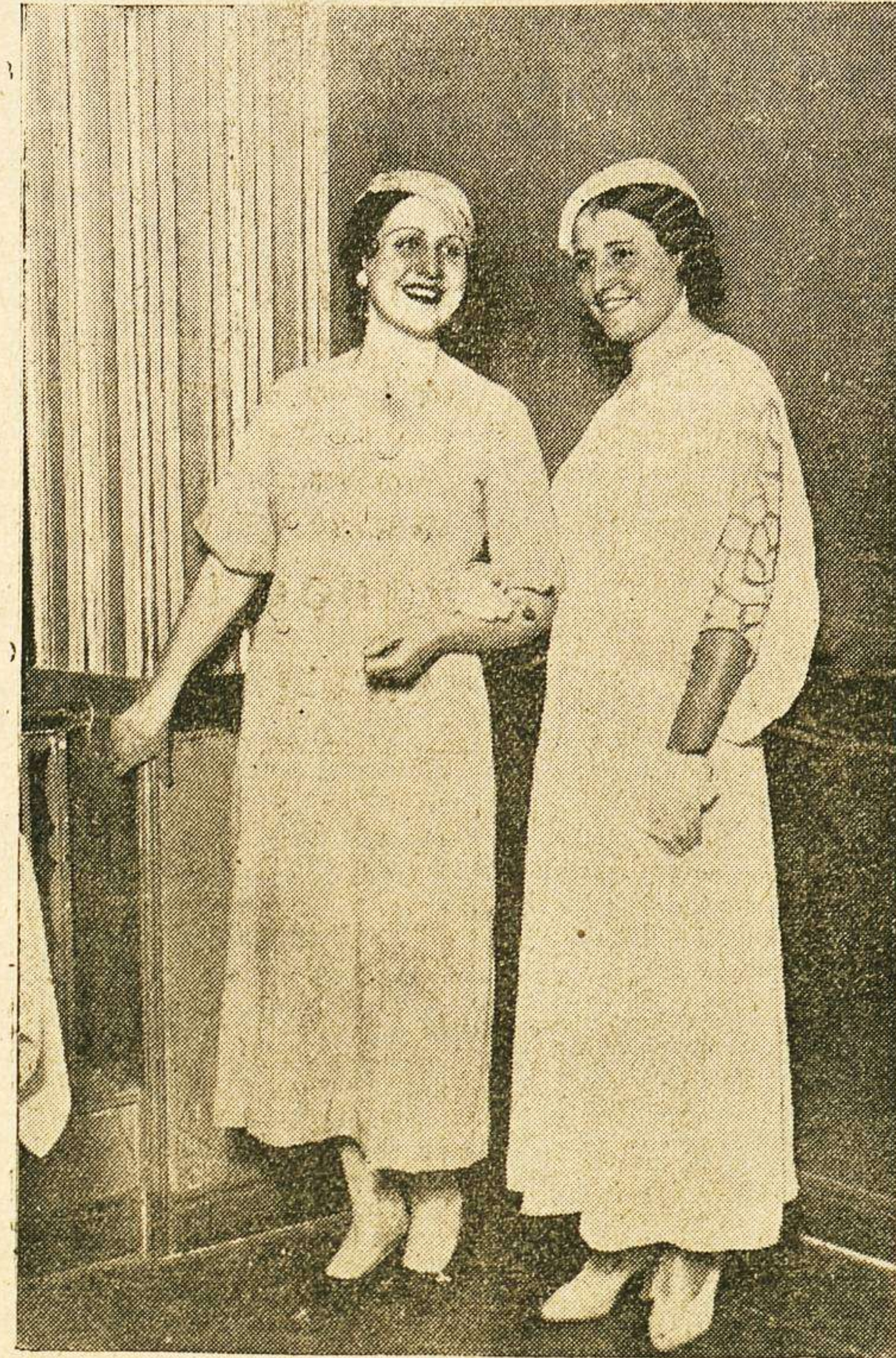
Miss Vitigudino acompañada de la Moza Charra en la fiesta celebrada en su honor en el Teatro Metropolitano, organizada por la Casa Charra, de Madrid