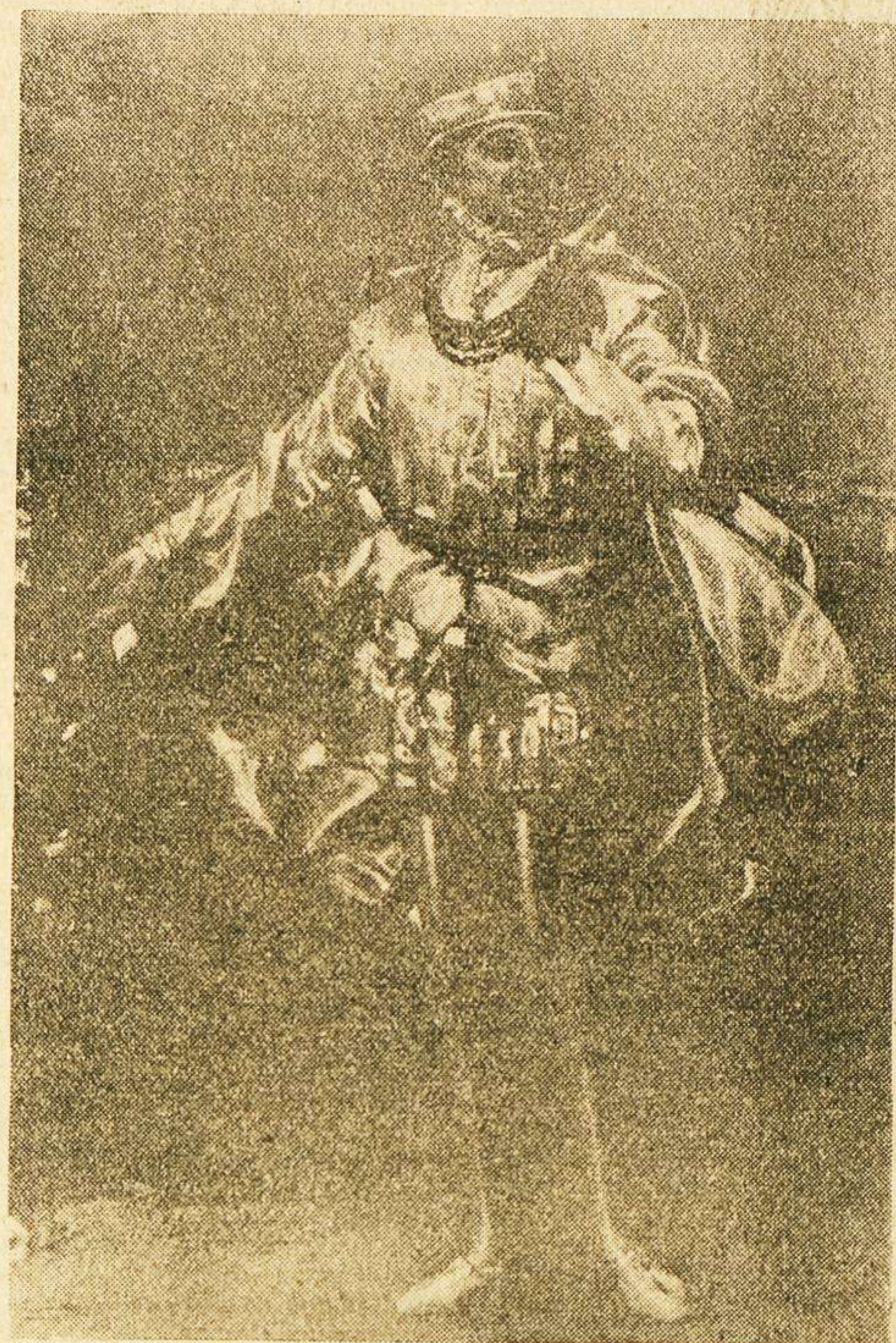
"Aquí está Don Juan Tenorio, para quien quiera algo de él".

Como siempre, como todos los años, al olor de las castañas asadas y de los huesitos de Santo, se asoma Don Juan a la ventana periodística, para hacernos desgranar los tópicos al uso. Y aquí está hoy. Nos parece, sin embargo, un tipo nuevo. No es el Don Juan de Tirso, ni el de Byron, ni el de Arnold Bennett. Ni tampoco el que eternizó Zorrilla. Es un Don Juan particular, este de Salaverría. Quizás es el que sirviera a Marañón para sus estudios de psicología.