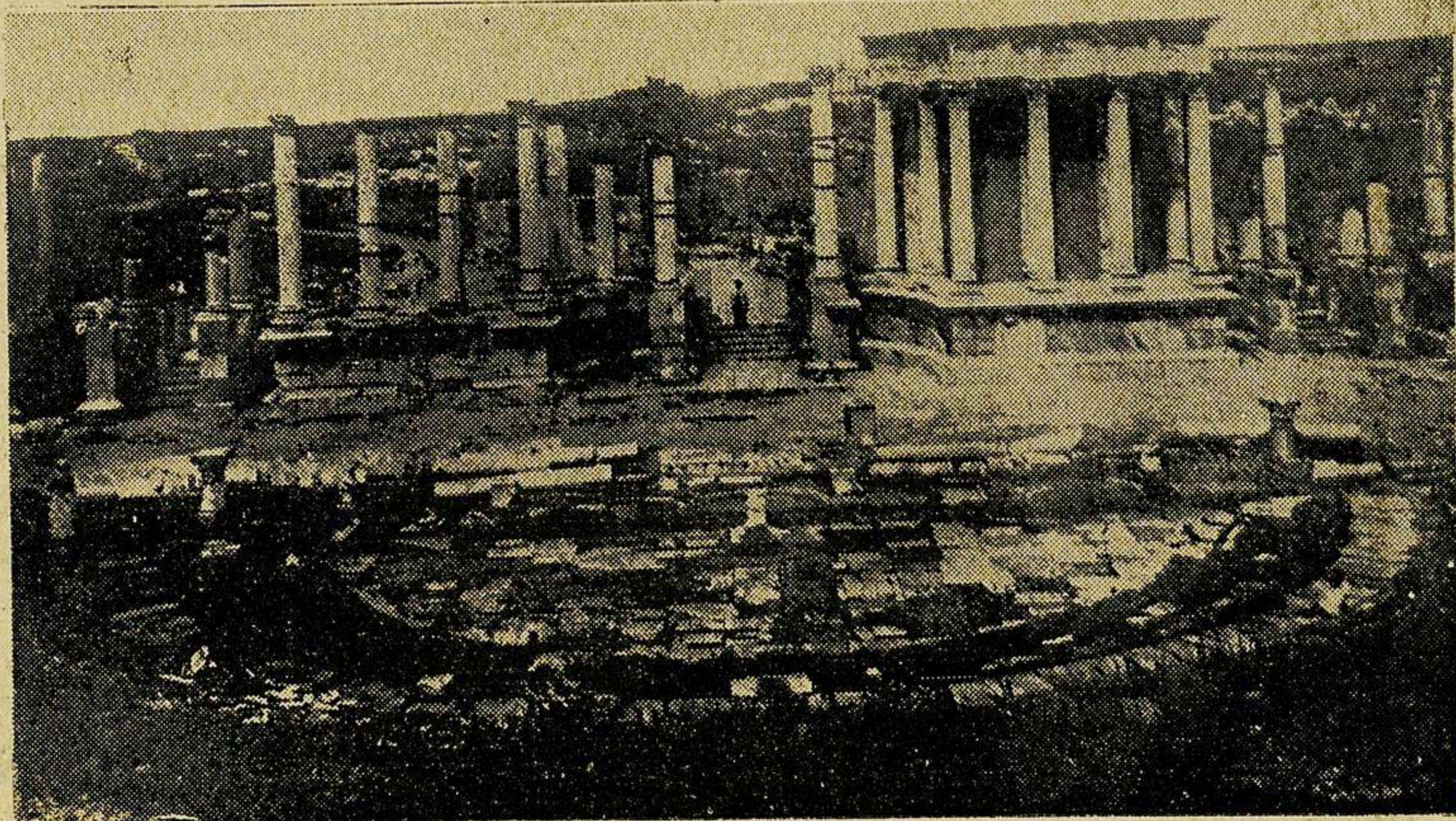
El teatro romano de Mérida, con su columnata de fondo reconstruida. Epoca de Trajano y Adriano. (Siglo II de J. C.)

Según la inscripción reconstituida por Hübnér, el teatro construido por Agrippa sufrió sin duda