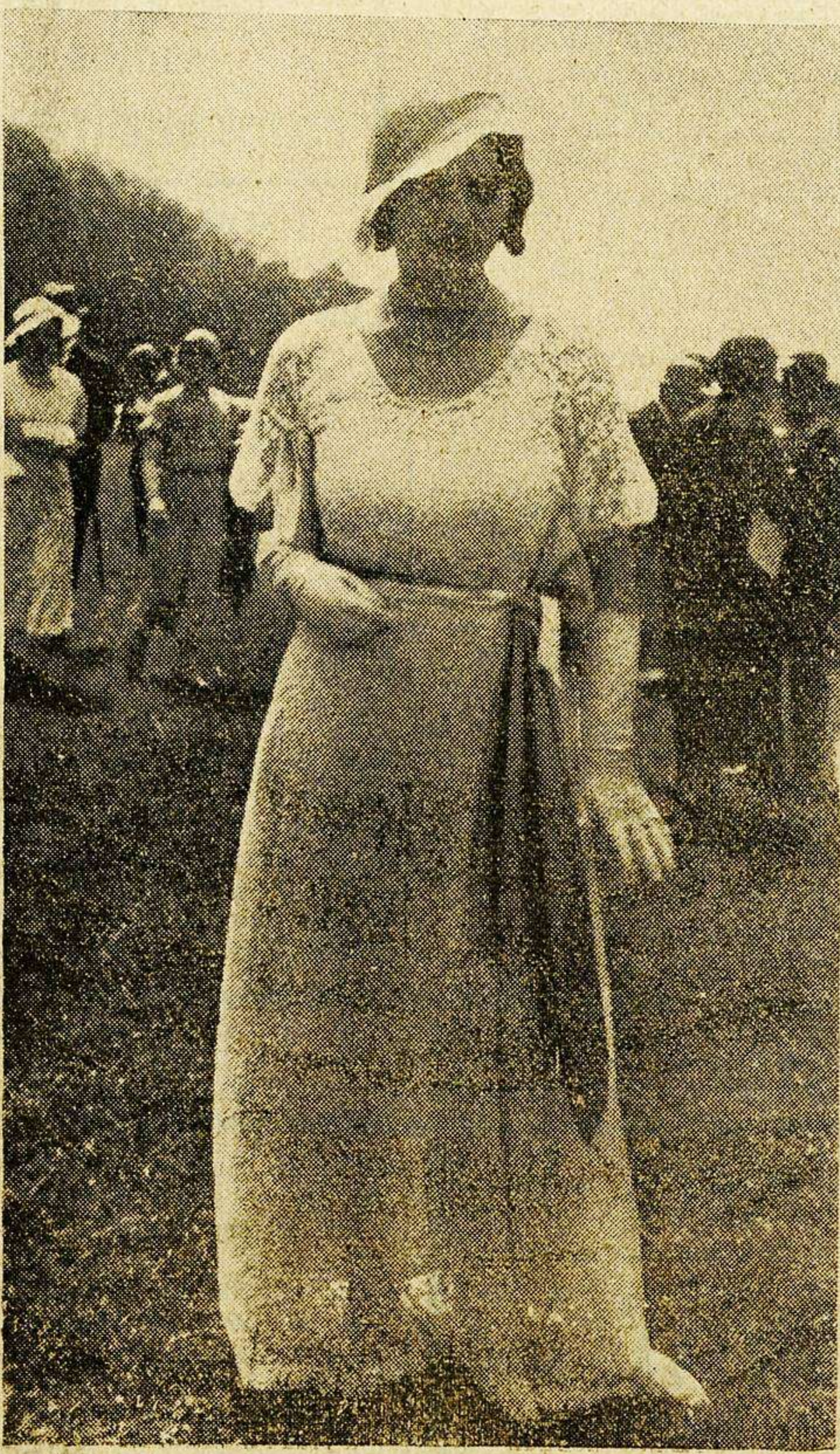
Con ocasión de la celebración del premio de "Diana" en Chantilly (París), hace su presentación oficial la moda de verano. He aquí un elegante vestido de dentelle blanco que llamó poderosamente la atención