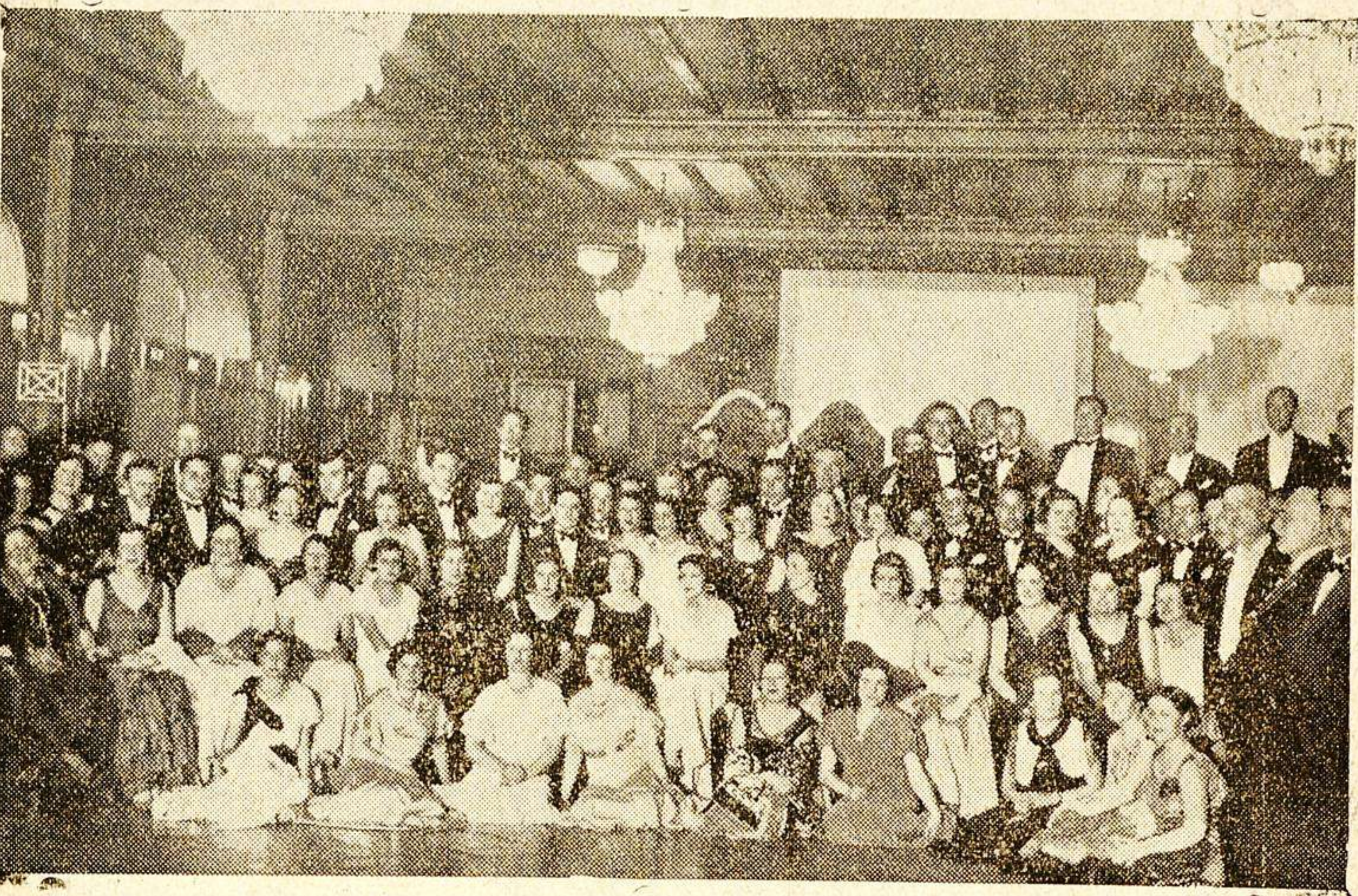
Recepción en honor a los congresistas y presentación de los delegados extranjeros